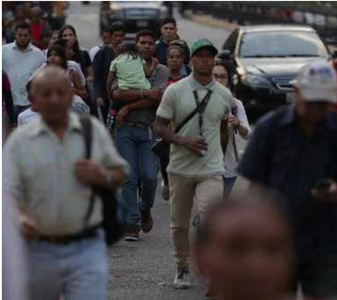
Cerrado el Metro de Caracas, el pueblo tuvo que caminar largos trayectos para llegar a su casa

Hay antecedentes del uso de la energía para fines in-