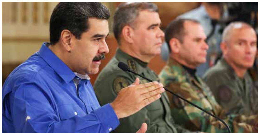
Trump quiere el caos y la violencia para Venezuela.

El presidente Maduro explicó que la gran mayoría de los profesionales militares y policías fueron convocados por engaño, porque no había un comando central. Los primeros que se retiraron fueron los efectivos del Sebin. Luego los de GNB. Las 8 tanquetas fueron prendidas por sargentos y tenientes y llevadas a sus co-