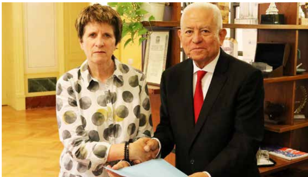
El embajador Jorge Valero, entrega la misiva a Kate Gilmore, Alta Comisionada Alternativa de la ONU para los Derechos Humanos.

Me pregunto y a la vez le pregunto: ¿Puede llamarse dictadura a un proyecto político legitimado 23 veces en las urnas electorales en los últimos veinte años? ¿Qué redujo la pobreza por necesidades básicas insatisfechas a un tercio de la que existía antes de la Revolución? ¿Que hizo de Venezuela el segundo país menos desigual del continente, produjo la más grande transferencia de riqueza de nuestra historia, transfiriendo 25% del ingreso hacia las clases medias y los sectores con menos recursos? ¿Puede llamarse dictadura a un Gobierno que en una Constitución votada por el pueblo, dió derechos por primera vez a los pueblos indígenas, a los niños, a las mujeres, a los adultos mayores, que ha visibilizado y otorgado derechos a las mayorías empobrecidas y las mino-