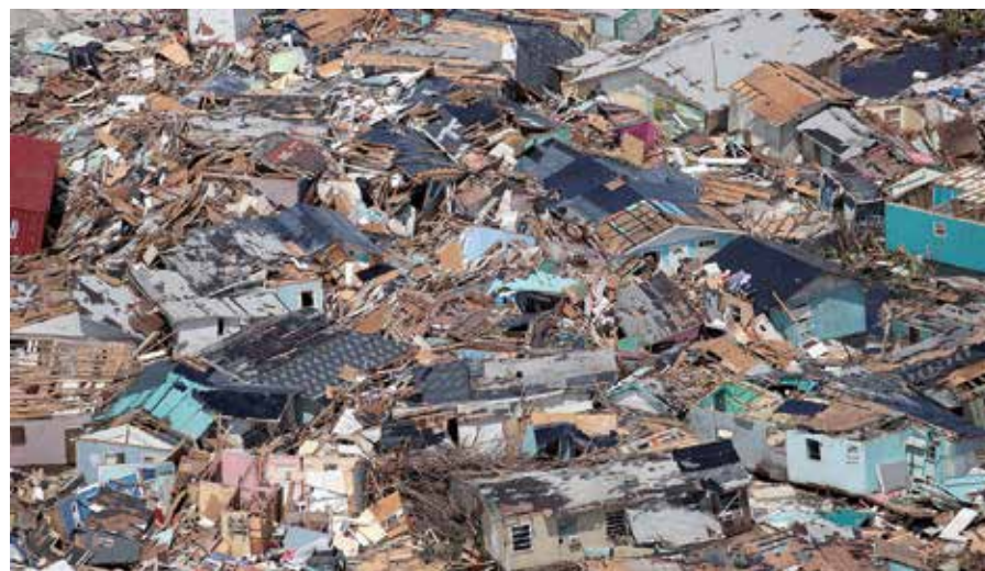
El impacto del fenómeno dejó decenas de muertos, más de 2 000 desaparecidos, inundaciones, derrame de petróleo y poblados enteros barridos.

En medio de ese panorama comenzó el curso escolar, que contó con la ayuda de un