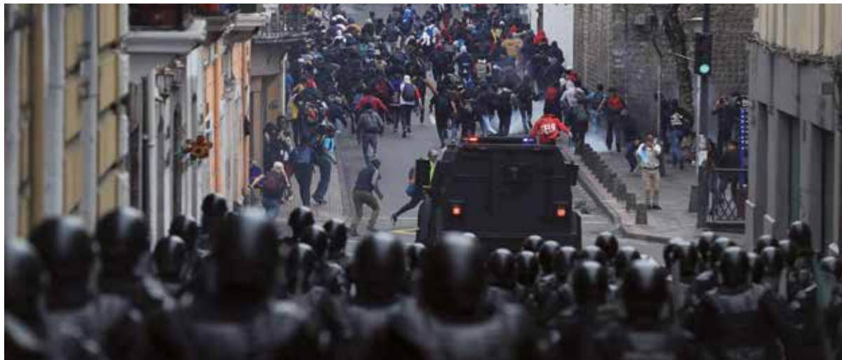
El decreto fue oficializado tras una jornada de paro transportista y de protestas populares contra reformas tributarias y laborales presentadas por el Gobierno.

Por Sinay Céspedes Moreno Corresponsal/Quito