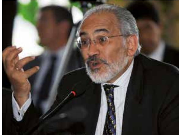
La incongruencia marca el discurso del candidato opositor Carlos Mesa rumbo a los comicios del 20 de octubre.

Elaborado por la encuestadora Viacencia, el estudio reflejó un crecimiento de la popularidad del candidato del gobernante Movimiento al Socialismo (MAS) en relación con agosto (39,1 por ciento).