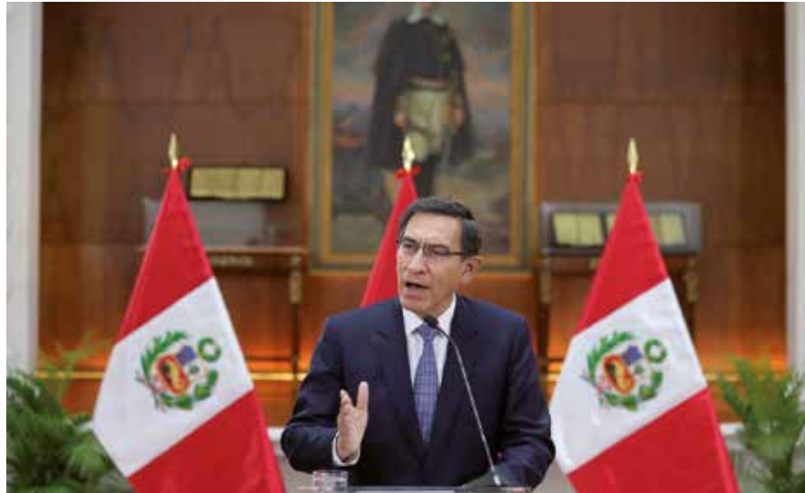
El presidente Martín Vizcarra decretó en días recientes la disolución del Congreso y llamó a elecciones parlamentarias.

Tanto en Acción Popular (AP) como en Alianza para el Progreso (APP), perdió solidez el bloque cuyo momento cumbre fue, el 26 de septiembre, con el envío al archivo del proyecto gubernamental de adelanto electoral, como salida a una prolongada crisis política. El legislador César Vásquez, quien representa a APP en la Comisión Permanente que sustituye al Congreso de la República con facultades muy limitadas, se opuso a los acuerdos de desacato del decreto presidencial que cesó a los parlamentarios.