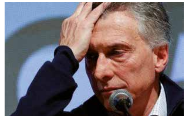
Datos de las encuestas y resultados de su gestión alejan al presidente Mauricio Macri de sus aspiraciones de reelegirse.

En busca de la reelección desde la alianza Juntos por el Cambio, la semana anterior el mandatario anunció su