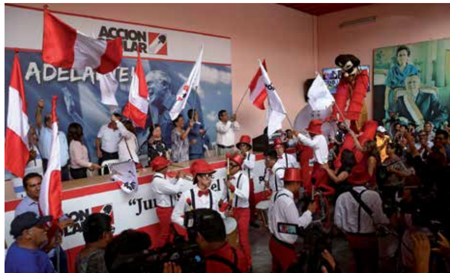
AP celebra el primer lugar que, increíblemente, obtuvo con solo el 10,1 por ciento de los votos válidos.

Dos fuerzas progresistas lograron curules, el Frente Amplio, con 6,1 por ciento de votos, y Juntos por el Perú, con 5,1, y a ambos les queda reflexionar sobre el hecho que sumados hubieran superado a AP, más aún si se unían también con Perú Libre, que con 3,9 por ciento quedó fuera del Parlamento.