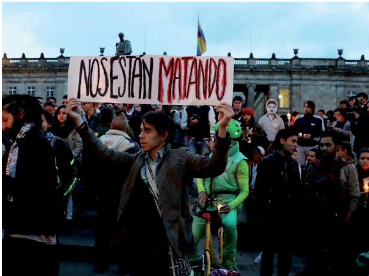
Amenazas, atentados, secuestros, asesinatos...conforman el día a día colombiano.

Por Masiel Fernández Bolaños Corresponsal/Bogotá