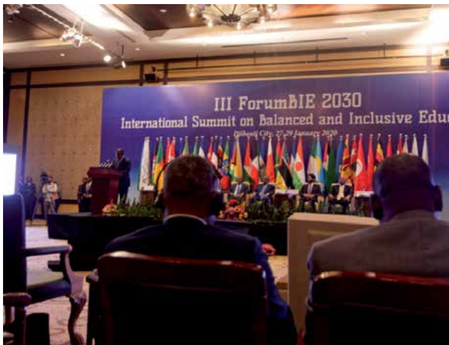
La firma de la Declaración en Djibouti, ratificó la aceptación de sus normas y principios, los cuales deberán adecuarse ahora a las condiciones específicas de cada nación.

Por su parte, la OCE surgió bajo los principios del multilateralismo, la solidaridad y la autodeterminación, con lo cual servirá para promocionar y facilitar la cooperación "entre iguales" y crear mecanismos de financiamiento educativo y solidaridad coordinados que cumplan con las prioridades nacionales.