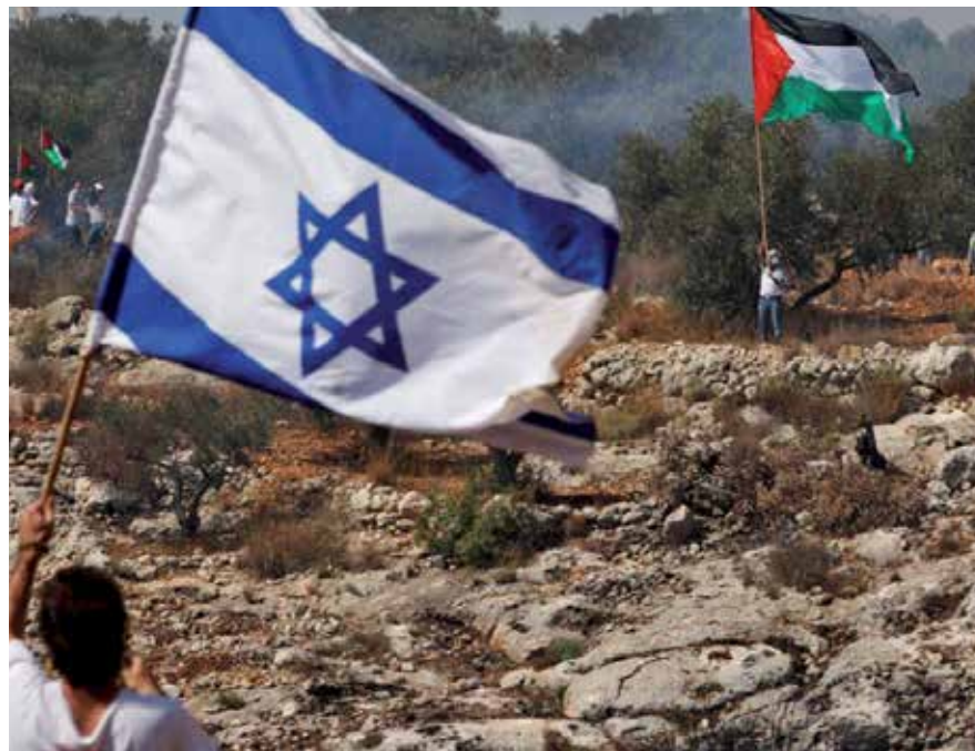
El "golpe del siglo", al decir del presidente palestino, Mahmoud Abbas, será devuelto en el futuro.

Por Adalys Pilar Mireles Corresponsal/El Cairo