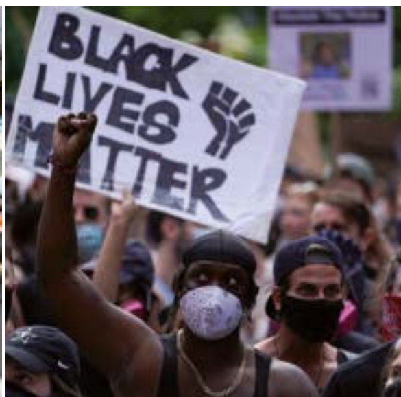
Las recientes encuestas reflejan la desaprobación a Trump, sobre todo, por su respuesta a la pandemia y su postura contra las protestas en demanda de justicia racial.