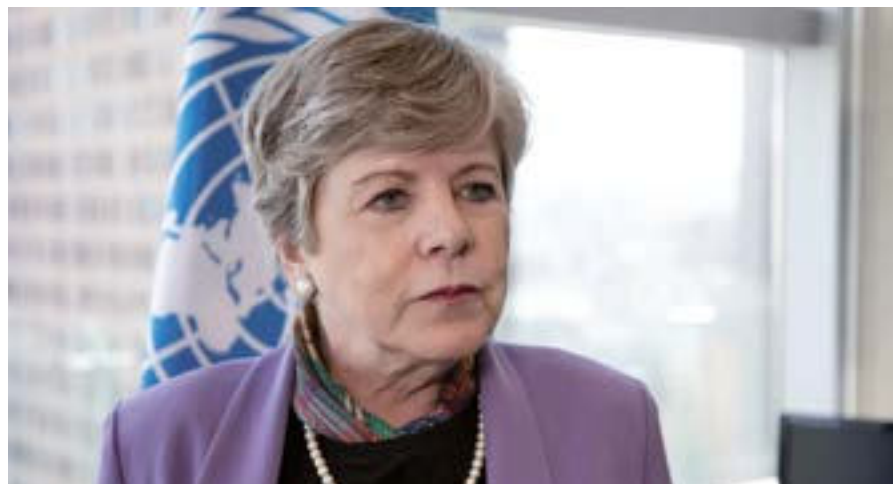
La pandemia ha mostrado que la intervención del Estado resulta crucial para la protección social y la inclusión, afirmó Bárcena.

La alta funcionaria de la ONU dijo, además, que se requiere una mayor integración regional, pues "el mundo postpandemia será de regiones y bloques. Por eso debemos movernos juntos en nuestra región", finalizó.