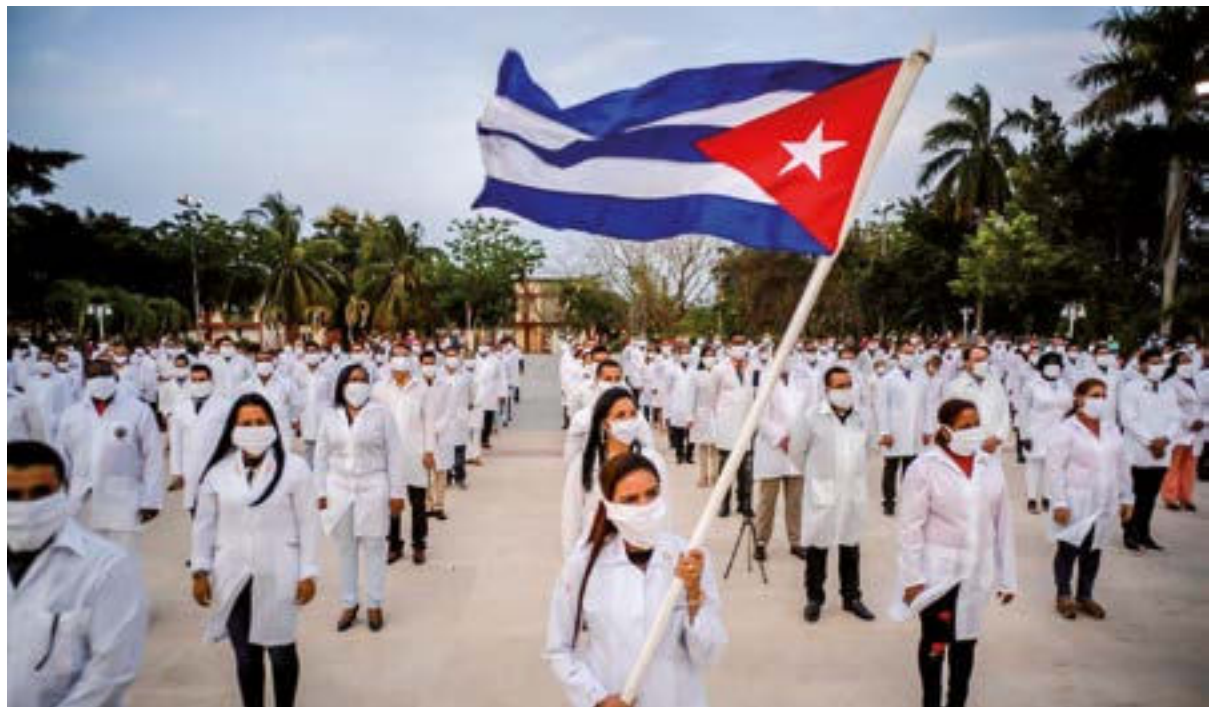
Son ya 45 las brigadas del Contingente Henry Reeve, con 3 772 integrantes, las que han partido a 38 países y territorios para brindar ayuda ante la pandemia de la Covid-19.

Recién el Concierto por Cuba , unió —on line— a un centenar de artistas de Estados Unidos, Canadá, Europa, África y de la isla