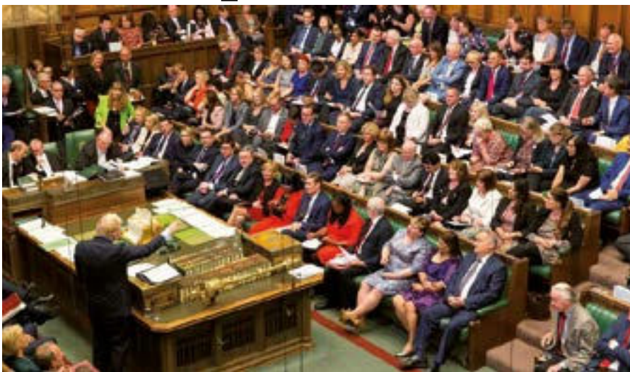
Moscú calificó de rusofobia el informe del Comité del Parlamento británico.