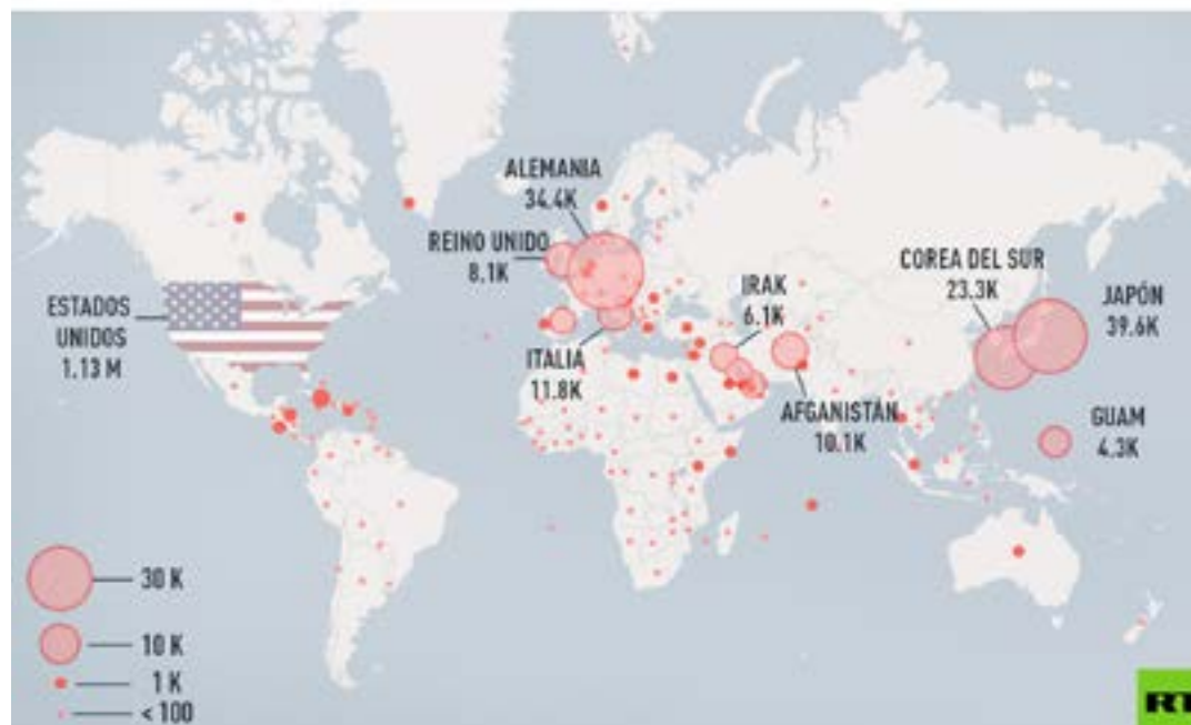
LUGARES DEL MUNDO CON PRESENCIA DE PERSONAL ACTIVO MILITAR DE EE.UU.

extensión y condiciones que determinen los acuerdos internacionales y la legislación nacional.