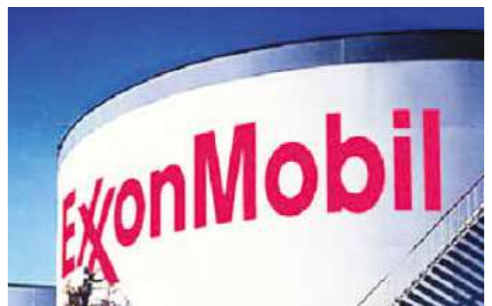
Exxon Mobil ha emprendido una campaña contra Venezuela.

"Nuestra política internacional, la diplomacia que ha hecho Venezuela, le ha permitido formar parte del conjunto de naciones de ser reconocidas como una voz comprometida con la defensa de los pueblos, pero dialogante, como ha demostrado ser, un país capaz en el marco del derecho, de defensa de la justicia", concluyó •