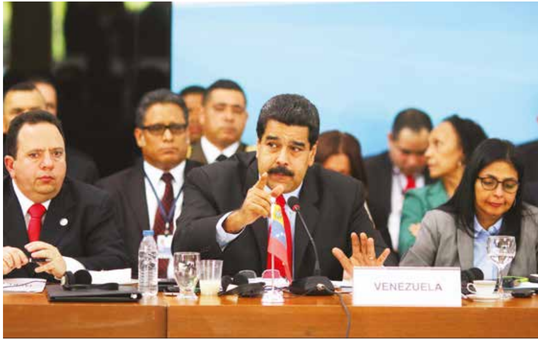
El presidente convocó a una reunión de Unasur para explicar el tema de la Guayana Esequiba.

Países ratificaron la necesidad de solución pacífica del diferendo