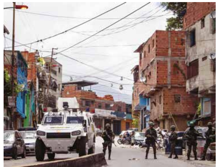
La OLP debe darse también en el plano político.

El trabajo es arduo. La OLP debe darse también en el plano político. Se debe emprender una gran cruzada comunicacional e ideológica, y transformar al pueblo en un enorme contingente liberador. •