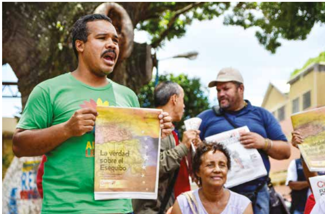
Fuerza revolucionaria desplegados 'porque el Esequibo nos pertenece'.

Desde el PSUV exhortamos a la población, indistintamente de su ideología política, a unirse a este debate para profundizar el respeto a la soberanía y la lucha por lo que nos pertenece. •