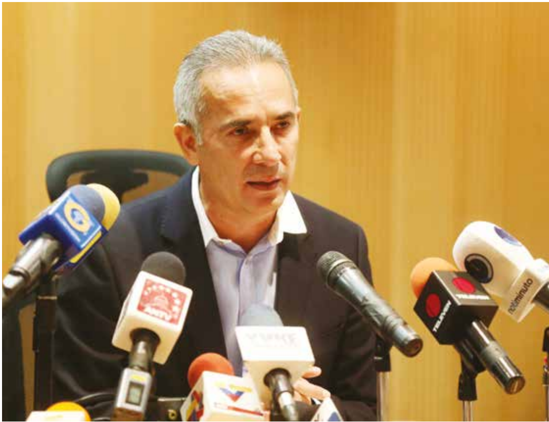
Se ha establecido una alianza de bandas que están ejerciendo control territorial.

bodega, hasta los comercios ubicados en grandes centros comerciales o, incluso, a los empresarios importantes de la zona. Si bien, los bodegueros por sí solos no le generan ingresos significativos (5000 o 10000 bolívares al mes), la cantidad de dueños de bodegas extorsionados (hasta 100) hace que las ganancias sean inestimables.