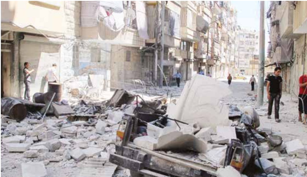
La situación actual en Venezuela, se parece mucho al escenario de la Siria prebélica