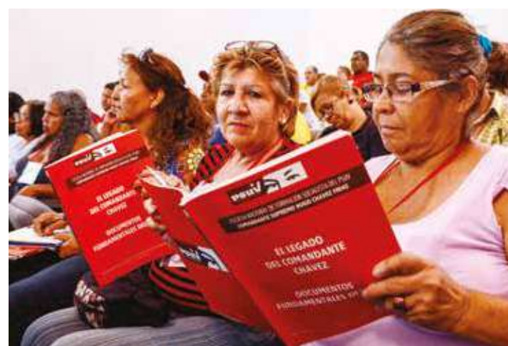
Candidatos de la Patria se alistan para la victoria del 6 de diciembre.

de la Patria vamos a instalar 87 mesas de gobierno de calle permanente en los 87 circuitos electorales, para hacer más fácil la orientación del pueblo, se ha propuesto y ya lo hemos aprobado, mesas que estarán articuladas con la sala situacional, el alto mando político” afirmó Maduro. •