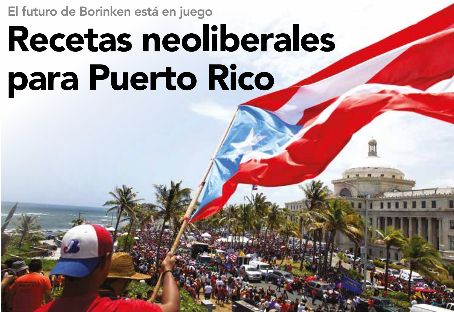
Wall Street se ha beneficiado de la miseria de Puerto Rico.