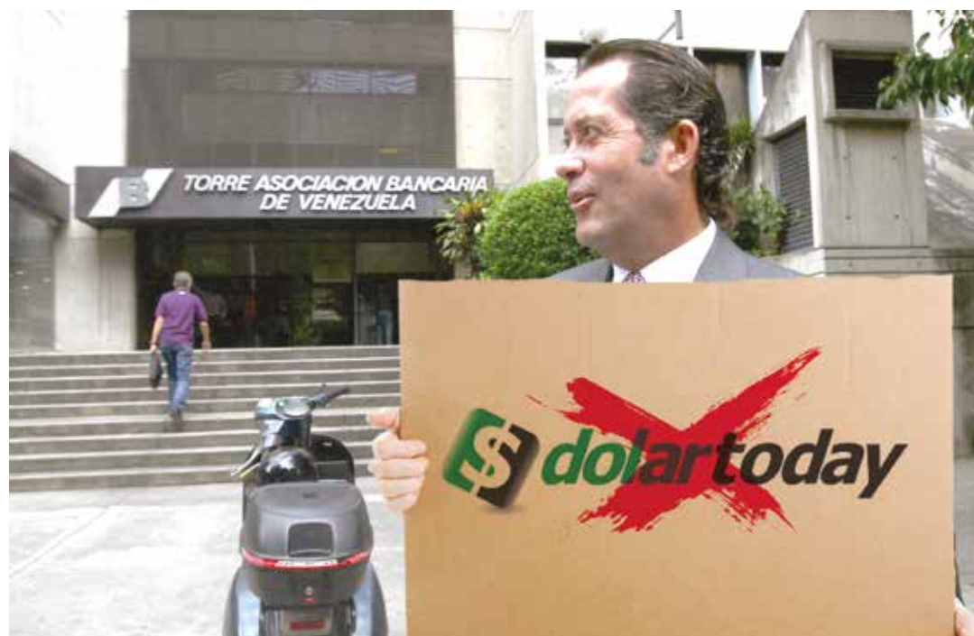
DolarToday recibe cada vez más ataques entre sectores concretos de la burguesía venezolana.

La Asociación Bancaria llama a desconocer DolarToday sin nombrarla