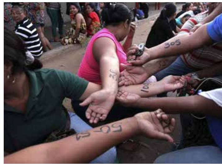
Tratan de destruir lo construido en Revolución.

Debemos impulsar y aprobar todas las medidas para frenar el acaparamiento, la usura, el contrabando de extracción, sea que este último se cometa por los caminos verdes o por los lugares de distribución en las ciudades y pueblos. Tenemos que buscar el rumbo, ver en qué nos hemos equivocado y rectificar para lograr los objetivos trazados. ¡Seamos aún más celosos con el legado de nuestro Comandante Chávez! ¡Avancemos con el apoyo del pueblo organizado, que está en movimiento de acuerdo con las enseñanzas de Chávez! •