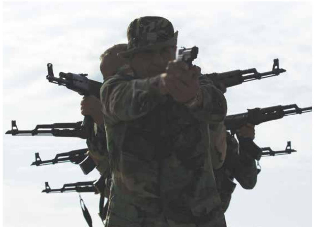
El objetivo del imperio es crear un Estado dentro del Estado.

La infiltración paramilitar con fines contrarrevolucionarios avanzó hasta cierto punto en el territorio vene-