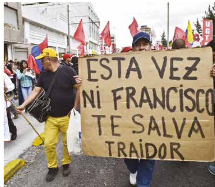
Es la misma metodología golpista la que aplican en Ecuador.

Estamos ante una misma metodología, es parte de la ideología del capitalismo neoliberal que busca imponer sus condiciones a los gobiernos progresistas de América Latina"