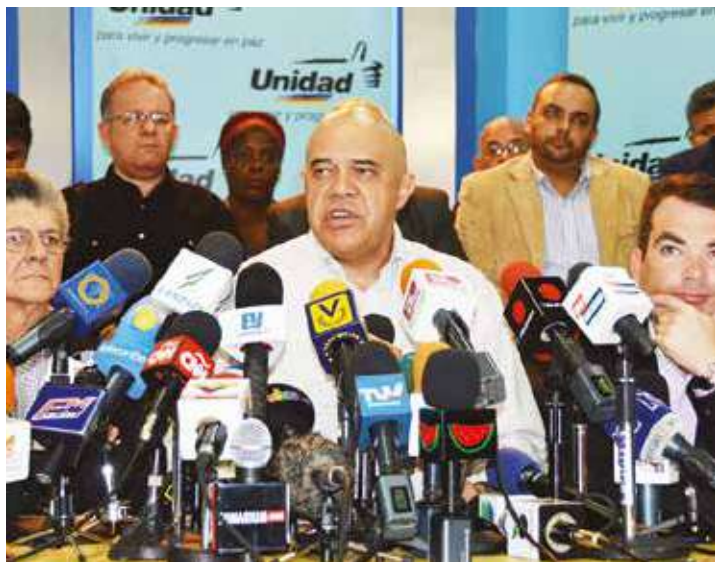
La derecha se prepara para cantar fraude.