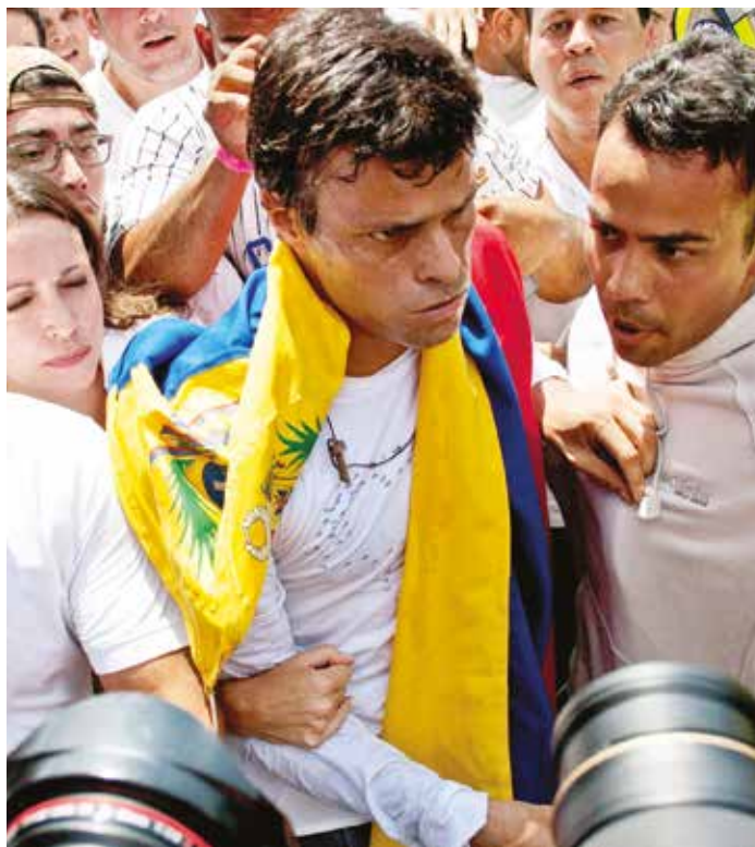
La derecha ha importado el paramilitarismo de Colombia.