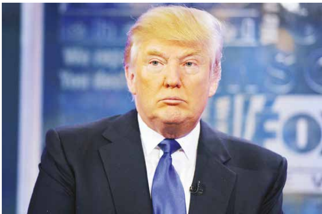
Con un discurso contra los latinos ha captado votantes conservadores.

“ Durante un anuncio en su campaña, Trump usó las palabras “violadores”, “asesinos” y “matones” para referirse a los inmigrantes latinos y se comprometió a construir un muro entre EE.UU y México”