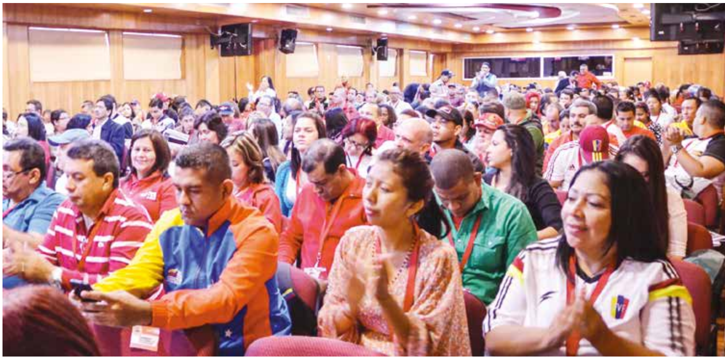
Diputados deben ser capaces de poner de lado cualquier interés individual, vanidad y narcisismo.

Parlamentarios desarrollarán una campaña que incorpore en la agenda legislativa un importante contenido de poder popular