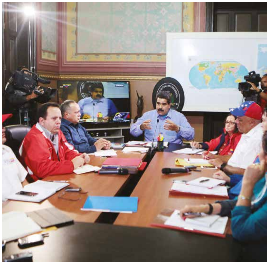
El Primer Mandatario señaló que se extiende por tiempo indefinido el cierre fronterizo.

El presidente Maduro exhortó a todos los colombianos residentes en Venezuela "a defender el derecho a la paz de la Patria venezolana"