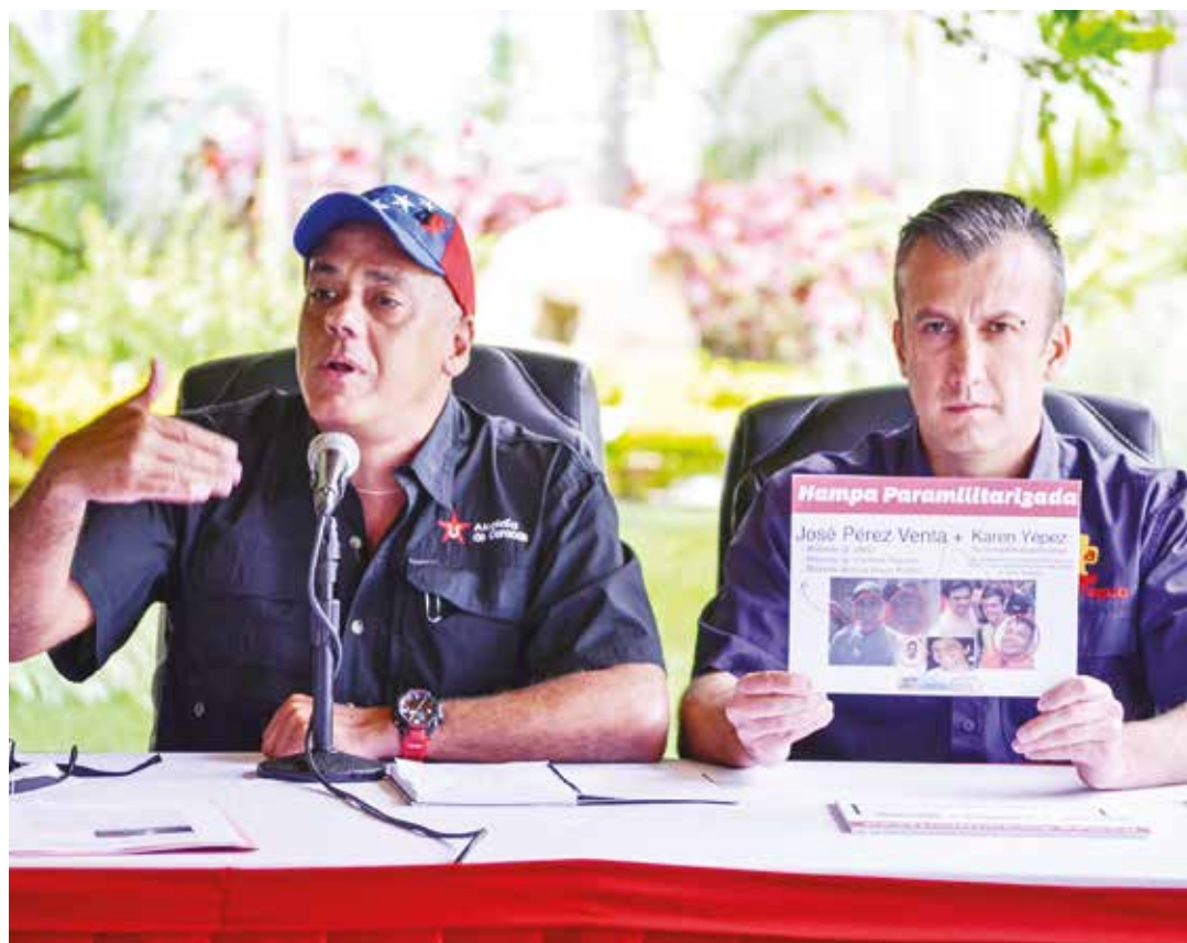
Crimen de Hergueta guarda relación con las guarimbas de 2014.

Asesinos de Hergueta confesaron nexos con dirigentes de la oposición