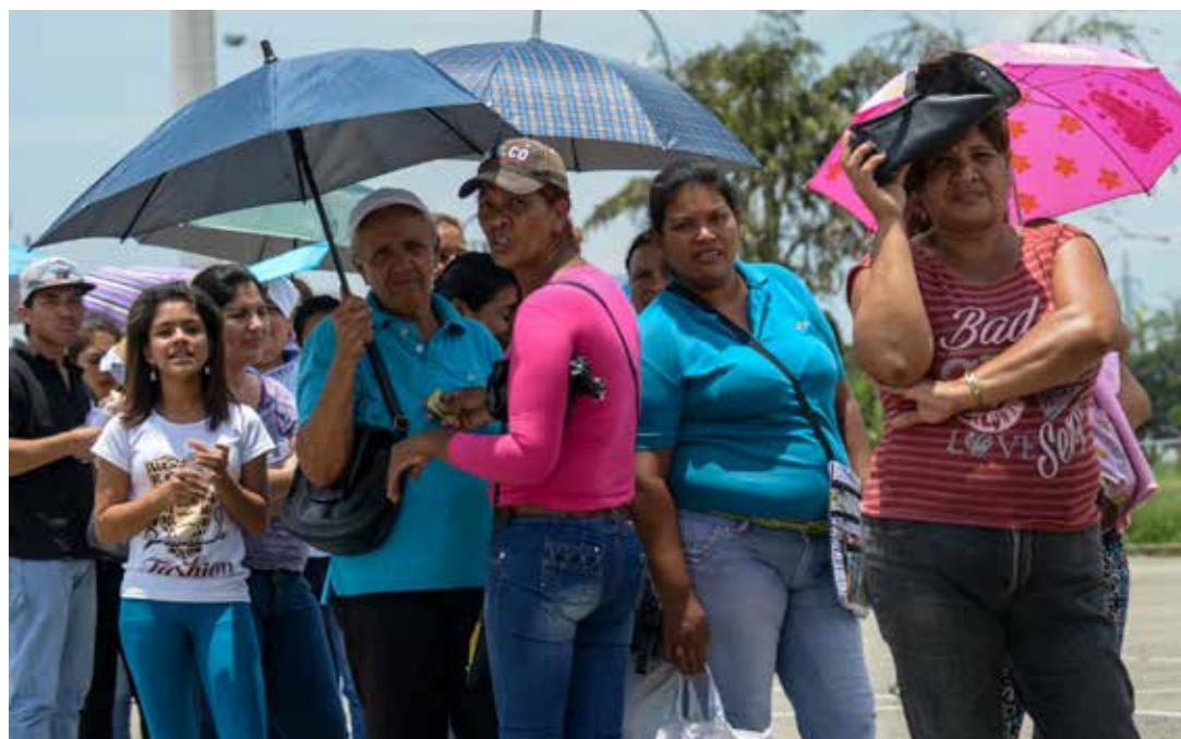
Enemigos de la Patria han inducido el síndrome de las colas.

Es fácil entender el efecto negativo que produce esta obsesión de comprar todo lo que aparezca en los supermercados, se necesite o no