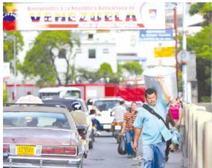
Toneladas de alimentos básicos eran contrabandeados a Colombia

Durante los días jueves 20 y viernes 21 de agosto, los servicios de transporte