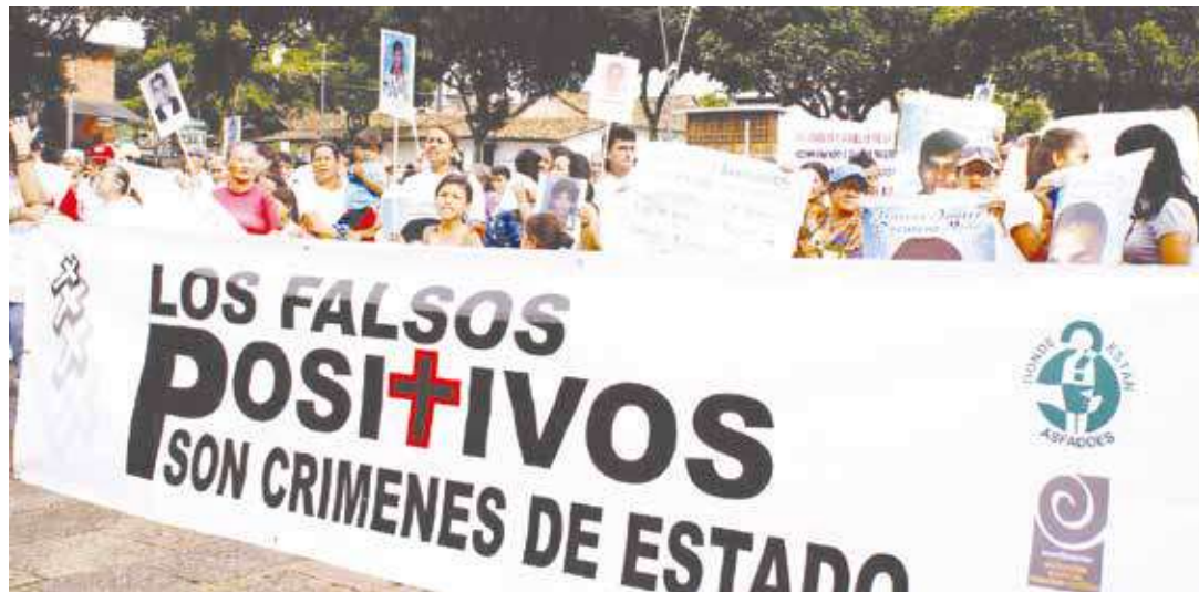
La huella de los "falsos positivos" sigue a Uribe como una mancha oscura.

El autor de los "falsos positivos" compara las deportaciones con el Holocausto