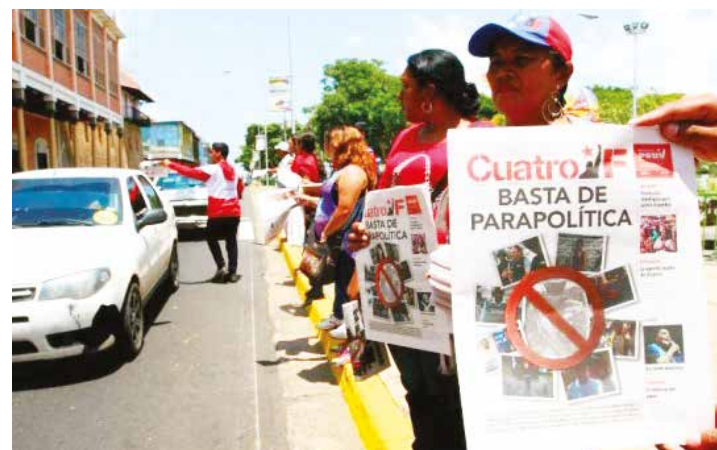
Las brigadas de APC se activaron en todo el territorio.

“ Desde esquinas calientes instaladas en las plazas Bolívar de todo el país, la militancia psuvista expresó su respaldo a las medidas tomadas por el presidente Maduro”