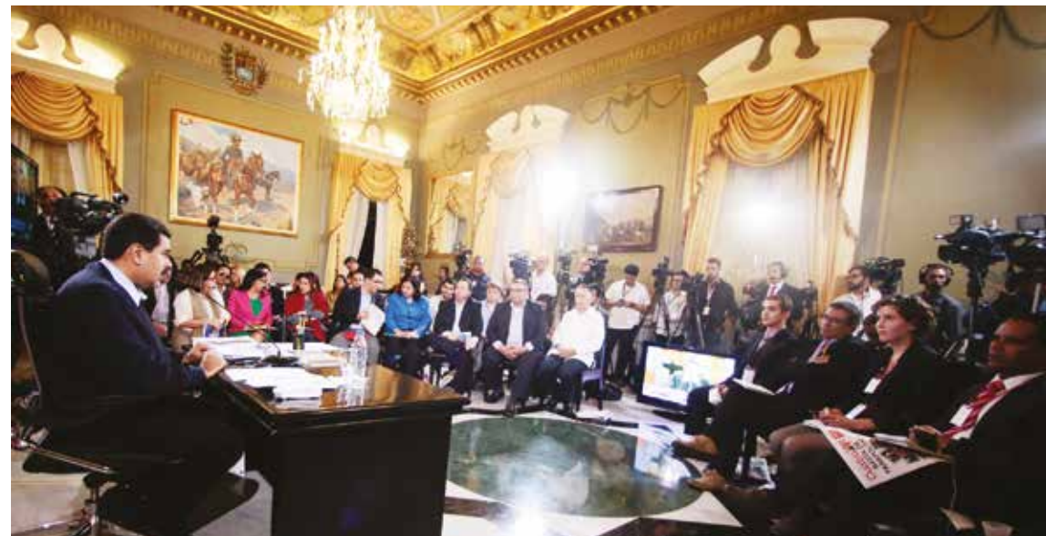
El Primer Mandatario exigió el cese de la conspiración desde Colombia FOTO PRENSA PRESIDENCIAL.

Cómo dejarle esta Patria a quienes han sido capaces de favorecer una atroz guerra económica contra el pueblo, que se alían con paramilitares, ahí es cuando uno respira, toma fuerza y sigue hacia delante”