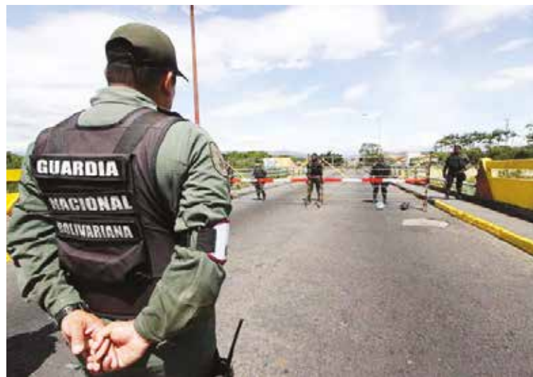
Siempre será bienvenido todo apoyo de Unasur.

El presidente Maduro resaltó que en Venezuela nadie conspira contra el presidente Santos ni contra la nación neogranadina, pero desde ese país hacia Venezuela sí, por estas razones, en Venezuela se han tomado medidas para defender su soberanía y mantener la paz. “Son dos modelos que pueden coexistir, pero