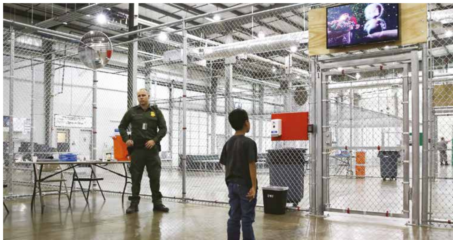
El centro de reclusión está principalmente poblado por mujeres y niños.

Y en lo inmediato debe buscarse la puesta en libertad de las mujeres y de los menores recluidos en los centros de detención pues, como señaló la legisladora Lofgren, no han cometido delito alguno y su situación es un agravio a la conciencia del mundo. •