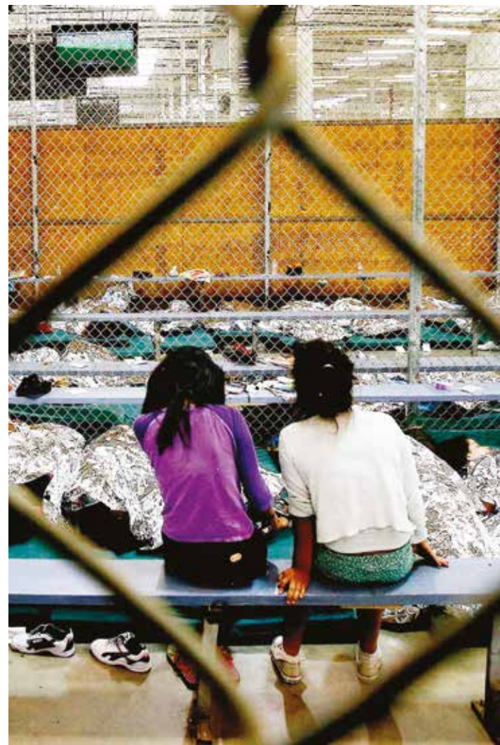
Se trata de situaciones violatorias de los derechos humanos.

Todo parece indicar que, al aproximarse los comicios presidenciales previstos para el año entrante, se desvanecerán las posibilidades de una reforma migratoria y, como ha sido la norma en ocasiones anteriores, la mayoría de los políticos buscarán atizar la xenofobia de importantes sectores de la