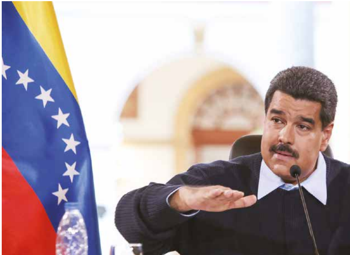
Venezuela es víctima de la derecha paramilitar colombiana.

Expuso que se requiere de un gran esfuerzo para edificar esta frontera de paz y respeto, que sustituya el viejo modelo heredado del capitalismo. Y destacó la necesidad de desarticular los grupos paramilitares asentados en los municipios Bolívar, Junín, Pedro María Ureña, Capacho Viejo y Nuevo, y Rafael