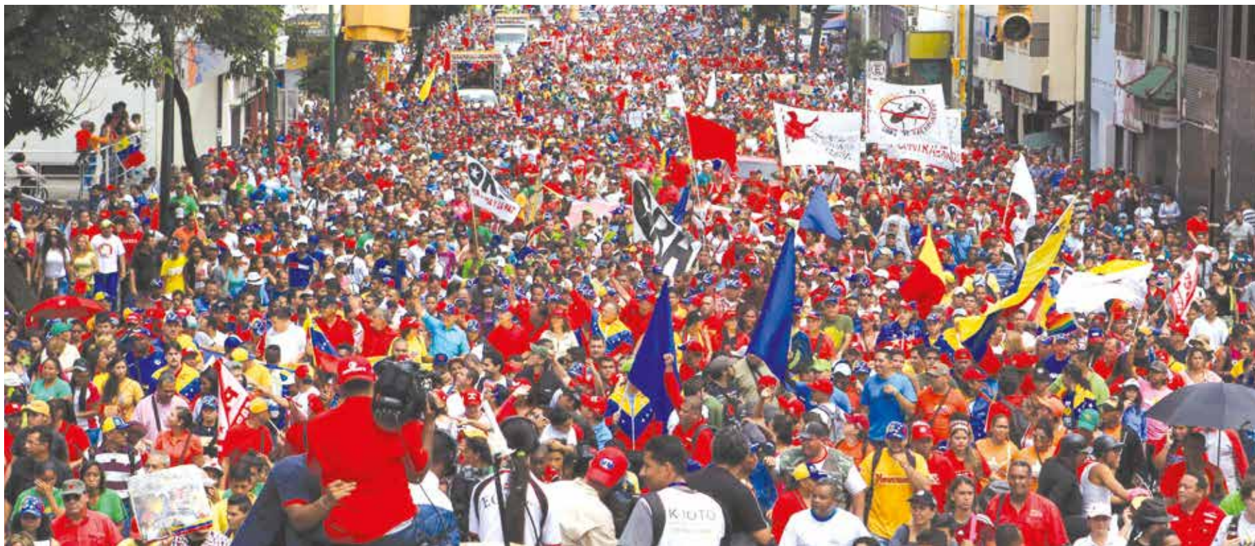
El Primer Mandatario anunció la creación de una nueva zona especial.

El Presidente aseguró estar dispuesto a reunirse "cara a cara" con el presidente de Colombia, Juan Manuel Santos, para tratar las posibles soluciones a la crítica situación que viven los venezolanos asentados en la zona fronteriza