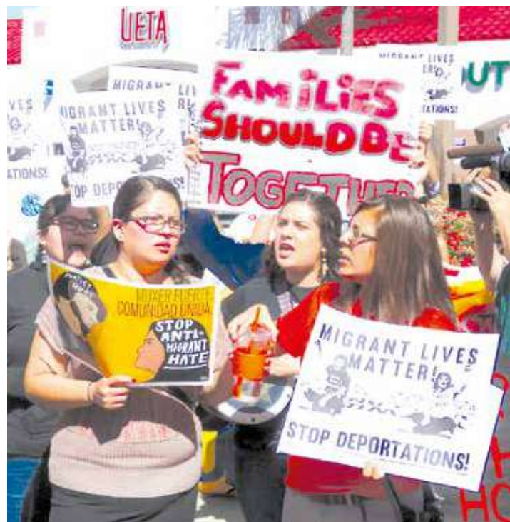
Obama deportó al mismo número de extranjeros que Bush en ocho años. •

gobierno, Obama deportó al mismo número de extranjeros que la administración de George W. Bush en ocho años y se calcula que el número de personas que han salido de territorio norteamericano durante el mandato de Obama es aproximadamente la misma cifra que salió entre 1892 y 1997, es decir más de cien años. •