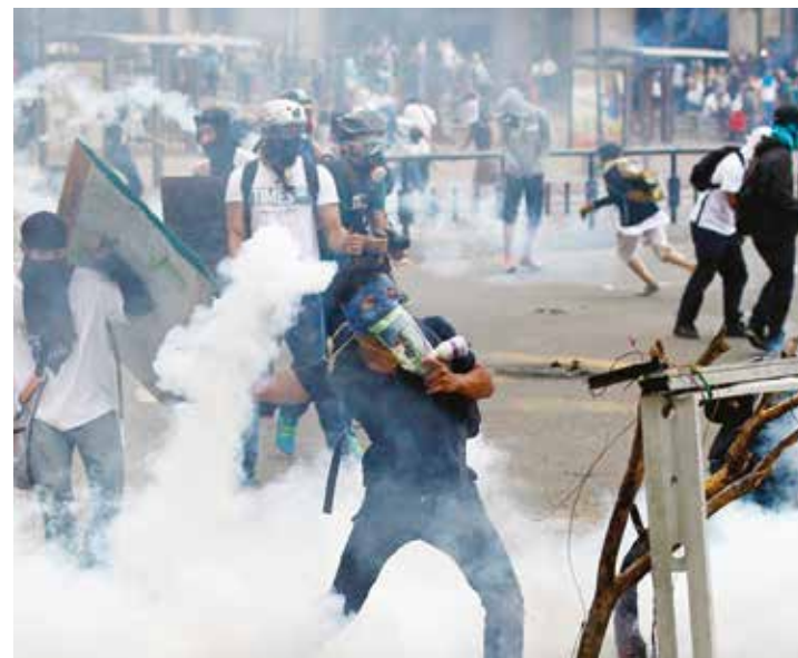
Muchos de los guarimberos recibieron entrenamiento paramilitar.

Es en la frontera donde se desarrolla la avanzada principal de estos grupos paramilitares, una suerte de retaguardia estratégica que desde hace años vienen denunciando las organizaciones populares con presencia en zonas rurales y urbanas de Apure, Táchira y Zulia"