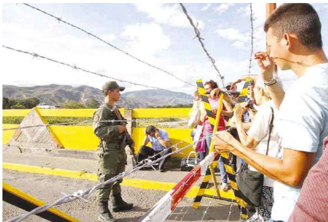
Muchos colombianos entraron sin pasaporte, lo que dificultó su retorno.

En Táchira cesaron las colas de mercaderes de combustible, mientras que en Cúcuta el suministro de combustible sencillamente colapsó