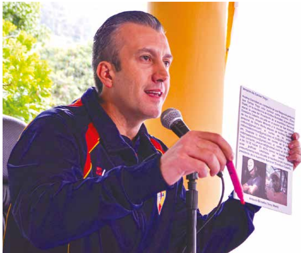
Estas expresiones violentas son brazos del imperialismo.