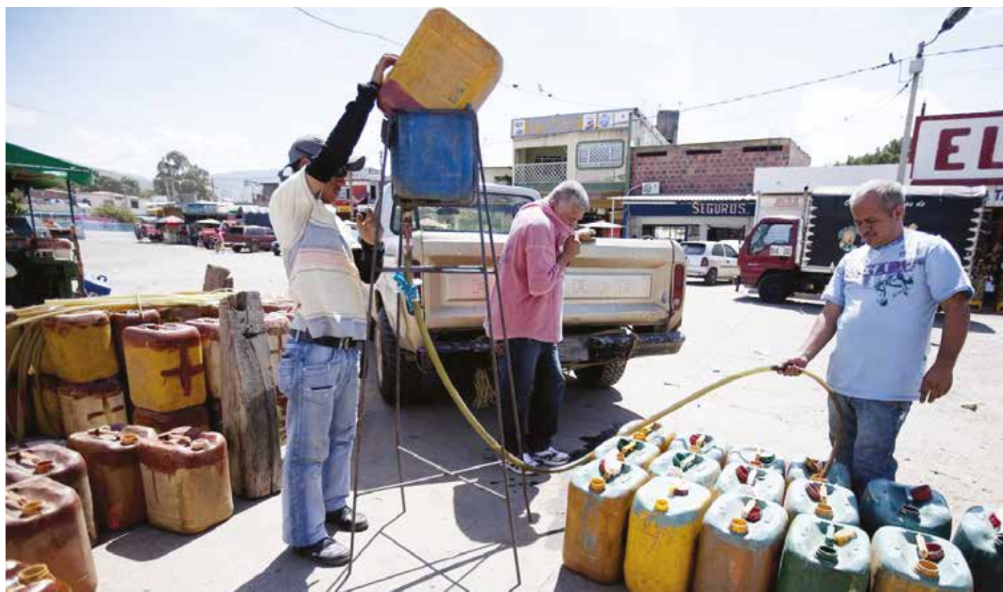
90% de la gasolina que se consumía en Cúcuta provenía del contrabando desde Venezuela.

Estas medidas, sugieren, deben acompañarse con otras de carácter puntual en líneas de transporte y distribución de productos, en lo que sería una estrategia de acción combinada de respuesta a los gendarmes de la guerra económica contra el pueblo. •