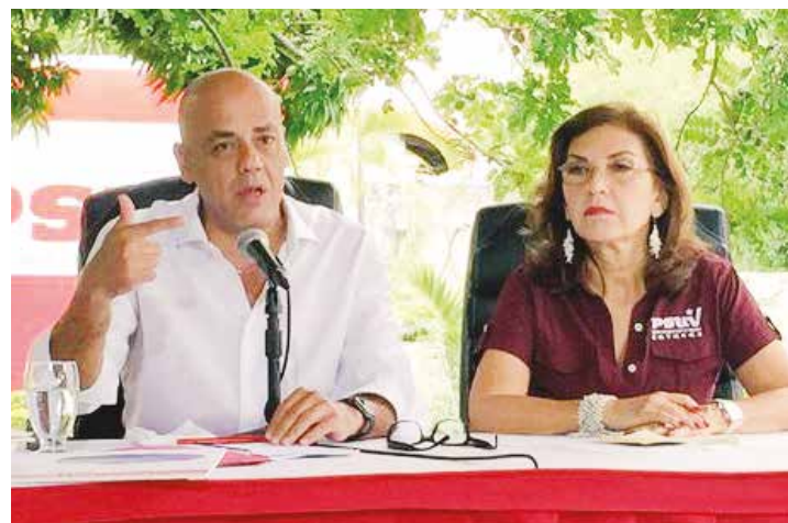
Opositores salen como loros a repetir todo lo que dice Uribe.

PSUV ratificó apoyo irrestricto al Presidente Maduro ante las posiciones firmes del Gobierno Bolivariano en defensa del pueblo venezolano