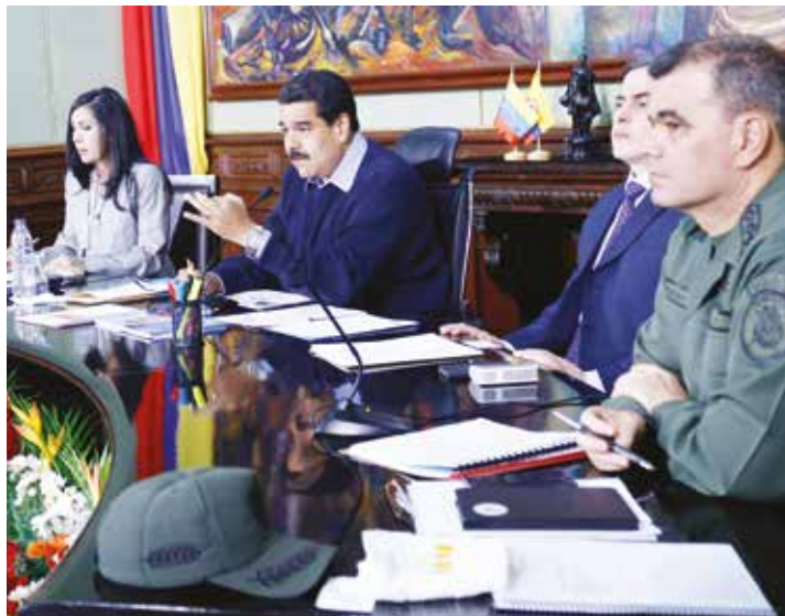
Se presentará una nueva Ley de Frontera.

“Lo primero es la paz, la estabilidad, la recuperación de la soberanía. Lo segundo es la recuperación de la economía fronteriza, hay que estabilizar los precios en los municipios de la Zona 1 y el que no quiera cumplir con la Ley de Precios Justos debe ajustarse al marco legal con las medidas necesarias. Una nueva policía tiene que ir naciendo al calor de estos hechos, con una inteligencia poderosa”, dijo el Primer Mandatario al hacer un balance de los acuerdos alcanzados en las mesas de trabajo establecidas en los estados Táchira y Zulia, en donde los gobernadores José Vielma Mora y Francisco Arias Cárdenas se reunieron con las fuerzas vivas de la región para encontrar soluciones a los múltiples problemas que a través de los años se han sembrado en la frontera.