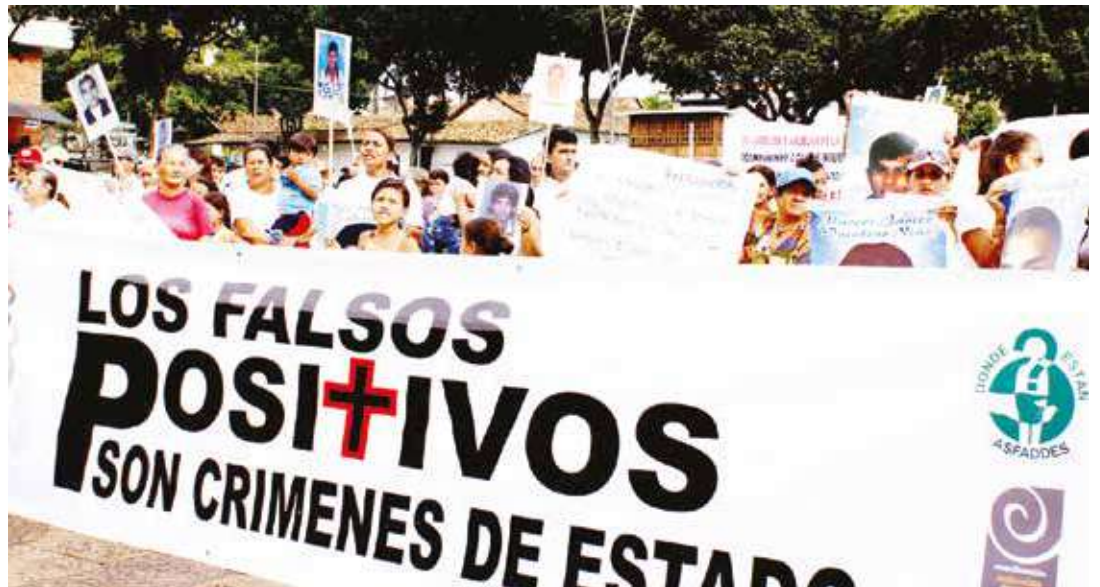
Existe un plan de montaje de un "falso positivo" contra el gobierno venezolano.

mismos ciudadanos colombianos que volvían a su país.