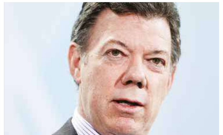
El presidente Santos es parte de la oligarquía.

Con qué moral Santos rechaza la medicación de UNASUR, no le alcanzó su derrota en la OEA, pese al apoyo del Secretario General, Luis Almagro, que de manera parcial visitó a la ciudad de Cúcuta, apoyando una sola versión del conflicto. Es por eso que hoy los gobierno latinoamericanos y caribeños, han creado sus propios instrumentos