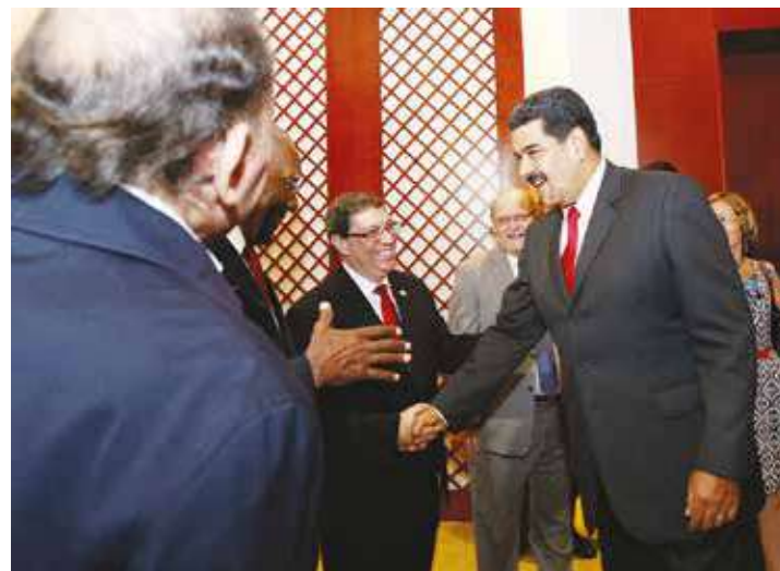
Petrocaribe es garantía de paz.

Antes de la creación del acuerdo, los países del Caribe estaban sometidos a un mercado donde todas las empresas transnacionales incrementaban los precios de manera irracional"