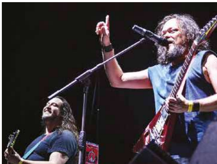
La música ayudará a acercar a los pueblos.

Más de 6 mil bandas que conforman el Frente Nacional de Bandas Rebeldes, están en disposición de movilizarse a Táchira para dictar conferencias con un llamado a la paz"