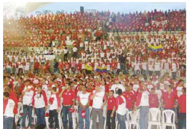
Foros en el 7mo aniversario de la JPsv.

La imagen va acompañada de la tipografía con el nombre de esta organización política. Esta será el logotema que regirá a esta organización política juvenil durante el próximo año y que seguirá evolucionando sin perder su esencia juvenil y rebelde. •