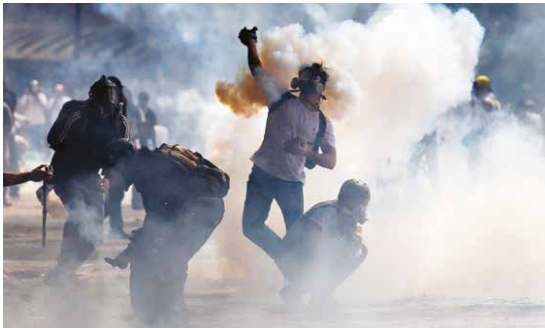
El ataque contrainsurgente se produce con viejas y renovadas tácticas.

Lo que es urgente es que América Latina y el Caribe implementen las medidas necesarias y respondan a la "simultaneidad" operativa de los poderes imperiales, con la solidaridad simultánea de los pueblos nuestroamericanos. "Sí se puede". •