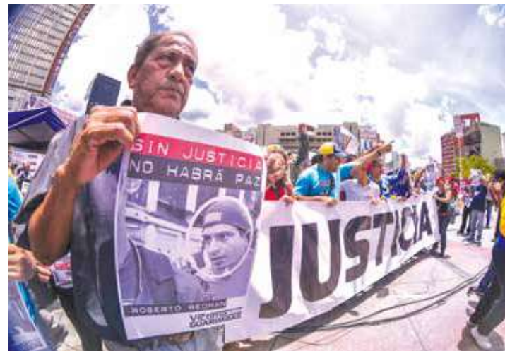
Sin justicia no habrá paz.

"Pedimos que no se repitan estos hechos de violencia, queremos paz y para que exista, debe haber justicia (...) agradecemos toda la solida-