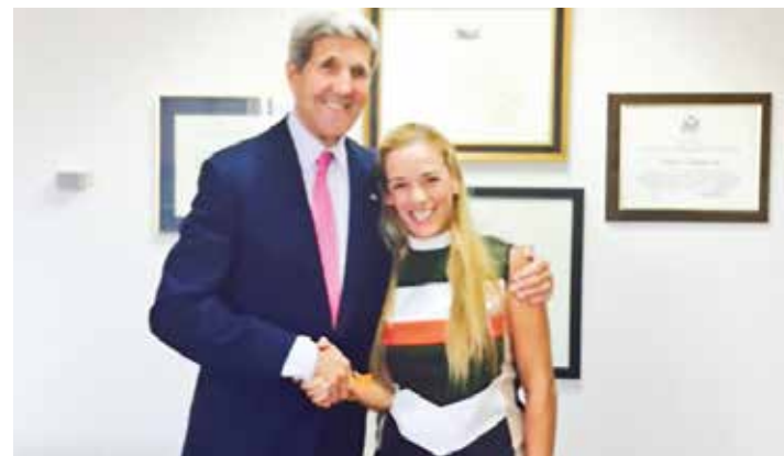
No es casual la reunión entre Kerry y Tintori

Al plan de Washington de convertir al terrorista Leopoldo López en bandera del plebiscito y la cruzada antiMaduro, se suma la intención de la oligarquía colombiana de abrir un expediente en contra del presi-