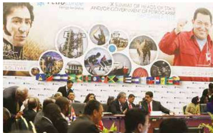
Se creó el Consejo de Economía de Petrocaribe

cuenta con las reservas certificadas de petróleo más altas del planeta, las cuales en su mayor parte se encuentran en la Faja Petrolífera del Orinoco Hugo Chávez. Este acuerdo prevé el financiamiento en condiciones favorables de la factura petrolera, cuyo 50% es pagado en 90 días y el resto en un plazo de hasta 25 años, con dos de gracia y un interés del 1%. •