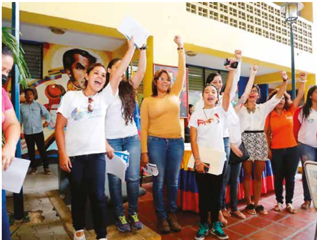
Fundada en el año 2008, esta organización ha tenido un rol protagónica en defensa de la Patria. .

La organización política juvenil se ha convertido en un horno forjador de cuadros políticos preparados para dar la batalla en cualquier trinchera