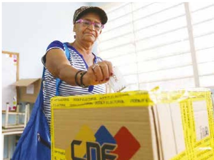
Buscan crear un plebiscito.

La labor de las candidatas y candidatos de la Revolución, es ir por la conciencia del pueblo, Constitución y Plan de la Patria en mano, a reforzar que debemos obtener una victoria perfecta, en alianza perfecta con el Gran Polo Patriótico, para consolidar el andamiaje legislativo que necesitamos a fin de continuar por la vía democrática y pacífica colocando las bases del nuevo Estado que nos dará la mayor suma de felicidad posible, como lo dijo el padre Libertador Simón Bolívar, en las ideas que Chávez rescató para diseñar nuestro proyecto socialista.●