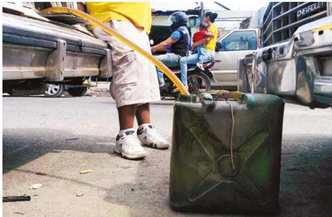
En Colombia la alianza entre políticos locales y paracos ha estimulado el contrabando.

El Siglo XXI nos trajo nuevas propuestas de desarrollo en nuestro Continente, se crearon organizaciones multilaterales económicas Mercosur, la ALBA, Petrocaribe, de seguridad UNASUR y la CELAC de integración y acuerdos políticos, una nueva realidad en nuestra región. Pero también los desafíos de una potencia Hegemónica, como es EEUU y sus presidentes, como la Industria Militar de esta nación, sus bases militares, la OEA como mecanismo de coerción e intervención. Ante esta realidad solo la unidad de nuestras naciones, podrán enfrentar a una recolonización, de un imperio que ha decidido controlar a la humanidad, a cualquier costo, incluso la destrucción del planeta. •