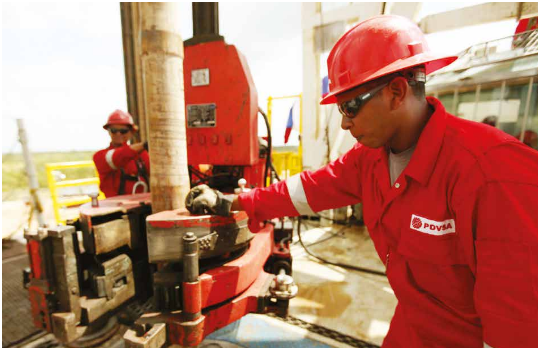
Venezuela posee el 20% de las reservas probadas de crudo del planeta.