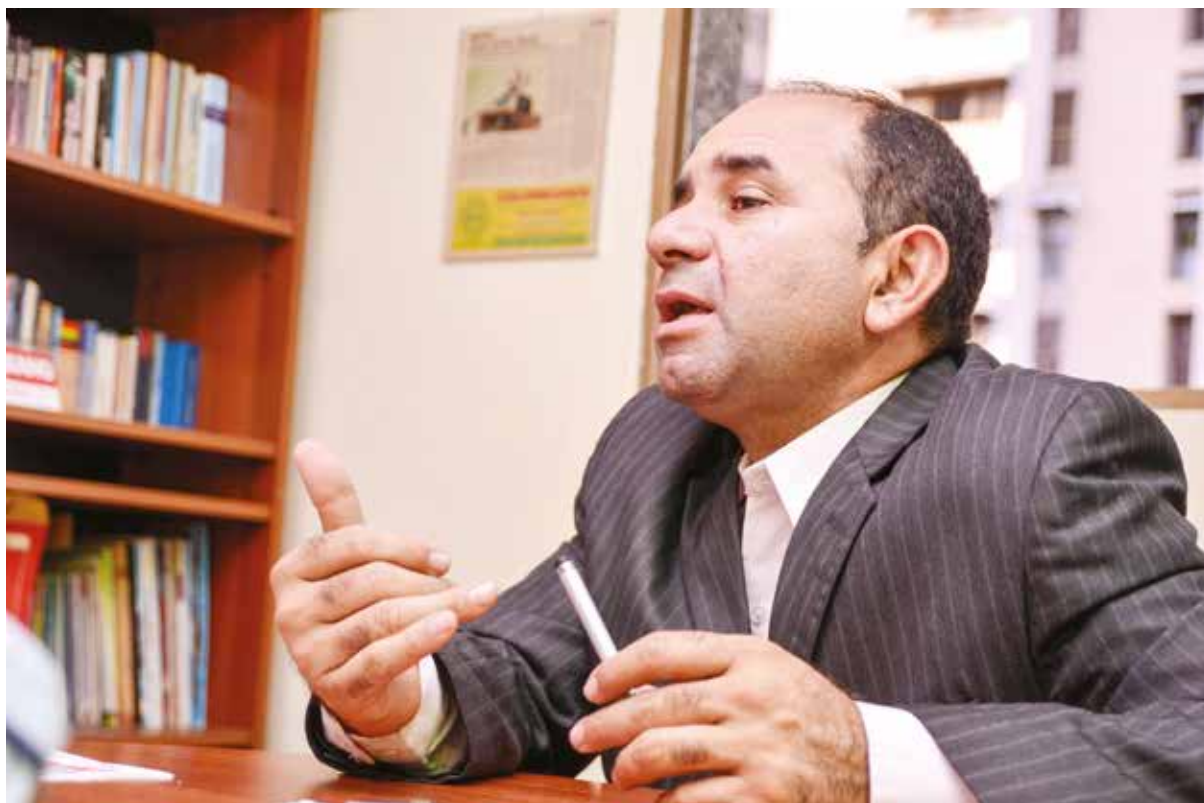
El colchón del paramilitarismo es el contrabando.

Reflexionó que el llamado del presidente Maduro obedece a una realidad, "creo muy oportuno la construcción de un gran Movimiento de Colombianos Bolivarianos, creo que es el momento, y aun-