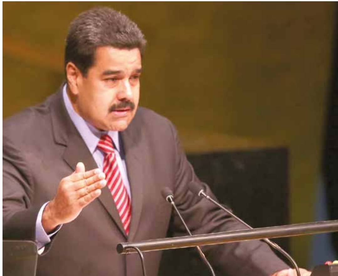
Nicolás Maduro en la ONU

“¿Por qué en esa región del mundo- se refirió a África, Asia y al Medio Oriente- se está viviendo una película de terror? Millones de hermanos musulmanes, árabes y del Medio Oriente, migran masivamente buscando un hilo de paz, una luz de esperanza. La causa específica, concreta que ha impactado a estos pueblos hermanos de Afganistán, Irak, Libia, Si-