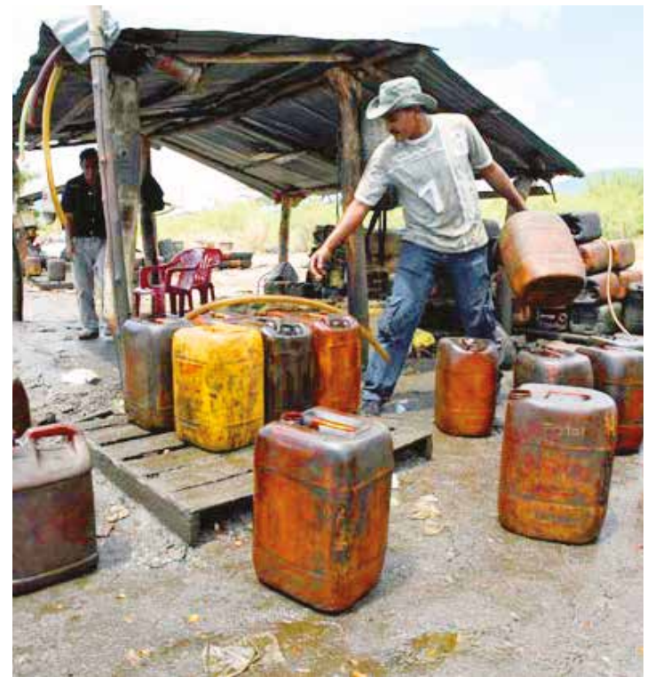
Ahora son enemigos del alcalde de Cúcuta

empleo digno, realizada por el ministro del Interior en su visita a Cúcuta al inicio del cierre fronterizo. En su intento por criminalizar a los sindicatos de vendedores de gasolina, el alcalde de la ciudad fronteriza aseguró que capturaron a un pimpinero utilizando un arma de fuego para impedir el abastecimiento en las estaciones de servicio. Mientras tanto, el diario colombiano La Opinión, indicaba que los problemas con combustible se extienden a la ciudad de Pamplona, debido a la escasa cantidad de gasolina asignada por el Ministerio de Minas en varios departamentos fronterizos con Venezuela a pesar de las reiteradas promesas del gobierno de Bogotá de enviar cupos adicionales de combustible. •