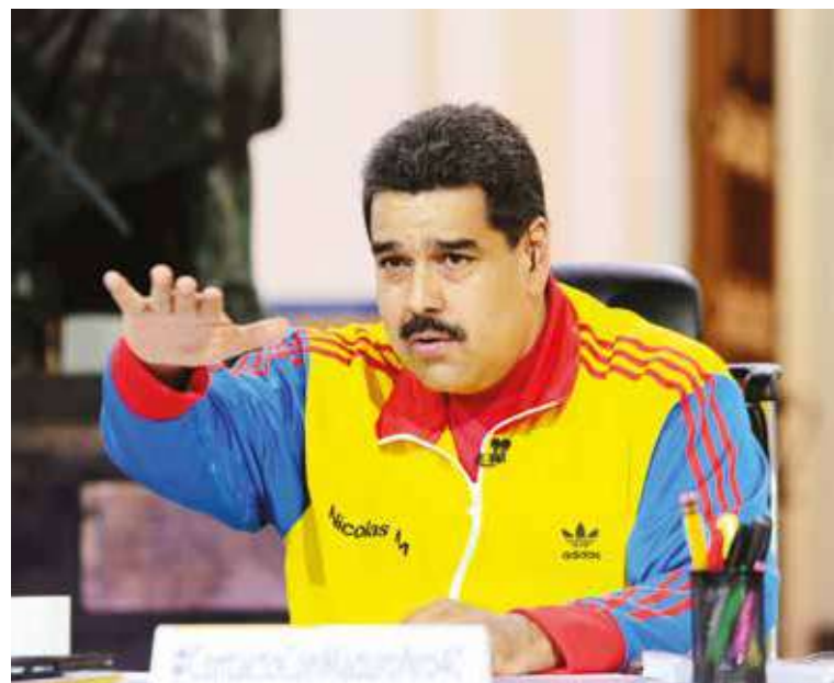
El Presidente ha propuesto un plan de seis meses para la normalización

“La ultraderecha de allá y de acá aspiraba a que nos declaráramos la guerra. Pero no nos dirigen los extremismos locos, porque lo que está planteado es la coexistencia de dos modelos. Somos diversos, pero somos hermanos”.