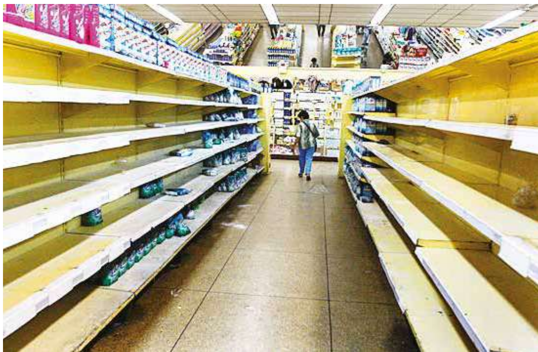
El desabastecimiento es parte de la guerra económica

El analista considera adecuadas las últimas decisiones del Ejecutivo en torno a la frontera, pues según su perspectiva, se estaba desdibujando la presencia del Estado venezolano en la línea limítrofe con Colombia y ninguna nación puede permitirse la pérdida de soberanía política y económica en su territorio. Los cálculos de las pérdidas que representaba para el Estado nacional el contrabando de gasolina y bienes básicos, además de la presencia de elementos de carácter paramilitar que controlaban estas actividades, justificarían una acción como la tomada por el Estado en cualquier parte del mundo. •