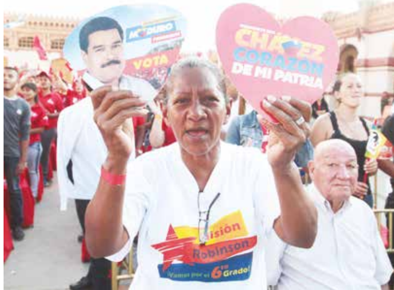
Luchemos por las misiones.

El Comando Sur plantea un escenario "supraelectoral", más allá de las elecciones, de la participación y de sus resultados. Para el imperialismo,