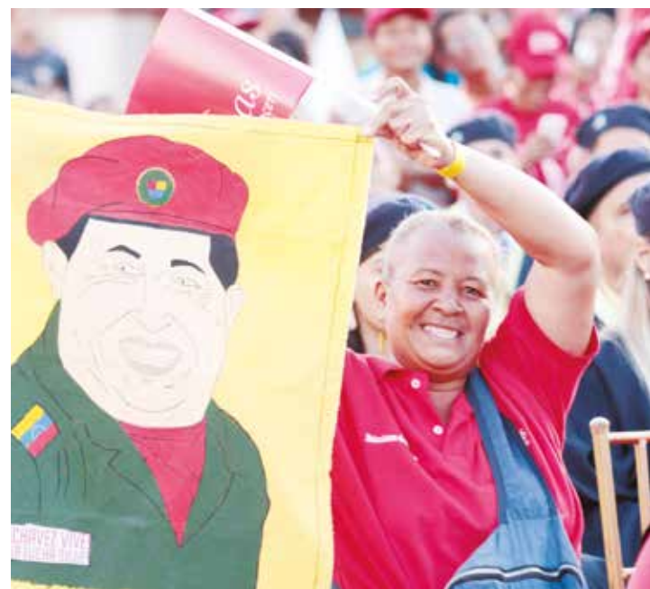
Pueblo en defensa de la Revolución.

“ La prensa burguesa y la canalla mediática pro- imperialista en el ámbito internacional, silencian las denuncias de injerencia estadounidense que el Gobierno Bolivariano ha realizado públicamente”