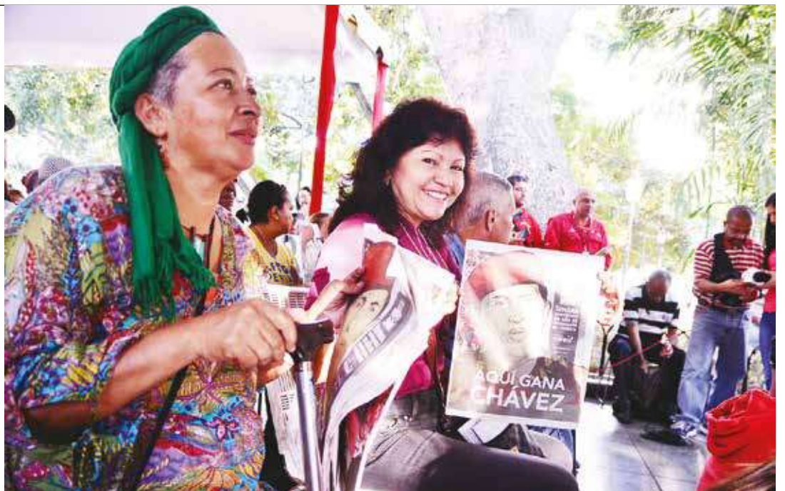
El pueblo celebró junto a Cuatro F.