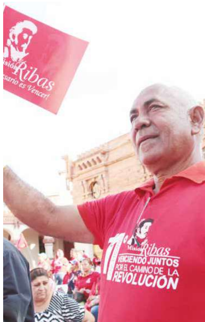
Hay que luchar por el legado de Chávez.

El 6D nadie impedirá que se lleven a cabo las elecciones donde reafirmaremos como mayoría, que queremos continuar en Socialismo. El 6D vamos pa' la calle, a ganar por Chávez y con Chávez, y a mantenernos firmes defendiendo la Paz ante cualquier circunstancia. •