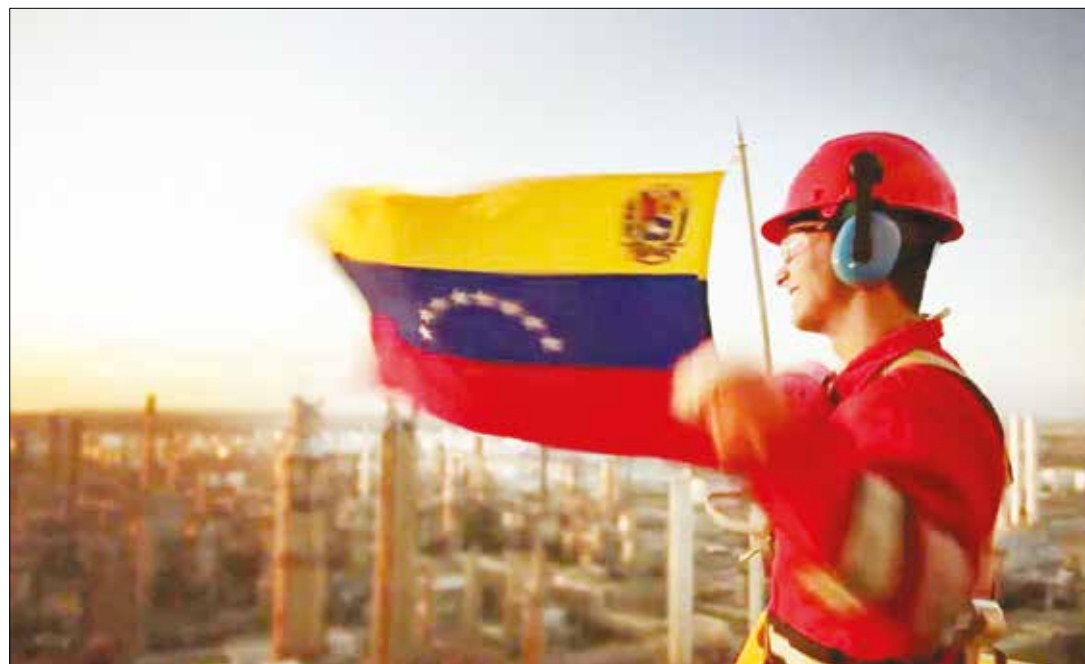
Las operaciones de la petrolera transcurren con normalidad.

contratos de largo plazo con un menor grupo de proveedores, los cuales garantizarán mejores precios y no como ha ocurrido hasta ahora cuando se acude al mercado denominado “spot” o corto plazo, en donde los precios son superiores. La máquina de mentir, como es de suponer, no se enteró de las declaraciones de Luongo. •