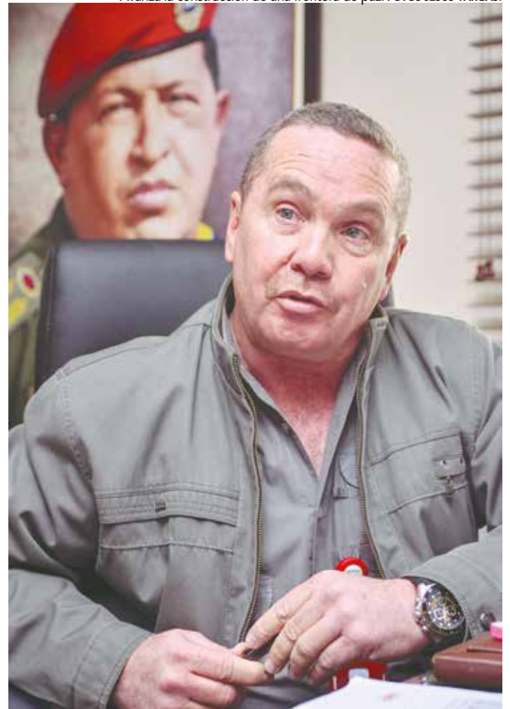
Avanza la construcción de una frontera de paz.

de ciudadanos nacionales y extranjeros, así como sucede en los puertos marítimos y aéreos de la nación, del mismo modo debemos hacer en los puntos y pasos fronterizos, y en eso está trabajando en Ministerio de Interior de Justicia y Paz, un esfuerzo importante por mejorar la tecnología. La cédula, por ejemplo, no puede seguir siendo la misma, debe ser modernizada, porque ha sido vulnerada por diferentes factores, un sistema que identidad debe pasar también por el control de los extranjeros, por lo que se requiere que nuestro sistema de migración debe estar soportado y avalado por un conjunto de leyes, pero no del año 39 o 42, las que aún tienen vigencia.