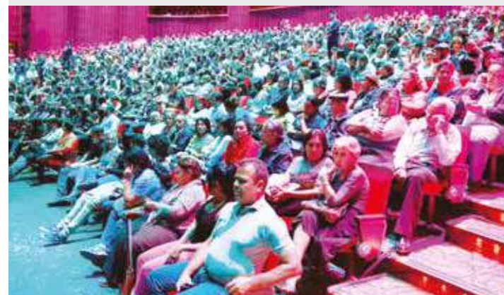
La música es parte de nuestra alma

Olga Tañón, Elvis Crespo, Omar Enrique, Diego El Cigala y La Ley, todo esto en el marco del Suena Maracay que a su vez se llevó a cabo simultáneamente con el Festival Otro Beta es Posible que año tras año deleita con música a los aragüeños. Para este evento sirvieron los espacios del recién inaugurado Teatro de la Ópera de Maracay, lugar donde se dio inicio al festival el día 19 de noviembre y La Avenida Bolívar de Maracay que fue la encargada de ponerle fin, con un multitudinario concierto, a esta primera edición el pasado sábado 21.