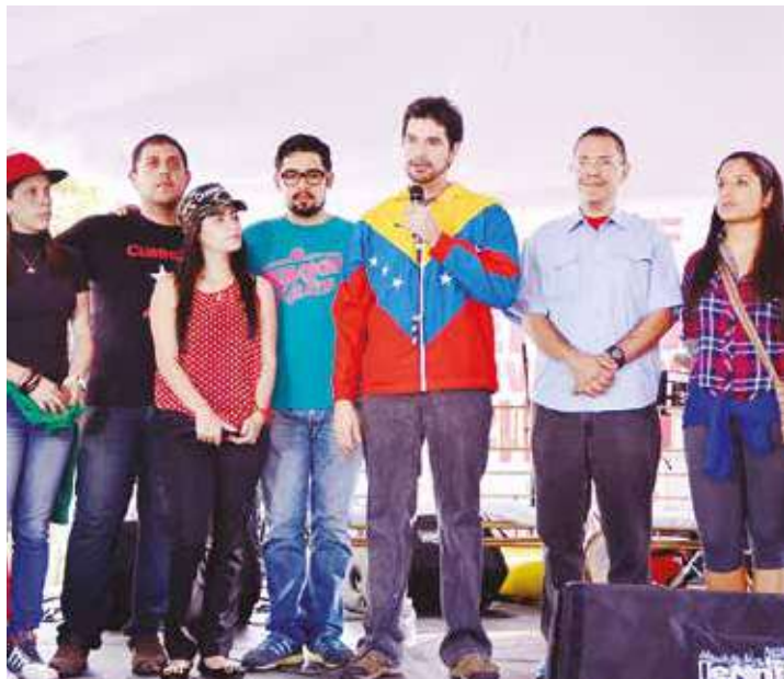
Celebración del primer aniversario de Cuatro F.