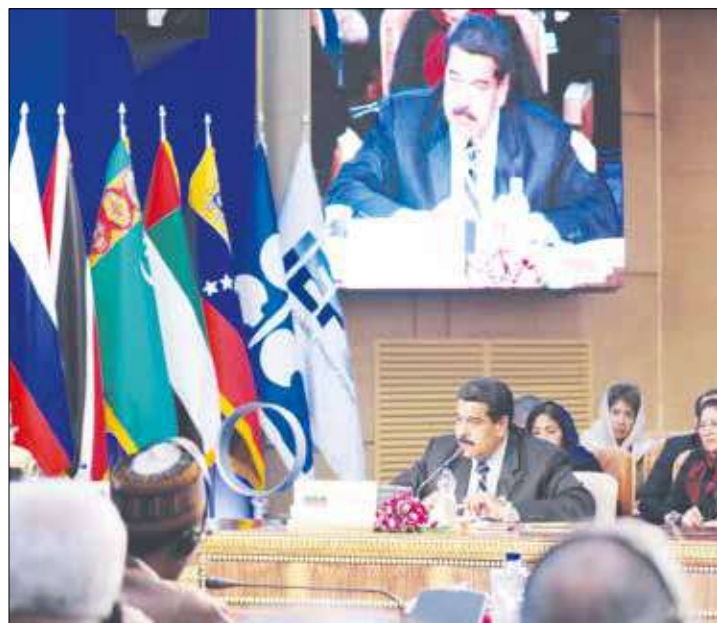
Maduro en la Cumbre de Productores de Gas.