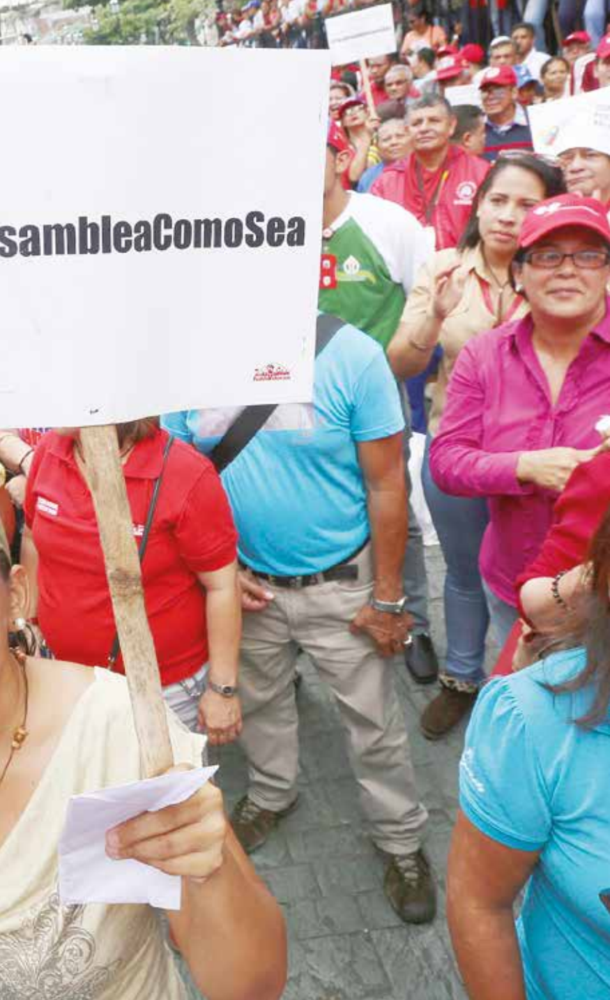
El pueblo para la Asamblea.

no importa la democracia. Su objetivo es claro y conciso, poner fin a la Revolución de Chávez y la contienda electoral puede ser un conveniente punto de partida para ello.