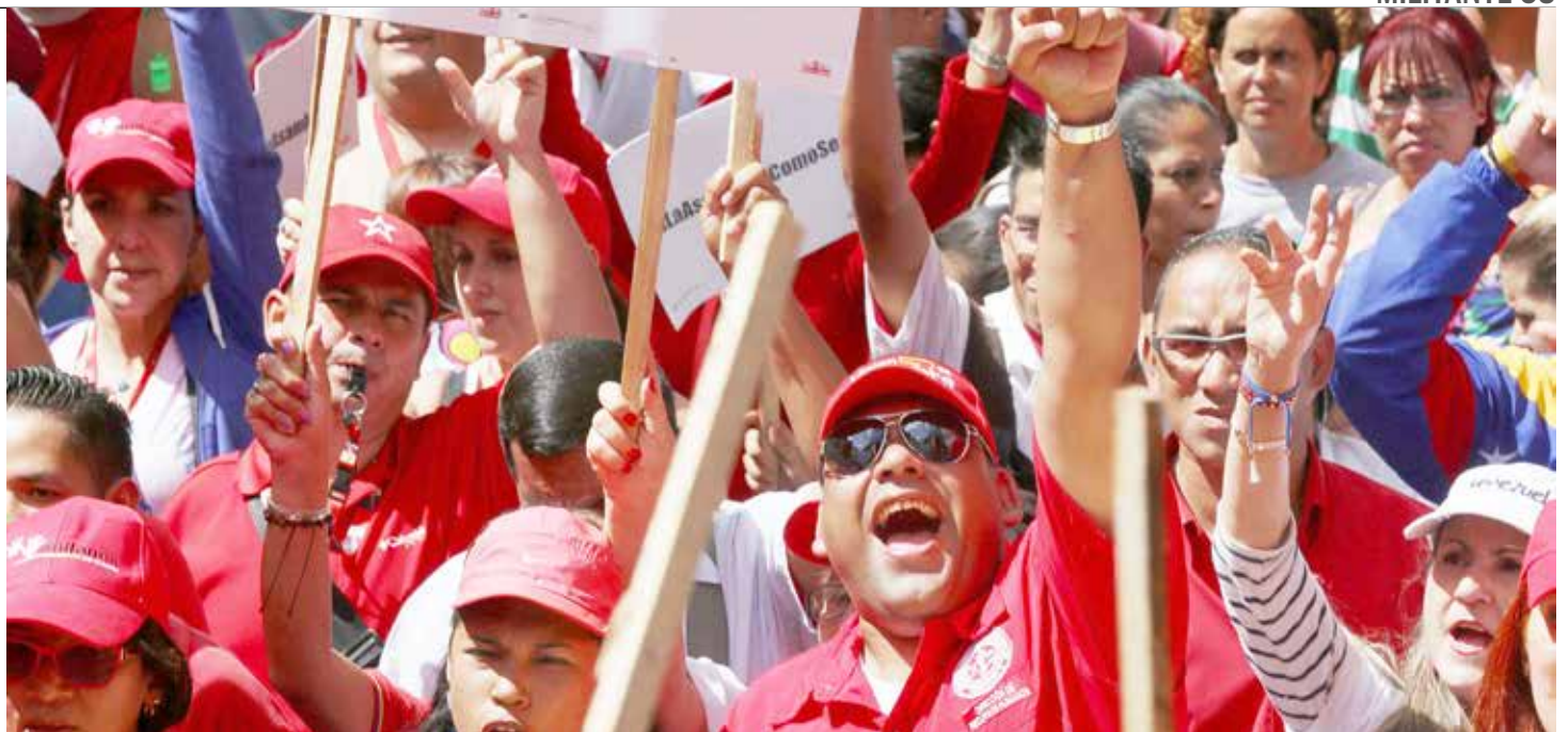
Unidad, lucha, batalla y victoria el próximo 6D.

Es así como el GPPSB en Alianza Perfecta, se ha volcado a las calles de Venezuela para ratificar su compromiso con el proceso revolucionario y reafirmar, una vez más, que las candidatas y candidatos, dignos hijos de Chávez, ganarán el 6 de diciembre.