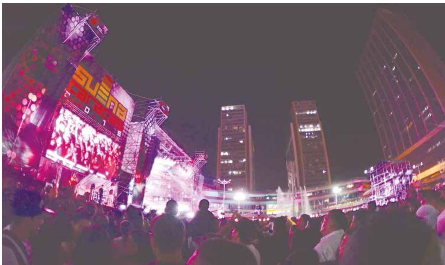
Los caraqueños asistieron masivamente al festival organizado por la Alcaldía de Caracas FOTO JESÚS VARGAS .

Para los venezolanos este tipo de representaciones musicales han calado en su devenir como algo natural, común; y lo es, pero es obligatorio también recordar que esto solo seguirá siendo posible en Revolución"