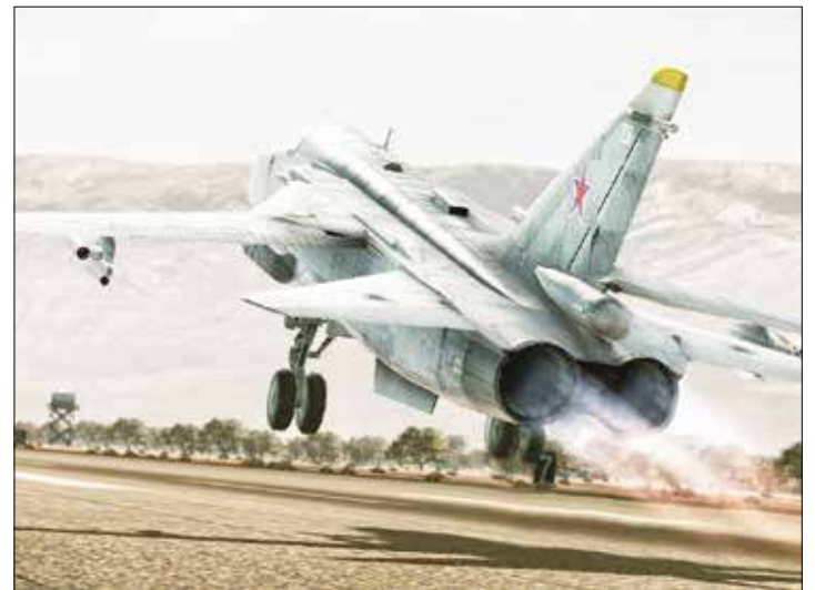
Los Su-24 están activos en una docena de países.

Hace unas dos semanas, el propio Putin mostró en una reunión del G-20 fotografías satelitales y aéreas en donde se visualizan caravanas de hasta cinco kilómetros de camiones de transporte de combustible. Desde ese momento Rusia comenzó a lanzar bombardeos sobre esta infraestructura energética del Daesh con la finalidad de atacar sus finanzas. Gran parte de este petróleo terminaría en la frontera turca, donde sería comprado por negociantes de esa nación a un precio de hasta la mitad del establecido por el mercado petrolero. “En esos barriles no hay solo petróleo, sino la sangre de nuestros ciudadanos”, señaló Putin. •