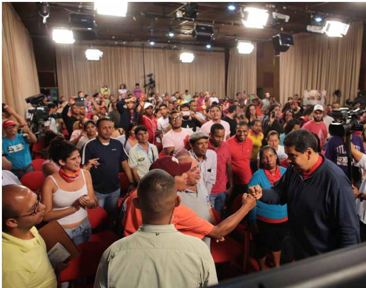
Yo no voy a entregar la Revolución, y cuando digo yo, digo nosotros.

habían impuesto a Venezuela, y para ello están decididos a destruir el Plan de la Patria, es una lucha de clases, y en momentos de confusión hay sectores del pueblo que se autoagreden”.