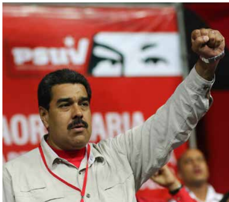
La derecha tratará de propiciar la privatización de Cantv.

“Nosotros hemos hecho de todo para cumplir con los pagos. Es una guerra económica, un bloqueo financiero, un boicot interno en la fijación de precios, distribución de productos y su comercialización. La guerra hay que llevarla a lo concreto. Ellos quieren un capitalismo más salvaje que todos los que se le