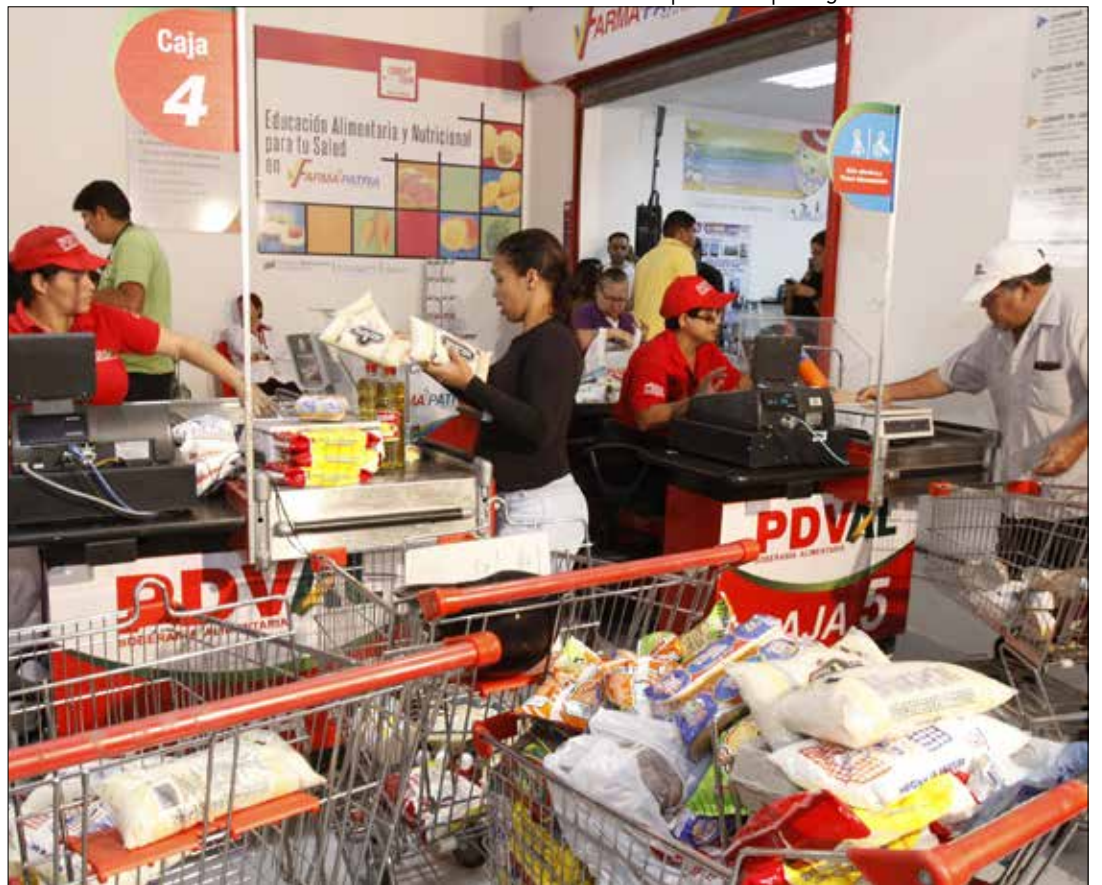
Resulta vital romper con los paradigmas ortodoxos.

El Presidente Maduro debe llevar adelante la tarea