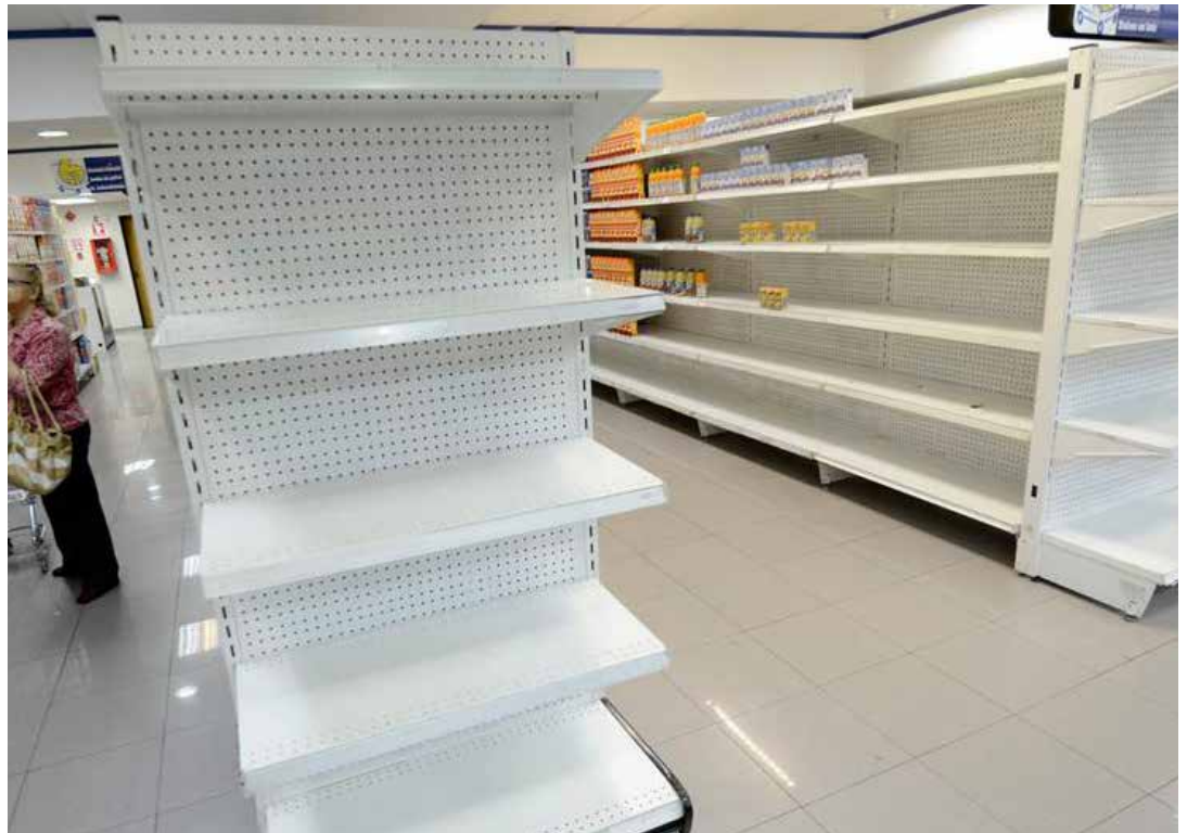
El capitalismo no respeta ninguna norma.

Dos días antes de las elecciones parlamentarias, el presidente de Colombia Juan Manuel Santos, aseguró en un foro empresarial en su país