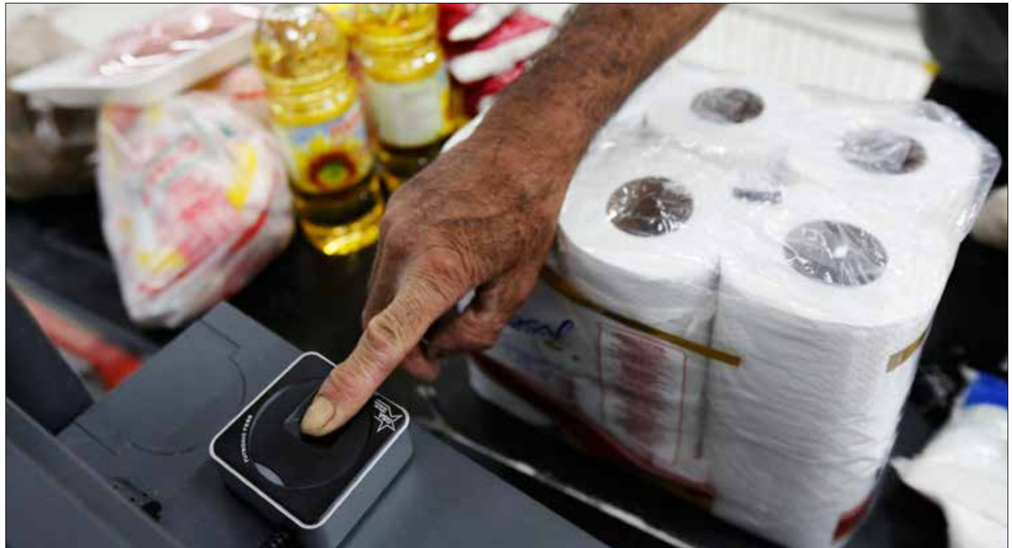
Venezuela debe emprender métodos nuevos y más audaces para una nueva economía.

Pero justo por esto último, también es cierto que el presidente Maduro entonces enfrenta una tarea más compleja. Pues la opción no es entre recuperar y reformar, sino entre recuperar y transformar: recuperarse de los efectos causados por la guerra económica y avanzar en transformaciones que apunten a desenredar males estructurales de la vida económica nacional (la concentración monopólica, el carácter parasitario del "empresariado" nacional, la dependencia de la volatilidad del ingreso petrolero, la fuga de capitales, etc.), así como