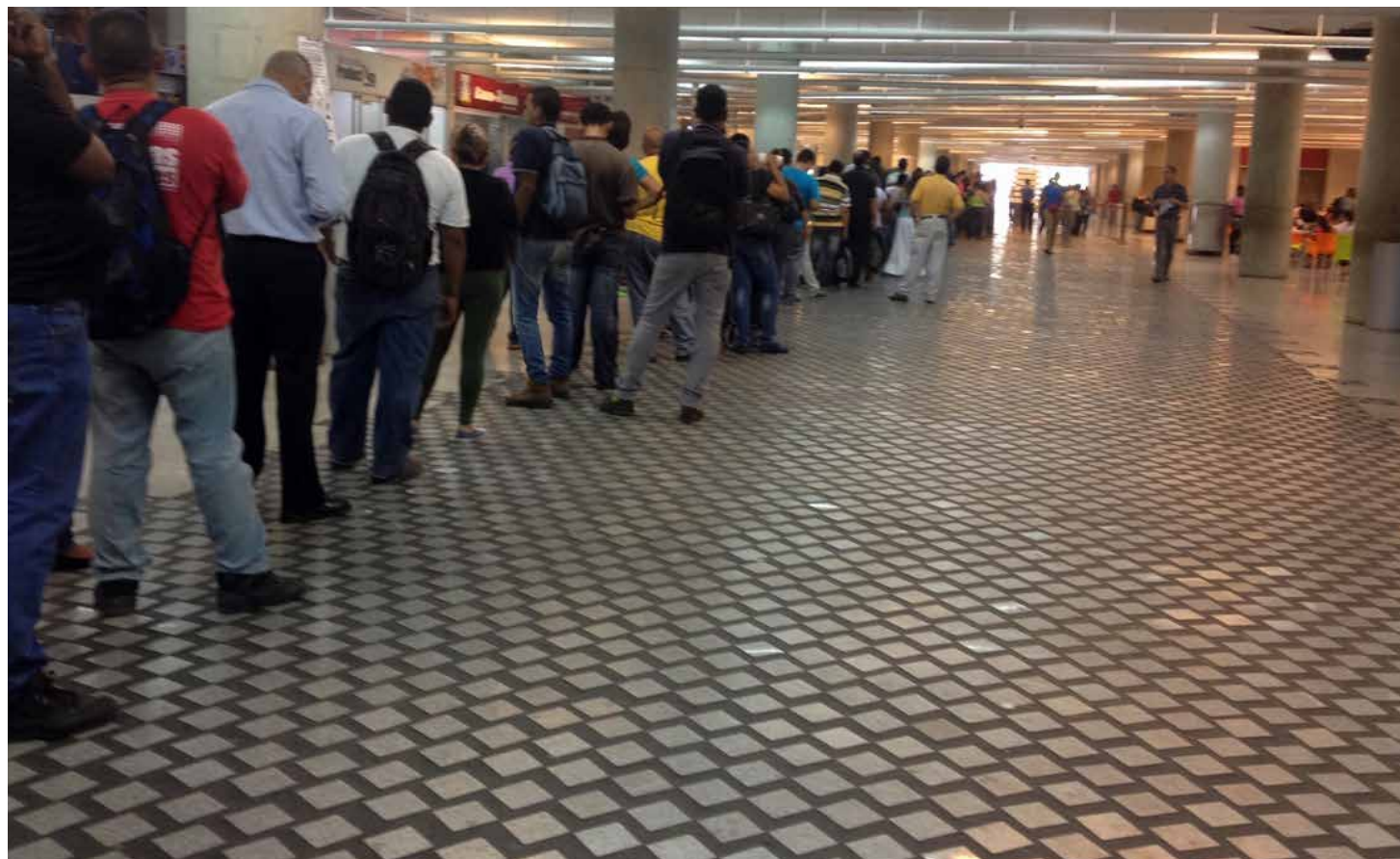
Venezuela padeció una pertinaz guerra económica.

ocasionado por la guerra impedía que el electorado pudiera ejercer su libertad de manera consciente y responsable. Los continuos ataques de los alemanes y las enormes dificultades de la vida cotidiana, entre ellos el de la obtención de los elementos indispensables para la misma, afectaban de tal manera a la ciudadanía que impedían que esta ejerciera sus derechos en pleno goce de la libertad.