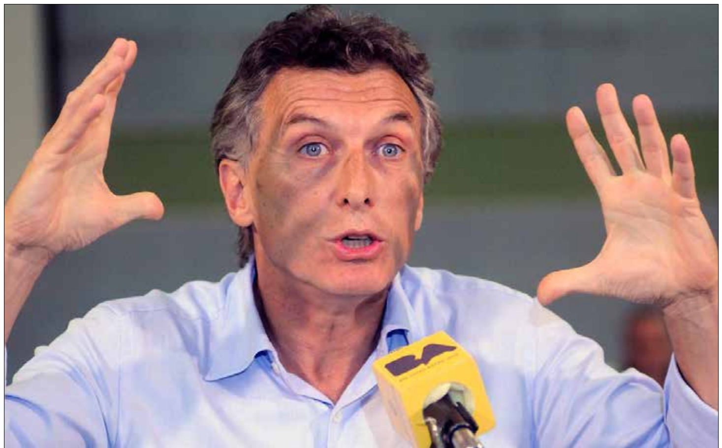
Macri buscará destruir la integración latinoamericana.

Los resultados de las últimas dos elecciones en América del Sur representan pasos importantes para la estrategia de EE.UU. de recolonización de América Latina y el Caribe