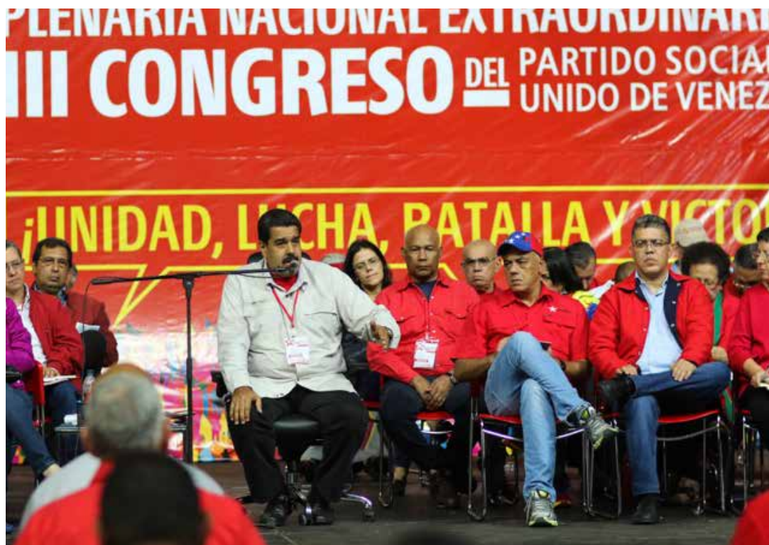
La contrarrevolución intentará un asalto para retornar al pasado neoliberal.

En el debate sobre la organización de los revolucionarios están involucrados al menos