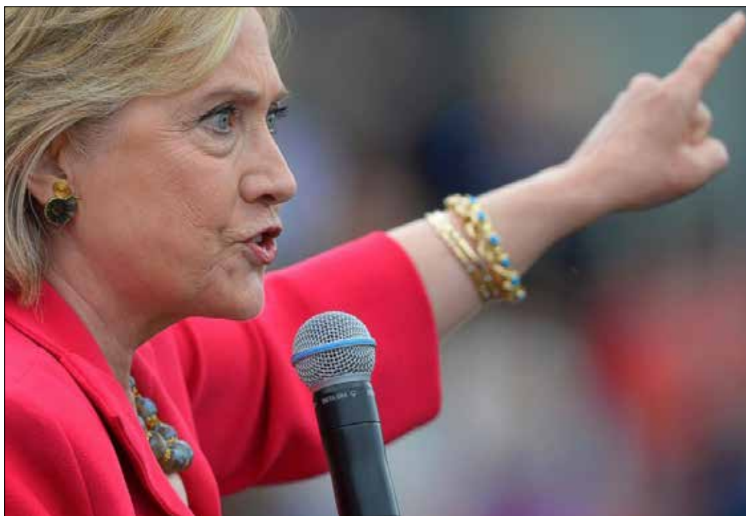
Hillary Clinton tiene un “especial” interés en Venezuela.

Gracias a Hugo Chávez, hacia fines de siglo XX y principios de siglo XXI, en América Latina y el Caribe se actualizó el sueño de Bolívar. Los pueblos recuperaron el paradigma de integración que le da sentido histórico a la aspiración de unidad. Con el nuevo mapa geopolítico, hoy este proceso está seriamente amenazado”