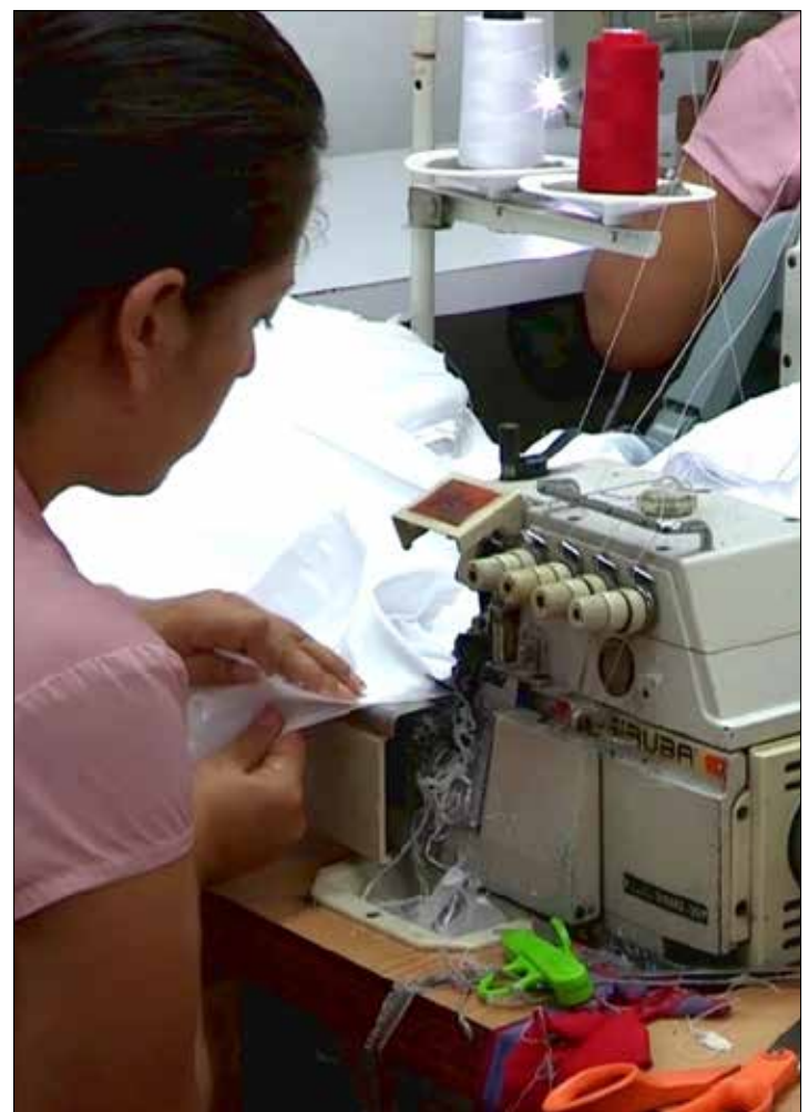
El país enfrenta nuevos retos.

El giro de timón económico no es más que el de una nueva sociedad para todas y para todos, incluso para aquellas y aquellos que, saboteando el camino, la niegan incluso para sí mismos"