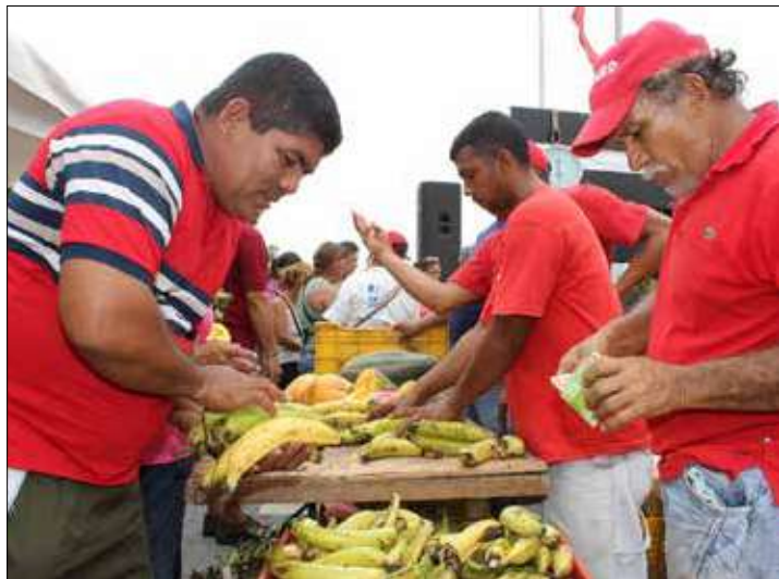
Venezuela debe recuperar y transformar.

Y continúa un poco más adelante (los subrayados son nuestros):