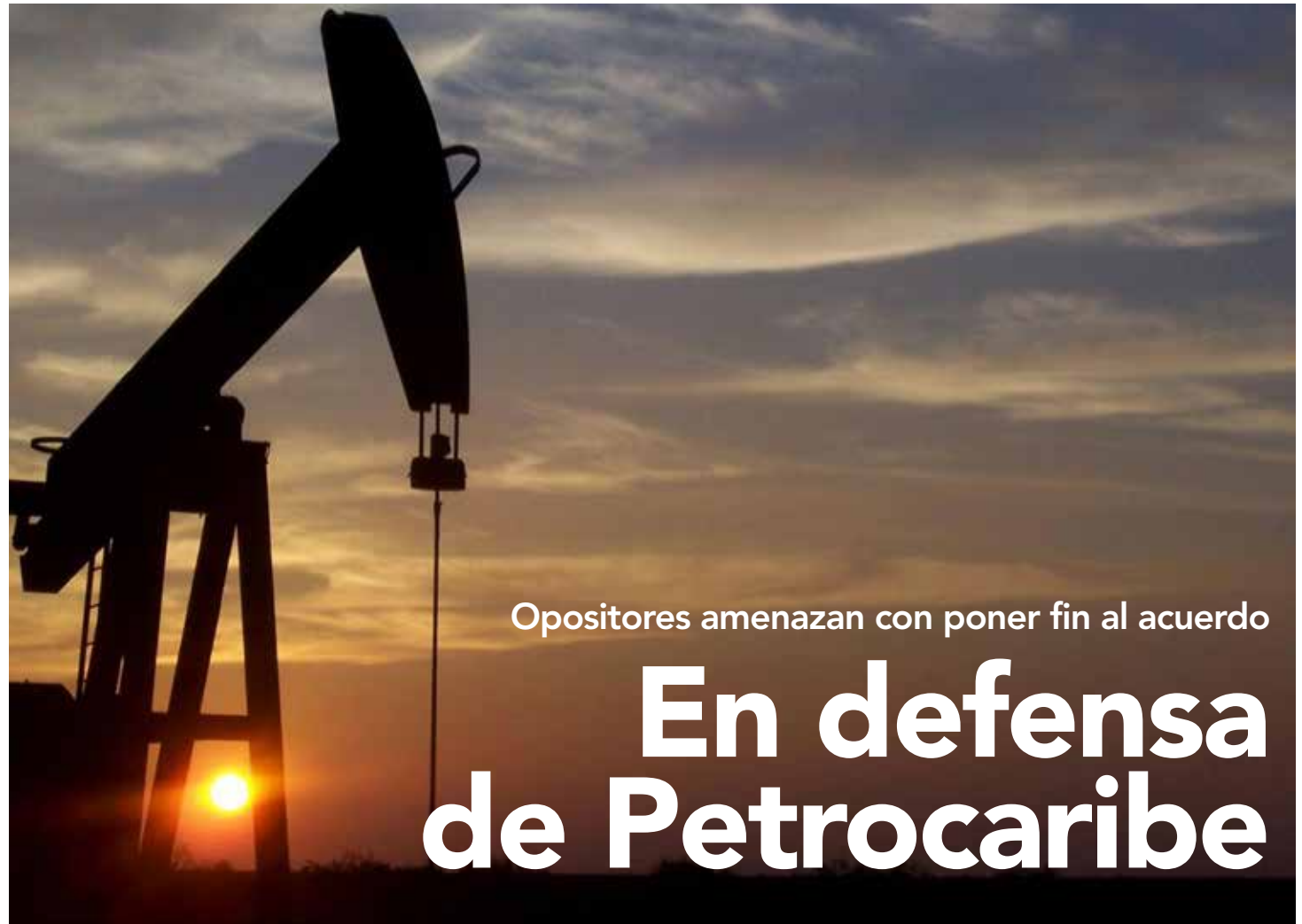
El convenio ha generado estabilidad en la región

“La diplomacia petrolera debe acabarse, no más petróleo regalado”, le dijo al periodista Isnardo Bravo, en entrevista para el diario El País de España, uno de los jefes de la oposición venezolana, Henrique Capriles Radonski. Luego, en términos absolutamente personalistas aseguró: “Hay proyectos de ley que yo voy a llevar a la Asamblea Nacional, y la verdad que con la mayoría de los diputados tengo canales de comunicación por el peso político que yo puedo tener en el país”. Las declaraciones de Capriles Radonski dejarían en claro que ya existe un proyecto legislativo para