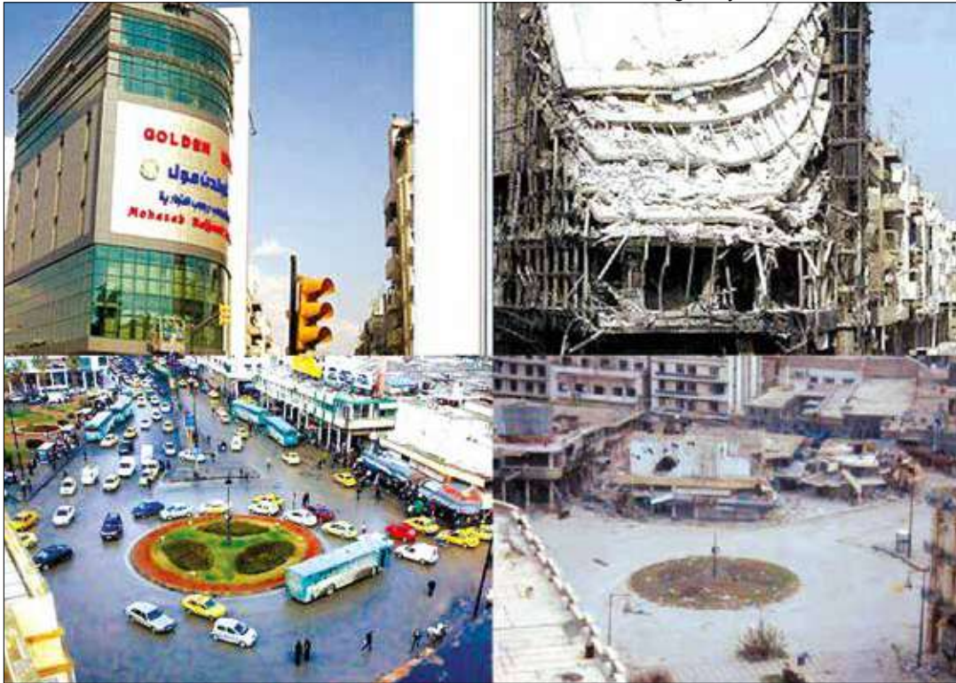
La ciudad de Homs antes de la guerra y en la actualidad

Destrucción y terror es la herramienta de los yidahistas