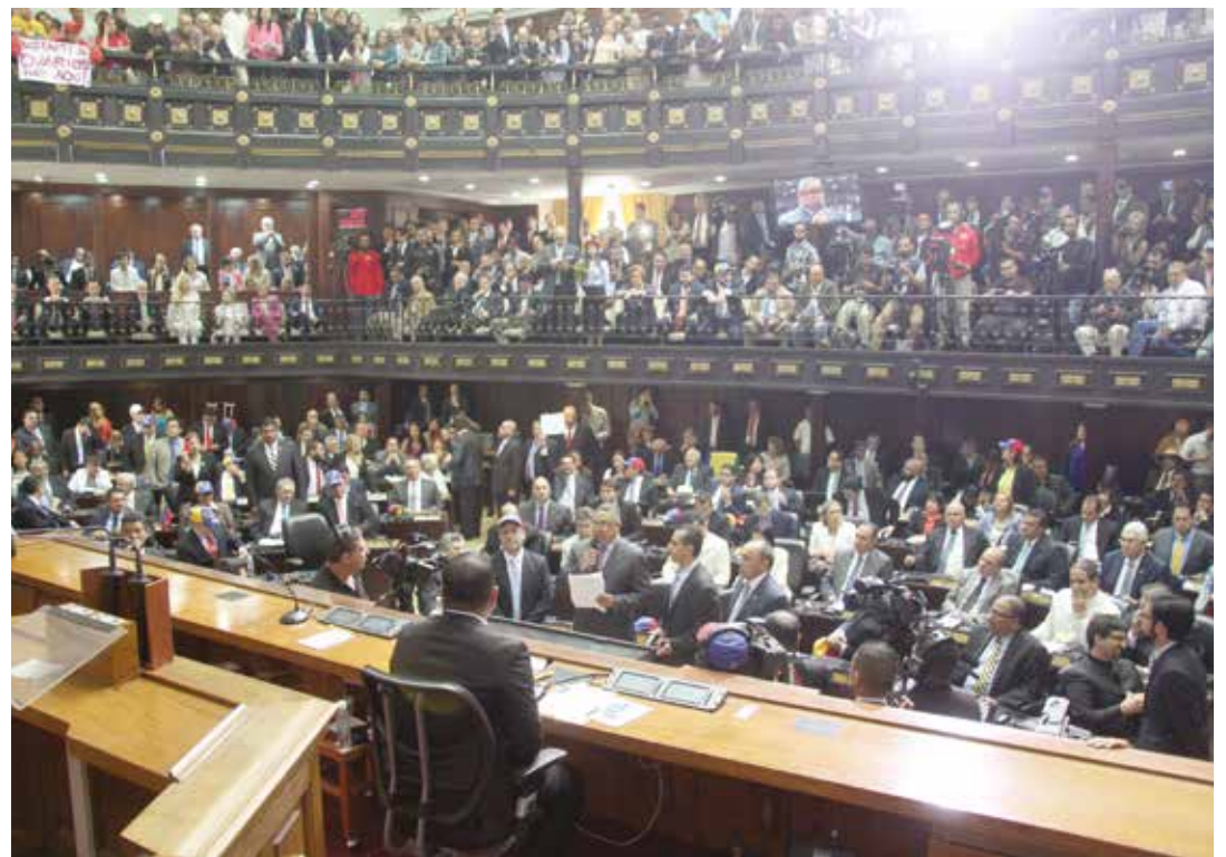
El parlamento contrarrevolucionario se instaló con promesas incumplidas.

Uno de los titulares más frecuentes durante la semana anterior a la primera sesión parlamentaria en el prensa nacional rezaba que: "Se eligieron 112 diputados y 112 diputados vamos a juramentar" repetido hasta el cansancio por los principales voceros opositores. Sin embargo, enfrentados a la posibilidad de ejecutar un acto que sabían ilegal —debido a la decisión tomada por el Tribunal Supremo de Justicia— prefirieron incumplir su promesa y no juramentaron a los tres diputados electos en las pasadas elecciones por el estado Amazonas y que han sido impugnados ante la máxima instancia judicial. "Hoy logramos que se impusiera la sentencia del Tribunal Supremo de Justicia, que se acataran todas esas decisiones y hoy los que fueron impugnados no fueron juramentados. Hay suficiente evidencia de delitos electorales. Eso se respetó y nosotros hicimos respetar al poder judicial", recalcó un rato después la diputada electa