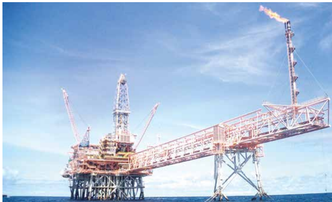
El Campo Perla es el quinto proyecto de su tipo a nivel mundial.

Como indicó el ministro de Petróleo y Minería, el encadenamiento de las actividades de explotación gasífera y de la petroquímica (la cual genera productos terminados de mayor valor comercial) conjuntamente con la potenciación