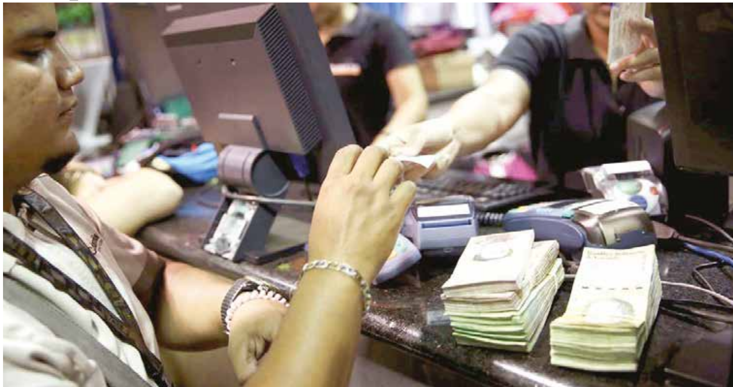
Los países más ricos y estables del mundo poseen estrictos sistemas impositivos.

Nicolás Maduro el pasado 30 de diciembre.