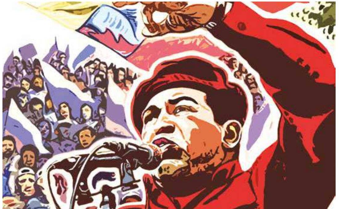
Nos esperan caminos duros que debemos seguir atrevesando.

“ Los escenarios son múltiples: veremos a un parlamento dirigido por la derecha que intentará darle marco legal a la consumación de la impunidad históricamente practicada y patentada por ellos”