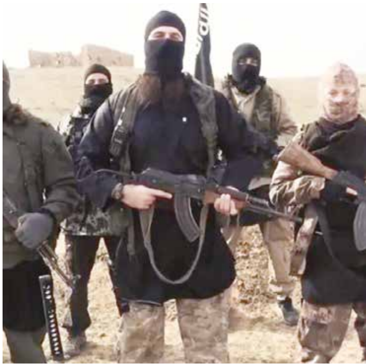
Grupos armados también cobran impuesto.

imponen por ser los dueños de la riqueza, por ser los nuevos señores feudales del mercado concentrado y voraz. Aquellos analistas y académicos, que defienden el statu quo , dirán que la fijación de precios por prácticas oligopólicas no pueden ser catalogadas como un impuesto, porque los consumidores siempre tienen la libertad de comprar en otra parte. No obstante: ¿es esto realmente cierto? Sería reduccionista pensar que la libertad se mide solo por la decisión autárquica de ir a la tienda de la esquina o comprar en un gran supermercado. Hay que elevar el debate y reconocer que el sistema de mercado en Venezuela como en otros países fuerza a la gente a comprar donde el mercado lo establece, obliga a que el consumidor vaya donde el supermercado está y bajo las condiciones que el oferente impone como ocurre en otras partes del mundo. Puede que este oferente sea una gran cadena tipo Polar, el único pulpero del pueblo que tiene el pollo, el último bodeguero que tiene el papel toale o, de un tiempo a esta parte, el bachaquero que tiene cualquier cosa. Por lo tanto, si la ciudad y el país están absolutamente capturados por estos personajes, ¿cómo podemos considerarnos libres de elegir?