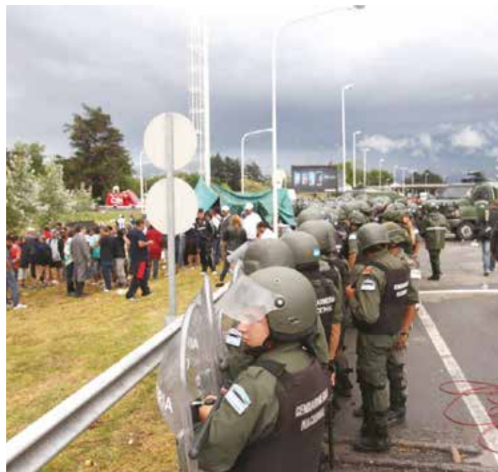
El gobierno de Macri se estrenó con represión.

“ En Argentina crecerá la desocupación, la pobreza y la indigencia, la concentración de ingresos avanzará (ya está avanzando) rápidamente, el crecimiento económico nulo o negativo será inevitable”