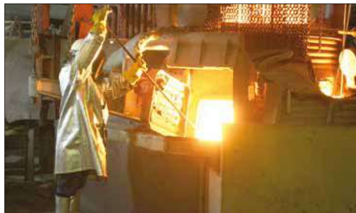
La minería puede representar una fuente de ingresos.

“Los precios del petróleo fluctuarán entre 35 y 50 dólares el barril, de modo que Irán no está preocupado por una caída de sus ingresos por la venta de crudo”, dijo Mehdi Asali, delegado de Irán ante la OPEP, citado por la agencia de noticias Shana. Irán ha señalado en diversas ocasiones a Arabia Saudita por alentar las políticas que han causado la caída de los precios del petróleo y que también socavan la economía del país, afectado todavía por las sanciones de Occidente, cuyo levantamiento se espera para los primeros meses del año. “Los miembros de la OPEP deberían buscar una solución al declive de los precios porque esta situación no nos conviene económicamente”, señaló Asali. De acuerdo a los pronósticos de Financial Times, el precio del crudo se mantendrá en un promedio de 50 dólares en el año 2016, a pesar de que estas cotizaciones no sirven para mantener los grandes proyectos de inversión a nivel mundial. •