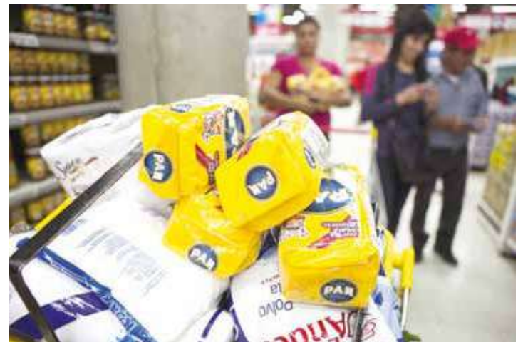
La escasez es un impuesto de la oligarquía al pueblo.

Parfraseando a un Superintendente de Precios Justos que alguna vez dijo que no es verdad que Venezuela sea el país del no hay , como dice la derecha a propósito de la escasez inducida, sino del no hay donde debe estar gracias a la acción de los acaparadores, contrabandistas y revendedores, pareciera evidente que nuestros problemas financieros y fiscales no se deben tanto a la escasez de recursos como al acaparamiento y desvío grosero de los mismos. Esperamos que con estas nuevas medidas –que en buena medida requieren de un SENIAT mucho más activo y eficiente– avancemos en solucionar este entuerto que tanto daño históricamente le ha hecho al país, para poder conducirnos hacia una sociedad más justa y dejar atrás definitivamente y para siempre el parasitismo de los pocos en detrimento de los muchos. •