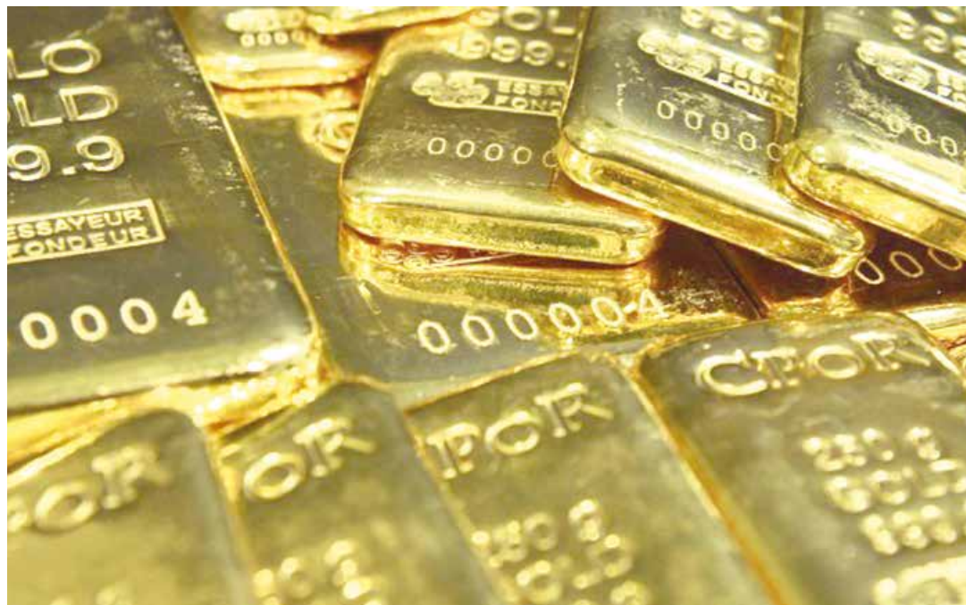
Se recurrirá a otras fuentes productivas como el oro.

Solo juntos podemos rehacer, reconstruir, lo que esté mal; fortalecer lo que hemos construido y visualizar un siglo XXI viendo la Venezuela potencia. Solo nosotros podemos”