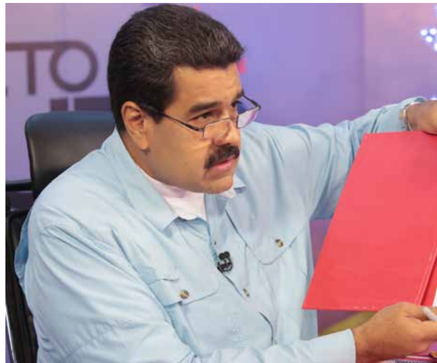
Presidente Maduro decretó leyes revolucionarias.

“La idea es hacer una suerte de acupuntura en la entrega de divisas en función de lo que se produce. El incentivo es demostrar que se puede producir y no al revés, ya que se trata de