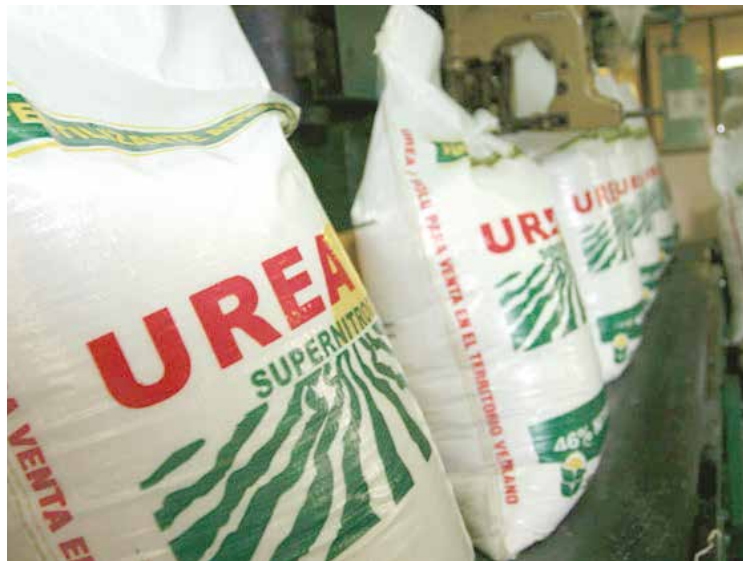
En petroquímica Venezuela tiene fortalezas.

Asimismo, hizo un llamado para que la nueva Asamblea Nacional (AN), cuya mayoría está en manos de la derecha, no ponga obstáculos a esta iniciativa que pretende atender la realidad económica que atraviesa el país. •