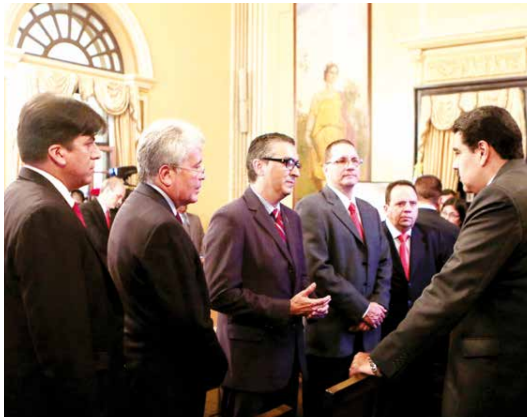
El equipo económico coordinará las acciones para superar la guerra económica.

El presidente Maduro igualmente designó como nuevo Ministro de Industria y Comercio a Miguel Pérez Abad, quien hasta ese momento se desempeñaba como presi-