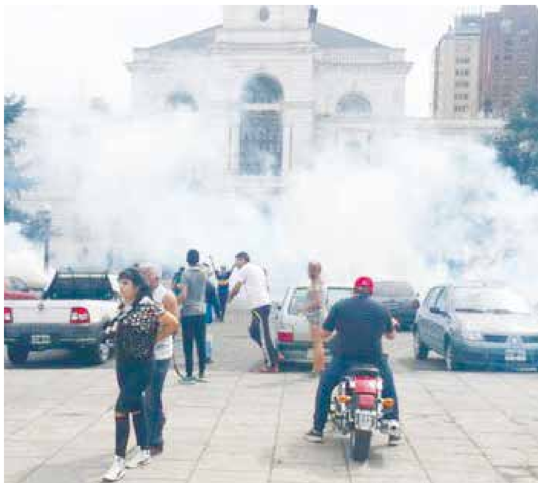
Comienza a mostrarse la verdadera cara del macrismo.

Si la devaluación que tanto se negó en tiempos de “Macri candidato”, se está pudiendo poner en marcha día a día,