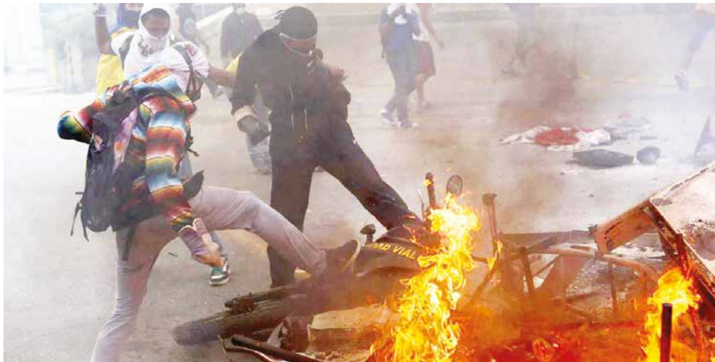
Se pretende exonerar a los violentos.

Consideramos que la Ley de Amnistía que plantean promulgar los recién electos diputados de oposición, en el nuevo período legislativo de la Asamblea Nacional representa una violación directa a los preceptos establecidos en la Constitución de la República Bolivariana de Venezuela y a la Convención