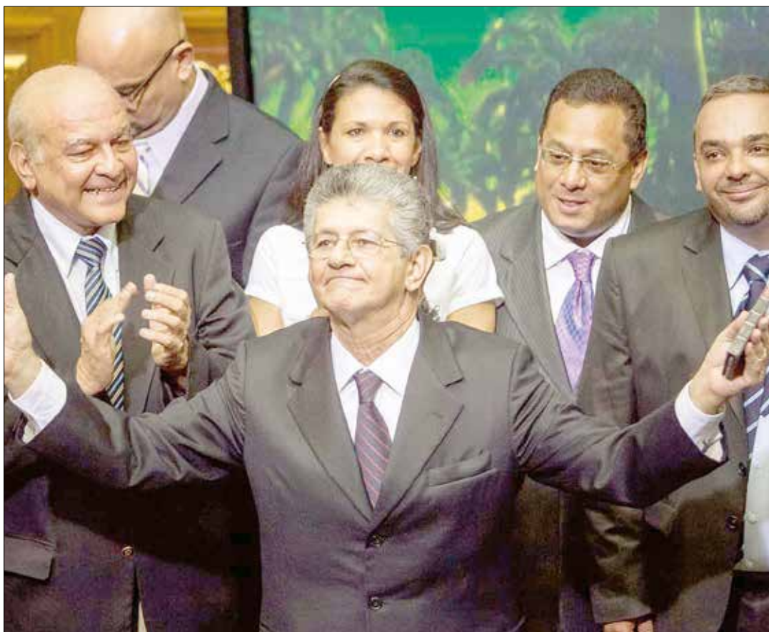
Tiene olfato político para el llamado salto de talanquera.

Todos los años se viste de Nazareno y paga una promesa que nadie conoce. Una vez juró matar al fotógrafo que osara retratarlo con su traje morado porque "las creencias se respetan". •