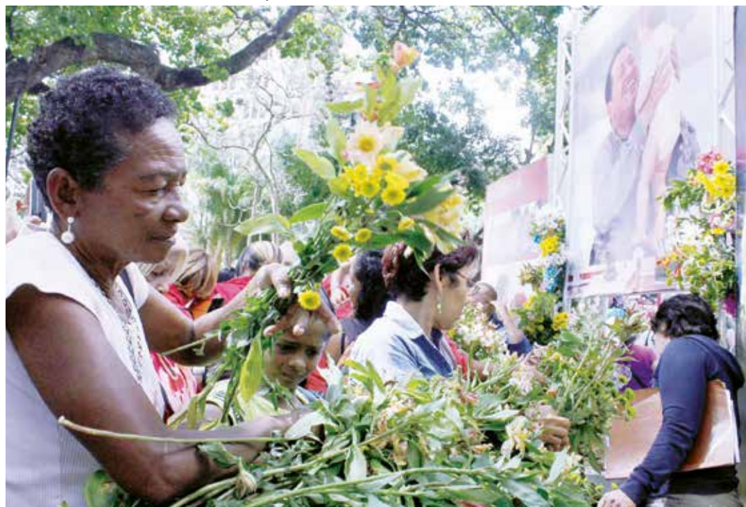
El pueblo reaccionó ante el agravio al Comandante Chávez.

segundo padre que nos liberó de los gringos y al primer padre de la patria lo aprendí a conocer gracias a él, porque Chávez me enseñó a cantar el himno nacional completo, tanto que hizo mi segundo padre de la patria y ahora ese adeco lo trata con desprecio.