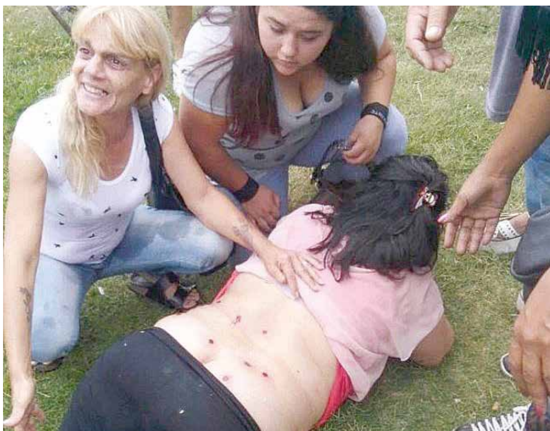
Perdigones contra los empleados públicos.

La política aplicada en lo social por el macrismo es transparente y generalmente la usan profusamente regímenes similares en el continente: generar miedo en los ocupados mostrando las escenas de lo que les ocurre a los nuevos desocupados”