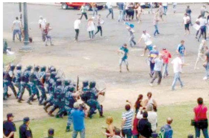
La represión se hace cotidiana.

Solo en el Senado de la Nación han sido dejados en la calle por decisión de la vicepresidenta Gabriela Michetti, 2.035 trabajadores, en una decisión que contó con la bochornosa complicidad del jefe de la bancada del kirchnerista Frente para la Victoria, Miguel Pichetto. A esta cifra hay que sumar los más de 600 cesanteados en el Centro Cultural Kirchner, y otros más en las oficinas del Afsca (Autoridad Federal de Servicios de