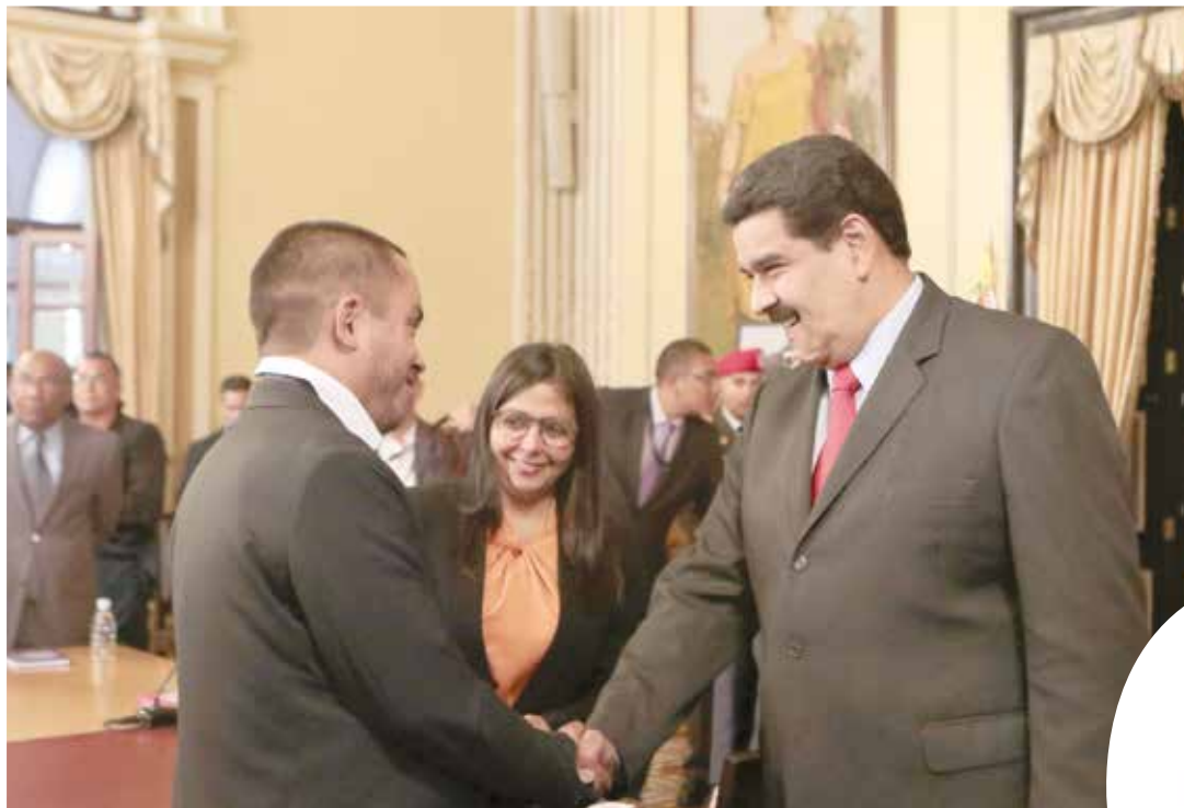
El ministro ha puesto al descubierto los mecanismos de la guerra económica.

De allí que la llamada "inflación se usa como herramienta de lucha política para presionar a gobiernos, imponer intereses o simple y llanamente