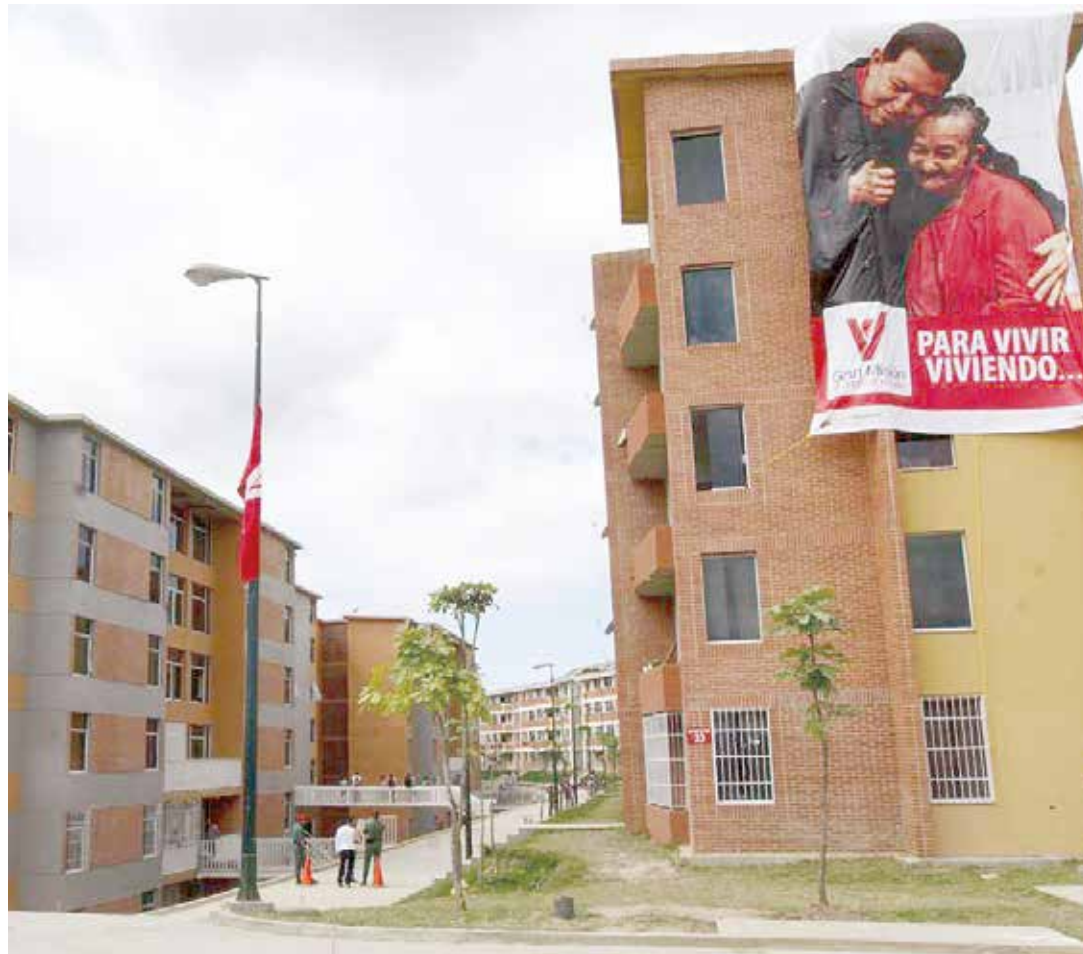
La derecha busca engañar a los sectores populares.

La GMVV no está pensada como una instancia constructora de viviendas, sino como una instancia para la atención de la necesidad de la vivienda en la población. Es un programa social. Toda vivienda asignada debe luego ser cancelada a precios muy módicos (hasta 5 mil por ciento menos con respecto a lo que cuesta en el mercado secundario especulativo) y a 30 años por cada familia beneficiaria. Es por esto que, aunque la GMVV garantiza la propiedad de la vivienda para la familia beneficiaria, condiciona el uso de las viviendas como mercancías destinadas al mercado secundario inmobiliario de viviendas. Si una familia beneficiaria desea (por ejemplo) mudarse a otra ciudad y desea vender su vivienda, deben primeramente cancelarla al Banco Nacional de Vivienda y Hábitat y luego ofrecerla a la Inmobiliaria Nacional (regida por el Órgano Superior