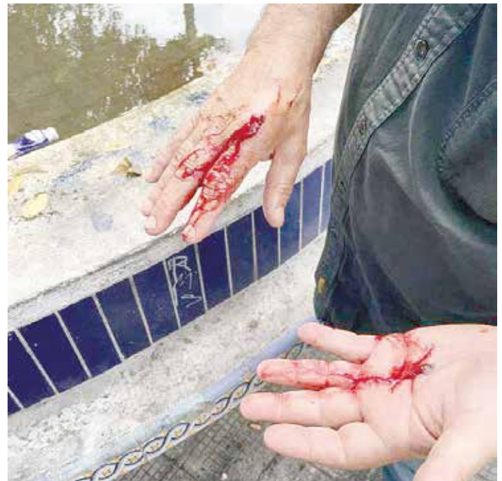
La consigna es no conversar.

Toda esta ofensiva macrista puede hacerse en el plano