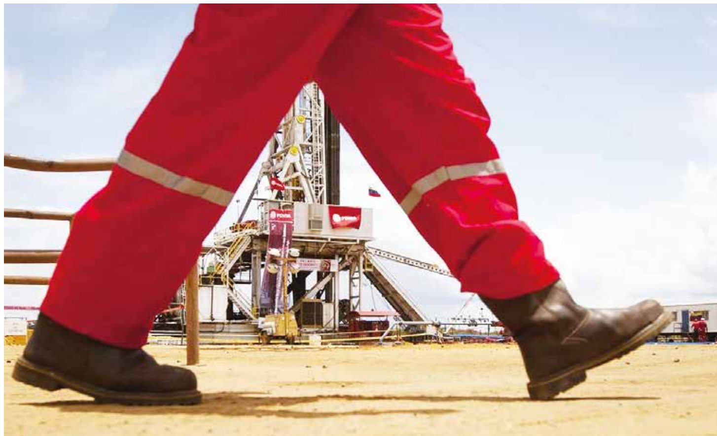
El Comandante Chávez logró recuperar el control de la renta petrolera.

La Revolución pone en marcha la Emergencia Económica para contrarrestar la caída del crudo