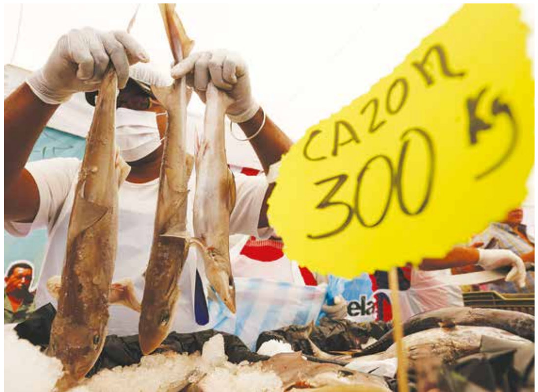
El nuevo modelo fortalecerá a la pequeña y mediana industria.

Sostiene que pese a la negativa opositora de aprobar el Decreto de Emergencia Económica, el Ejecutivo deberá asumir medidas especiales ante la coyuntura actual. •