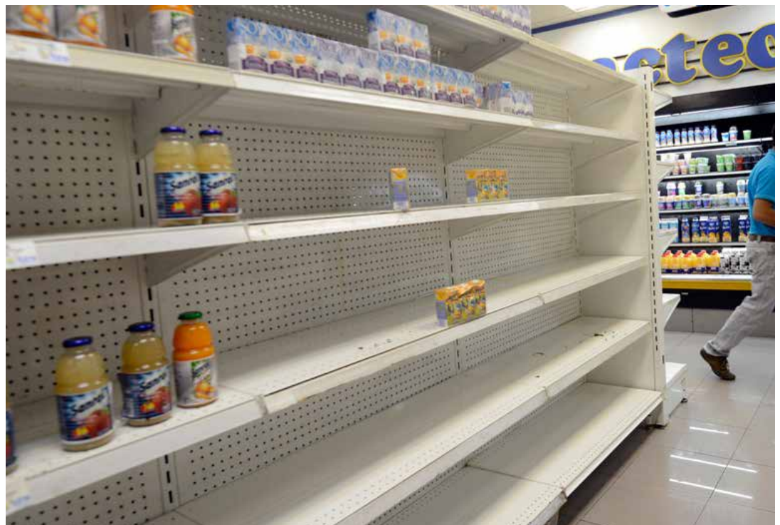
La huelga de inversiones empresarial produce desabastecimiento.

“ La Revolución Bolivariana se abre paso a circunstancias excepcionales en lo económico, entendiendo que sobre tales circunstancias yace una oportunidad que, de consolidarse, puede crear las bases a un nuevo