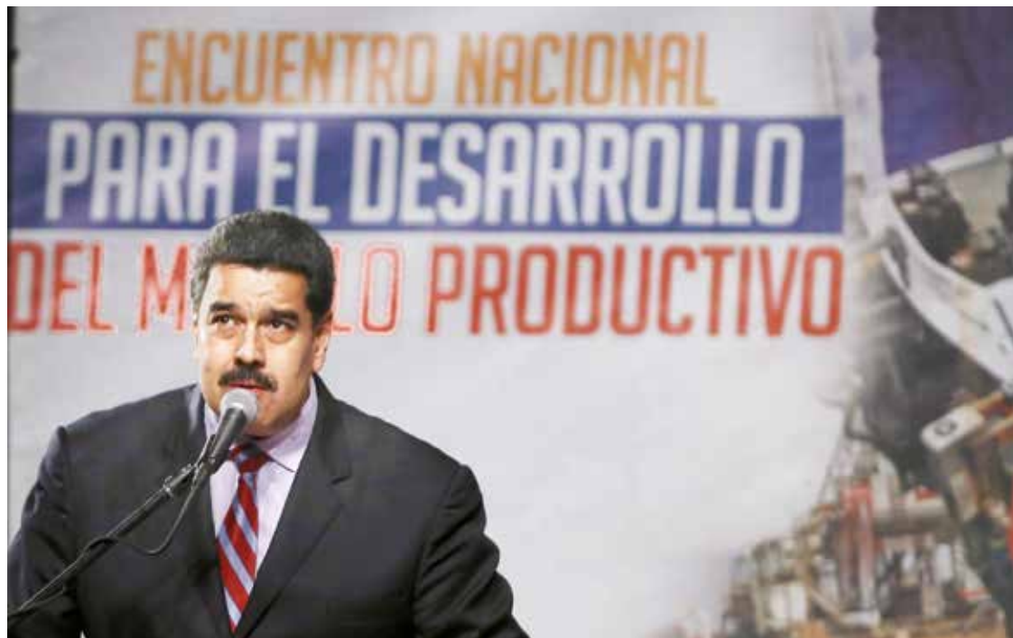
Do yo mi mano para establecer un modelo ganar-ganar.

No obstante, explicó que los factores de la guerra geopolítica, aunados a la capacidad exportadora de Estados Unidos, que se potenció con la apuesta a la extracción con la técnica del fracking, con-