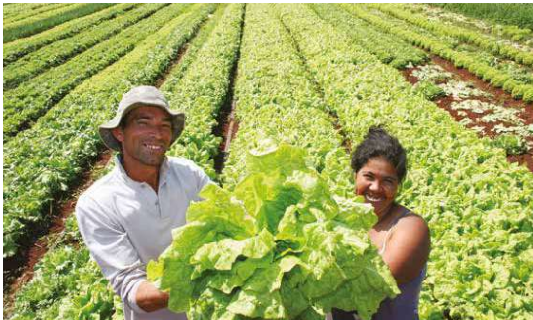
Se debe avanzar hacia la soberanía agroalimentaria.