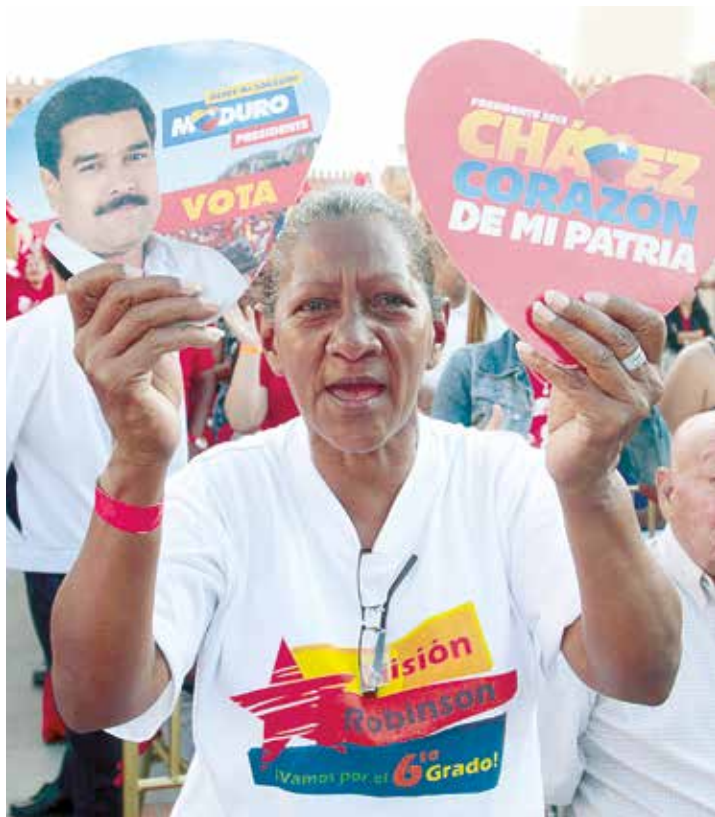
La renta petrolera le ha dado alimentación, salud, educación al pueblo.

En eso cuentan con el apoyo de la contrarrevolución parlamentaria que maneja constantemente el término de “crisis humanitaria” y pide a gritos cualquier injerencia en nuestros asuntos internos. El reciente show del matrimonio López-Tintori, encuadra en este contexto donde se trata de erosionar la legitimidad y la credibilidad de la institucionalidad democrática. Quieren proyectar ante la comunidad internacional la falsa imagen de un Estado violador de los derechos humanos para darle la razón al decreto de Barack Obama. •