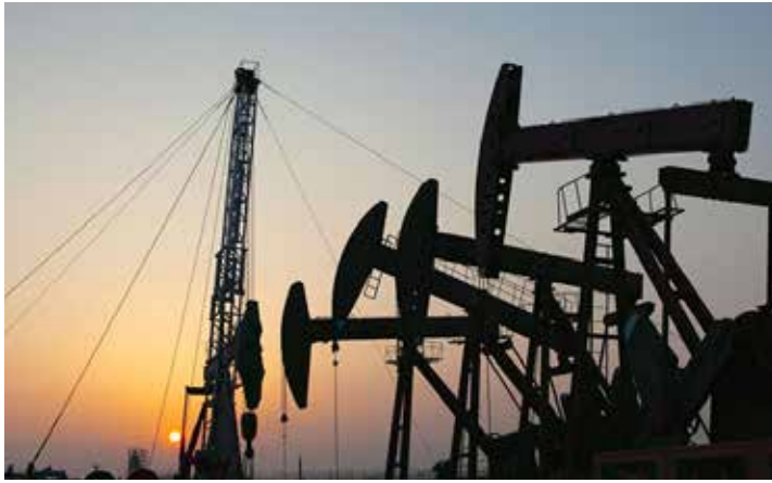
La baja en los precios del crudo afecta los ingresos

ciudades productivas en las plantas venezolanas. Básicamente, las empresas ampliaron su cota de beneficios obteniendo nuevas ganancias exorbitantes, produciendo prácticamente lo mismo que venían produciendo. Otros, con la liberación del tipo de cambio, simplemente distribuyeron lo importado a precios exorbitantes. Luego de haber accedido en condiciones libres a divisas, se pagaban la libre adquisición y acumulación de dólares con el dinero de la gente.