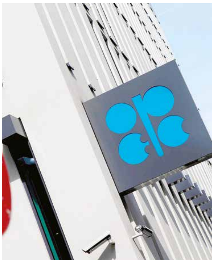
Se dificulta acuerdo en la OPEP.

"Y de inmediato las inversiones en la Faja Petrolífera se van a tener que detener, hasta que los precios se recuperen. La única posibilidad que veo es que comencemos a estimular los campos de petróleo liviano que están en declive". •