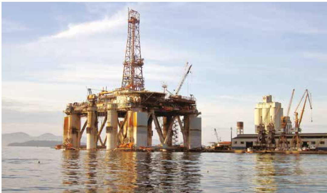
Las inversiones costa afuera son inviables con los actuales precios.

Para nadie es un secreto que hay una elevada dependencia del presupuesto federal ruso de los precios de venta del petróleo y el gas, que representan casi la mitad del total de sus recursos. Precisamente a ese factor se debe el desplome