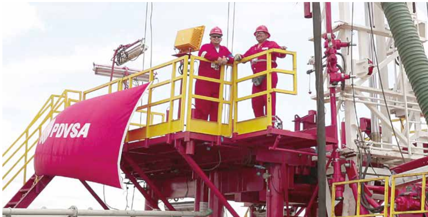
El mercado petrolero mundial está sometido a variables geopolíticas

“Hoy hablé con el presidente de la República Islámica de Irán, Hasán Rouhani, para felicitarlo por el exitoso y muy justo e histórico acuerdo nuclear que ha permitido el levantamiento de todas las sanciones ilegales”, explicó Maduro en el encuentro, al tiempo que señaló la necesidad de alcanzar de nuevo precios del petróleo en “niveles necesarios, justos y estables”. Como se sabe, desde el tercer trimestre del año 2014, el precio del crudo comenzó a sufrir una caída sostenida que apenas ha sido contenida por algunos meses gracias a los esfuerzos de naciones como Venezuela en el seno de la OPEP. No obstante, importantes factores de orden geopolítico en donde se incluyen las crecientes tensiones sociales y militares en el Medio Oriente, están presionando a la baja el precio del petróleo. El conflicto de Siria, en donde la mayor parte de las naciones pertenecientes al Consejo de Seguridad de la Organización de las Naciones Unidas tienen algún tipo de fuerza militar en el terreno, representa apenas uno de los retos de orden político en la región que gravita sobre