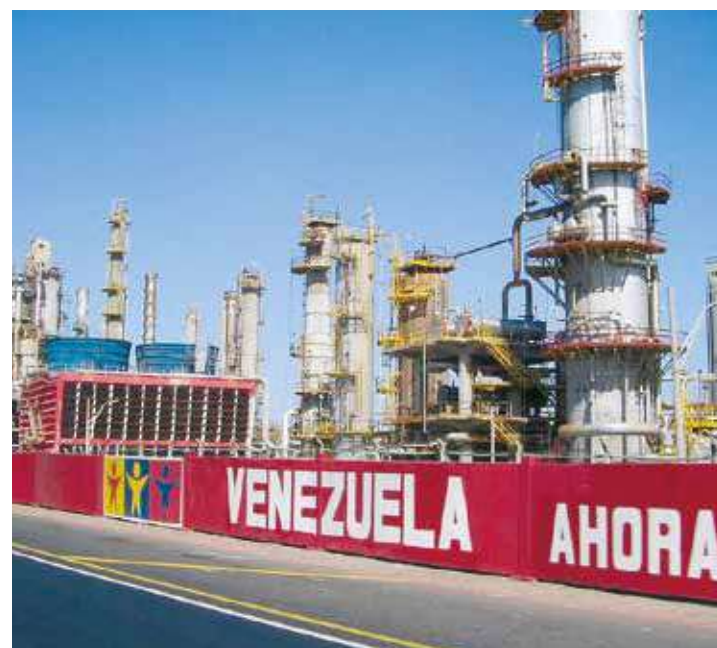
La industria petroquímica es una importante generadora de empleos.