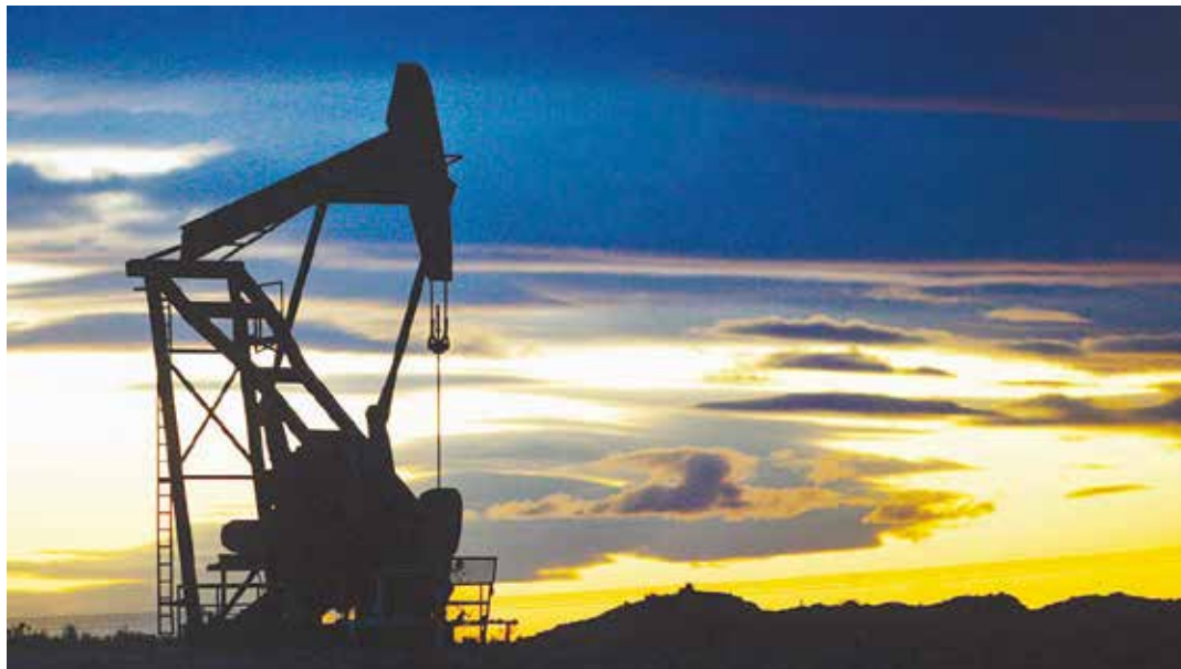
La caída en las cotizaciones obedece a intereses geopolíticos FOTO ARCHIVO

Conservar el legado del Presidente Chávez, como lo ha hecho el presidente Maduro, en un gesto de valentía y amor al país, debe ser reconocido por todos los venezolanos patriotas que estamos decididos a defender la soberanía nacional. •