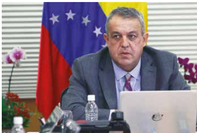
El ministro de Petróleo realizó una gira de trabajo

Desde que se inició la llamada "guerra del petróleo" que redujo las cotizaciones desde los 100 dólares el barril en septiembre del año 2014 hasta un promedio de 20 dólares en enero de 2016 se ha generado "la mayor transferencia de riqueza de la historia humana", según el análisis de Francisco Blanch, economista del Bank of America que toma en cuenta el volumen de dinero que han dejado de percibir las naciones productoras de crudo y ha quedado en manos de los países consumidores. No obstante, estos números no han revertido la situación precaria de la economía mundial y, al contrario, un estudio de Citigroup vaticina un "petroarmagedón" si se mantienen las bajas cotizaciones del crudo, a causa de las bajas ganancias de las corporaciones y las continuas caídas en los mercados mundiales de valores, entre otros elementos que alimentan lo que el Citigroup define como un "espi-