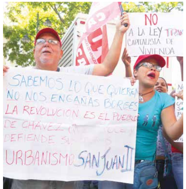
Movilización popular en defensa de la GMVV.

Con discursos demagogos están confiscando derechos alcanzados por la población. Ofrecen "títulos de propiedad" y están metiendo a 1 millón de familias en hipotecas, en deudas, a beneficio de intereses inmobiliarios que apoyan a la MUD.