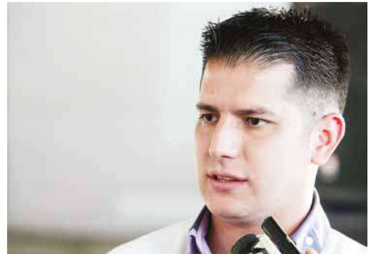
Ministro Mervin Maldonado.

En este sentido, desde esta trinchera de lucha “estamos con el firme propósito de seguir fortaleciendo la política