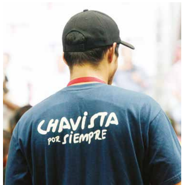
La juventud y su pasión patria.

signada por el Presidente del PSUV, “pero nos honra y nos llena de mayor compromiso. En Mérida venimos trabajando desde hace años desde el PSUV, y puedo destacar la capacidad y la fuerza que tienen nuestros 49 delegados del PSUV, 526 jefe de las Unidades de Batalla Bolívar-Chávez (UBCh), 151 jefes de Círculos de Lucha Popular (CLP) y los 5260 jefes de Patrullas, y los más de 52 mil 600 patrulleros. Con mucha humildad y con mucha modestia asumimos esta responsabilidad convocando a todo nuestros sectores”.