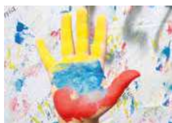
Colombia: La paz es posible, pero... /P 17