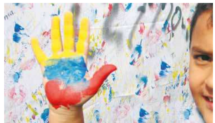
No habrá paz sin justicia social.

Es algo de pura lógica, pero también es un grito de atención al mundo para que se haga eco de la necesidad de presionar al Estado colombiano y a sus aparatos militares (generalmente los protectores de estos grupos ilegales armados) para que tomen cartas en el asunto. La paz es posible, sí. Pero si no se ponen en marcha medidas que aseguren el reparto de la riqueza para los más necesitados, que la riquísima burguesía colombiana ceda parte de lo que ha atesorado durante años a fuerza de maltrato y miles de muertos, y por último, que ningún colombiano pueda matar a otro por disentir con sus ideas, como hoy siguen haciendo los paracos, la paz se convertirá solamente en un espejismo.●