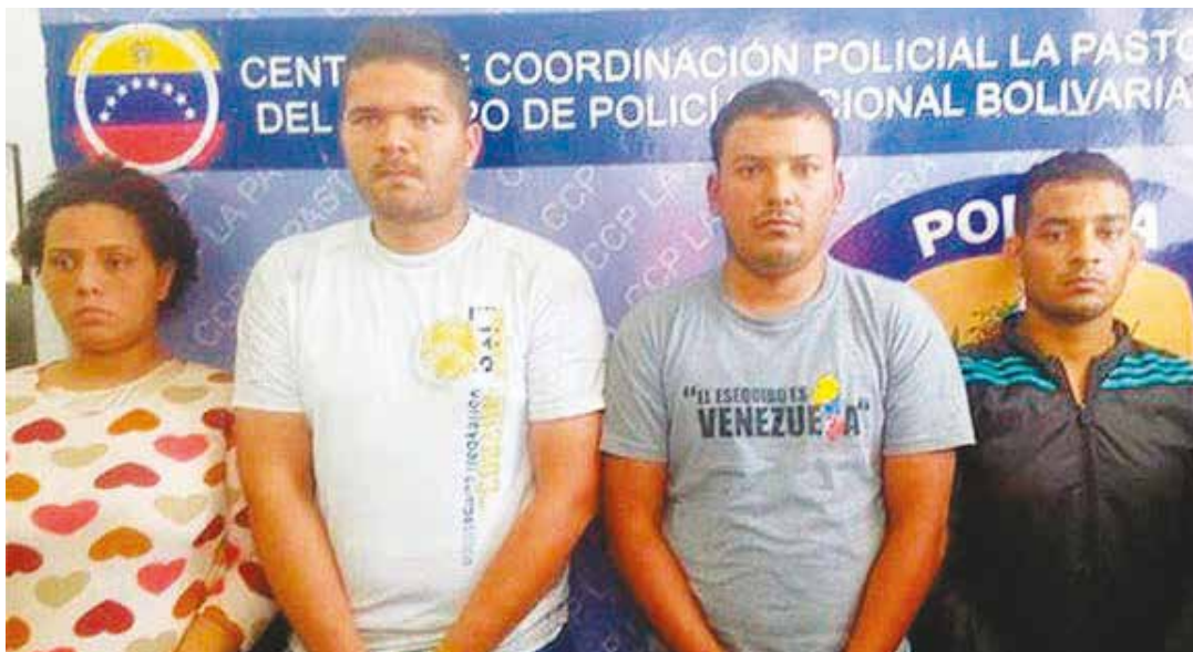
Directora de CVAL tenía 10 millones en efectivo en su casa.

Tales actos no solo constituyen delito, sino que también son decididamente contrarrevolucionarios y atentan contra la posibilidad de desarrollar un modelo productivo humanista que contribuyan con la liquidación del capitalismo y de la explotación.●