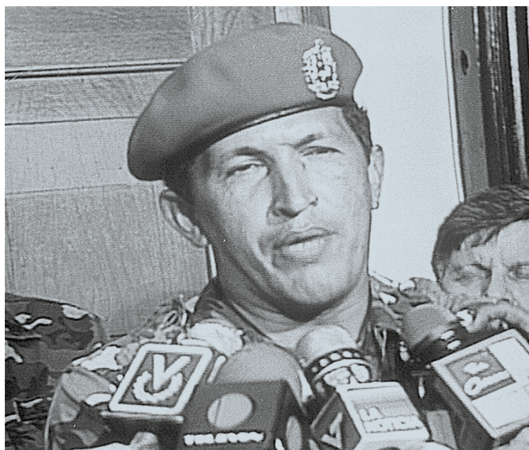
El Comandante Chávez se responsabilizó por el 4F.

Volvemos al 92. Hace rato que en la oficialidad media de las Fuerzas Armadas venezolanas se venía gestando un movimiento nacionalista inspirado en el ideal bolivariano de justicia e igualdad. El propio Hugo Chávez recordará que ese Caracazo fue el detonante de la rebelión de los Comacates (así