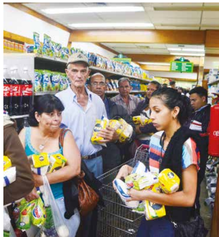
Polar es la expresión del rentismo.

En tercer lugar, el nieto del abogado Mendoza Fleury, mientras seguía jugando con los números, contó que su conglomerado de empresas es tan productivo y eficiente, que logró producir más de 14 litros de bebidas por cada divisa recibida. Confiando en sus cuentas habría que preguntarse en cuánto calcula Mendoza el valor de cada dólar, pues una botella de 2