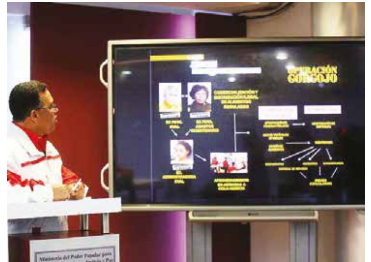
Red de corrupción en CVAL y Abastos Bicentenarios.

El dinero, según lo informado por el Ministerio Público inicialmente, correspondía al producto de las ventas de alimentos realizadas en Caracas como parte de los