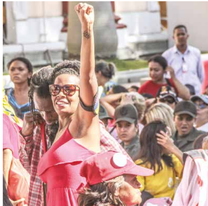
Maduro asimiló el feminismo chavista.

Rumbo al Congreso de la Patria, en todo el territorio