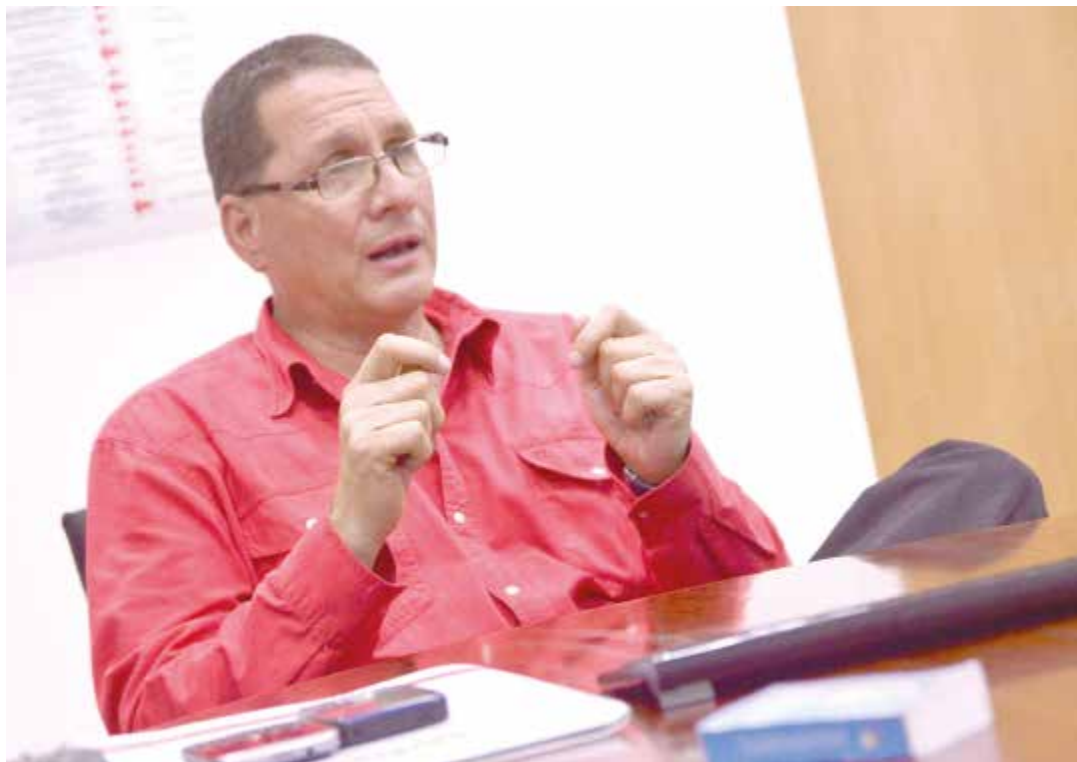
“Tenemos un proyecto de país coherente”.

Se plantea la construcción de un nuevo modelo partiendo de la necesaria estabilización de las variables económicas como primera tarea