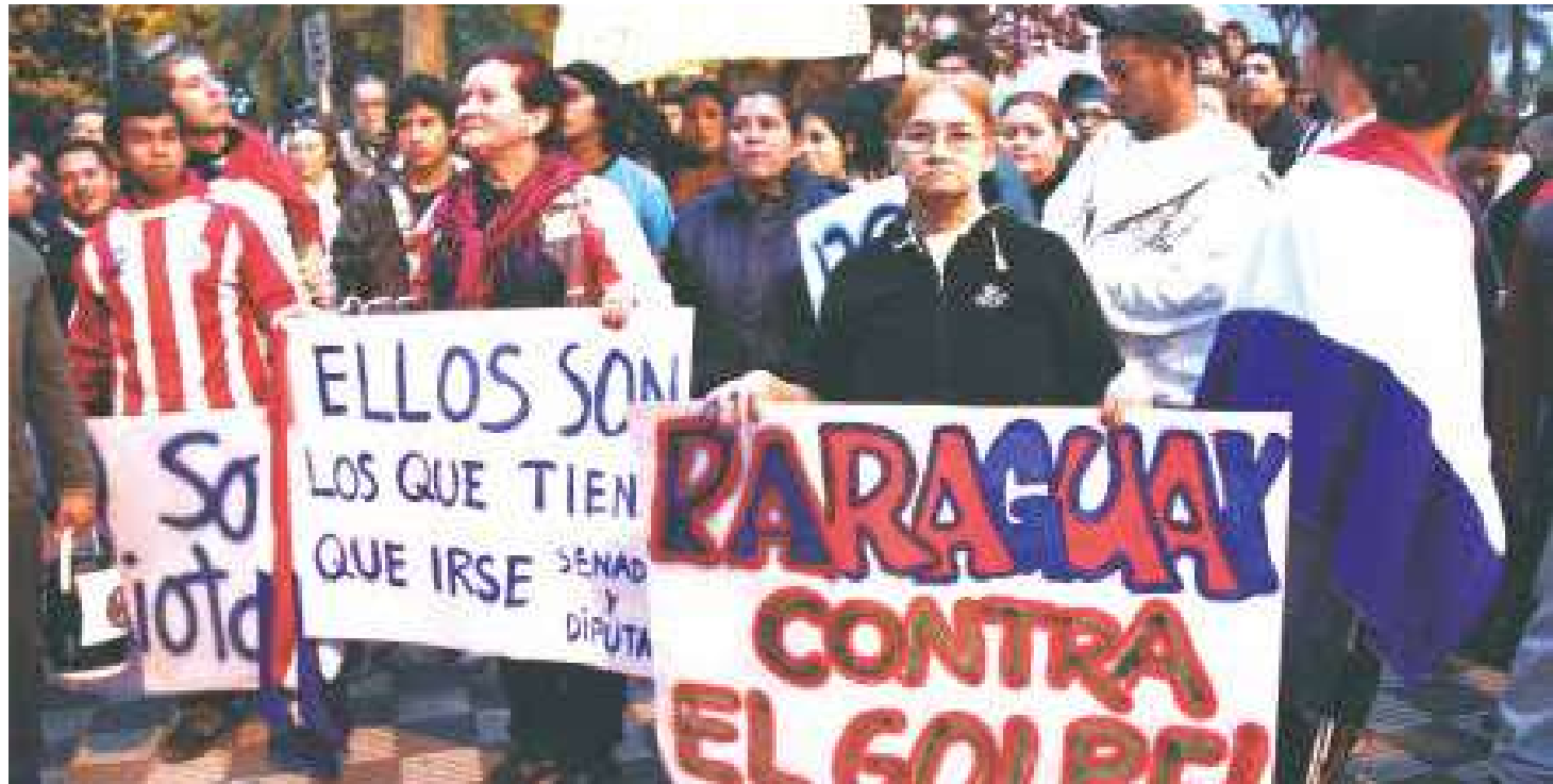
En Paraguay el pueblo rechazó el golpe parlamentario a Lugo.