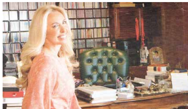
Una vida de lujos.

“ Su familia asume contratos de mantenimiento de la red nacional de carreteras”