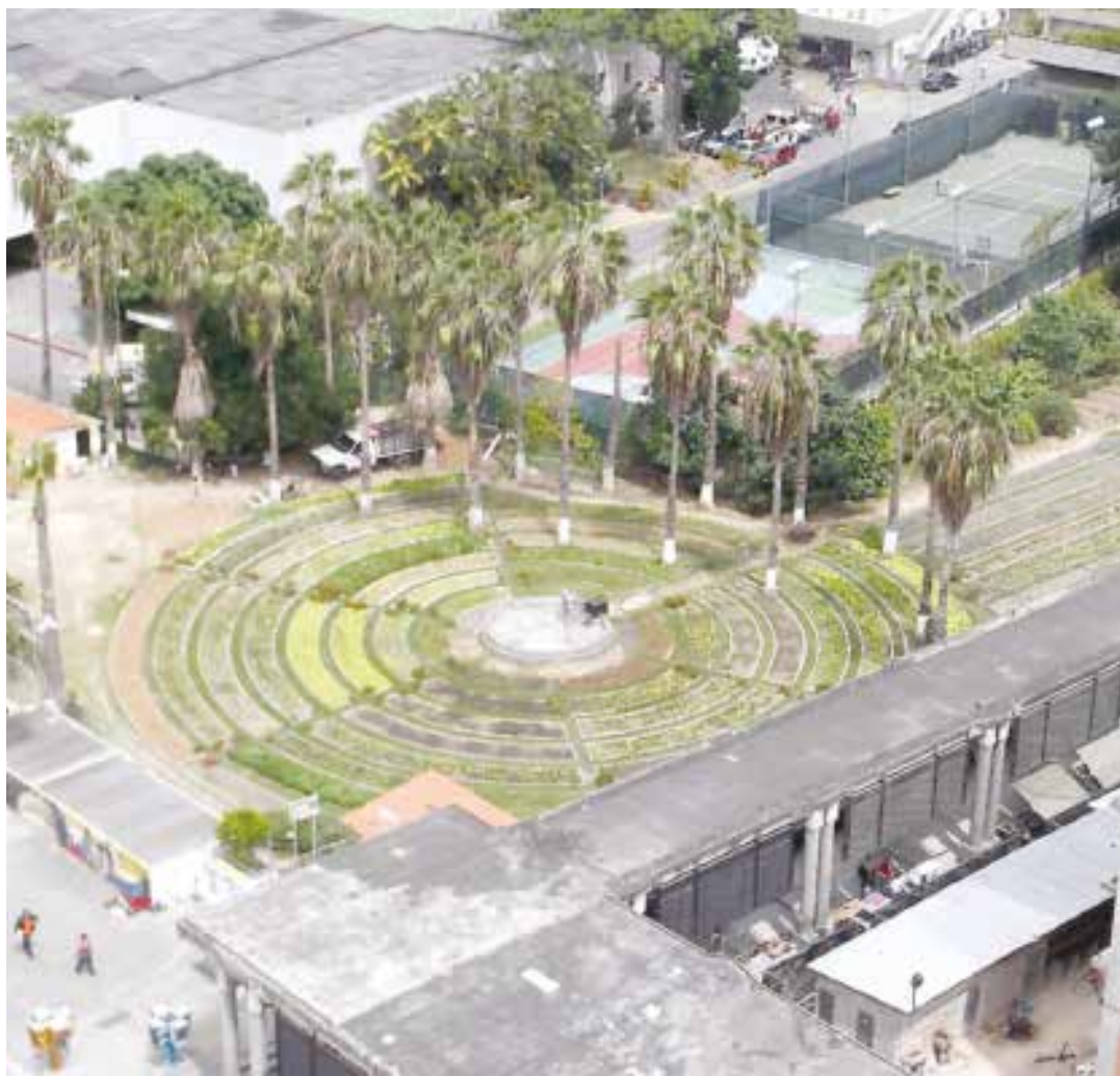
Bolívar 1 es un ejemplo de economía productiva.

"¿Estás harto de permitir que otros hagan ganancias con nuestras necesidades? Pues bien, tienes en el Bolívar 1 una oportunidad más que este tiempo te brinda para pasar del discurso a la práctica"