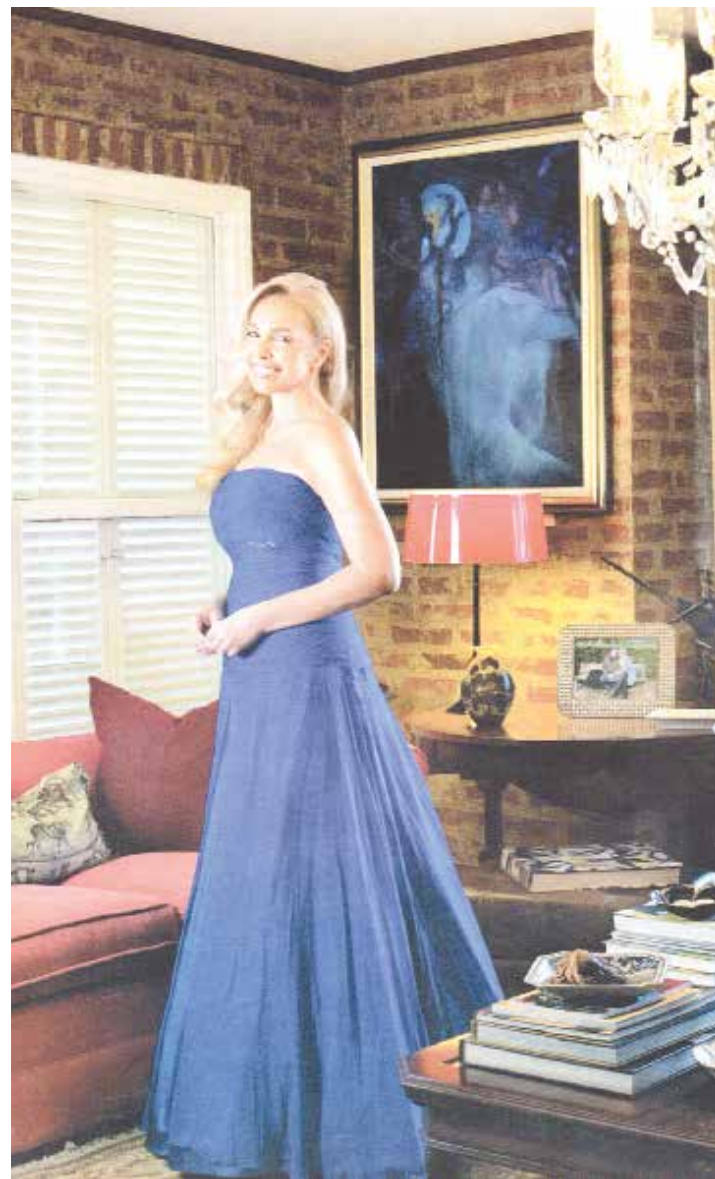
Tiene aspiraciones de Primera Dama.

Y mucho menos sueñe con que podrá andar codo a codo con el rey Felipe VI, como sí