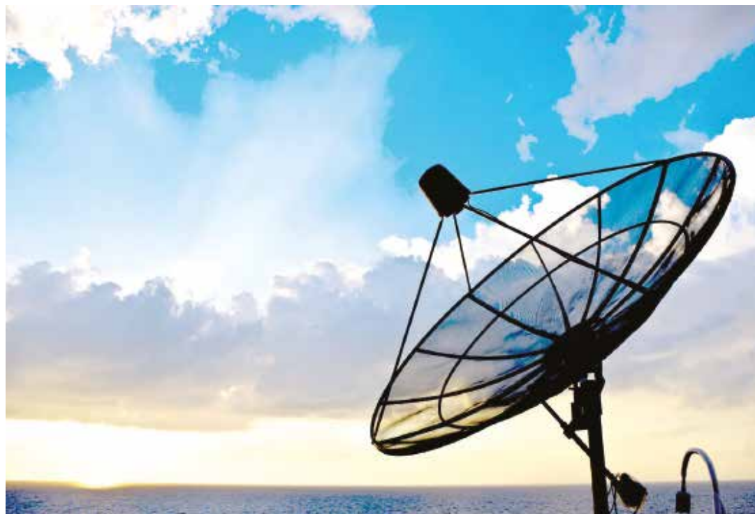
El Nacional y La Patilla destacan como punta de lanza en contra de las telecomunicaciones soberanas.