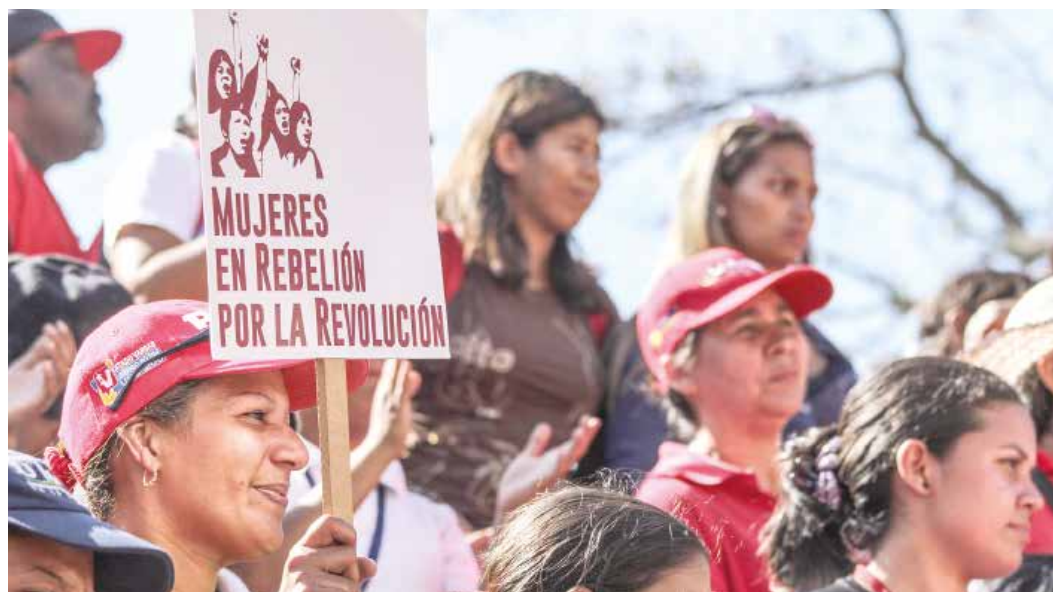
Mujeres en defensa de la Patria.

Allí participan movimientos cuyos gobiernos no integran ALBA-TCP, como el MST de Brasil, Patria Grande de Argentina, Congreso de los Pueblos y Marcha Patriótica de Colombia, el Comité de Unidad Campesina (CUC) de Guatemala, el Movimiento de Liberación Nacional de México, Conamuri de Paraguay, Frenadeso de Panamá y muchas otras organizaciones. Naturalmente, también participan movimientos de los Estados que sí hacen parte del ALBA-TCP. •