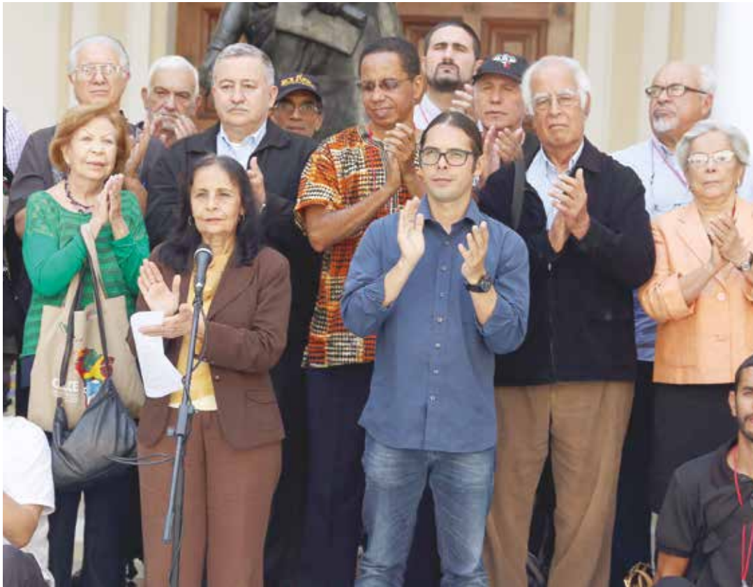
Convoca a una amplia movilización en defensa de la soberanía venezolana.