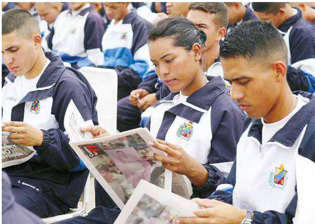
El águila del norte pretende devorar los recursos naturales de Venezuela

La condición básica de la preservación de la Revolución y de la transición de Venezuela hacia el socialismo es la defensa, la conservación, la expansión, la profundización y la consolidación del "bien máspreciado, esa frase es de Bolívar (...), que hemos reconquistado los venezolanos y venezolanas después de 200 años de batalla, la Independencia Nacional", (discurso en la concentración de apoyo al candidato de la Patria en Barquisimeto el 14/7/2012) y, en relación con eso, la