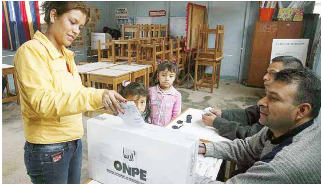
Por primera vez una mujer podría ser presidenta de Perú.