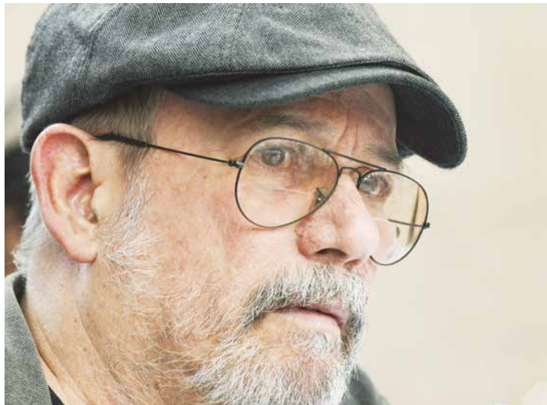
Cuba es un profundo universo musical

-Tremenda responsabilidad la que usted me otorga. Yo no lo veo tan así. Yo lo que veo es que todos somos hijos de