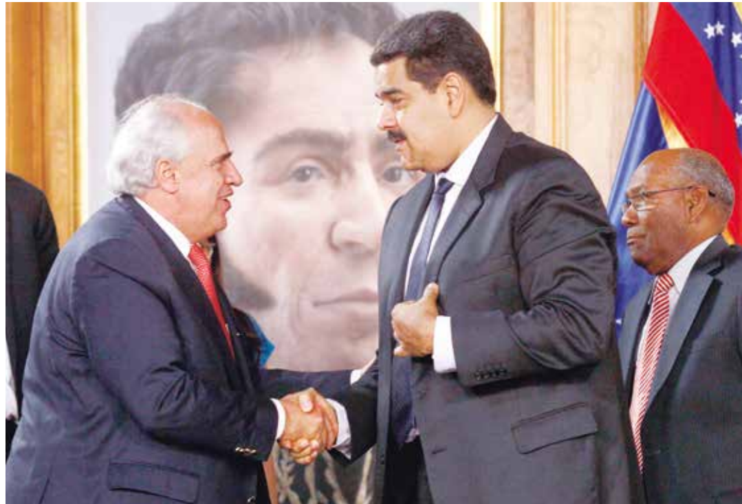
Estamos empeñados en construir una ruta hacia la verdad

Dicha comisión surge en respuesta a la llamada Ley de Amnistía y Reconciliación Nacional (mejor conocida como Ley de Amnesia Criminal) aprobada el pa-