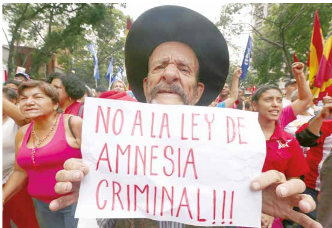
Supone una generalización que no excluye la violencia y el uso de las armas.

3 Viola los principios de legalidad y tipicidad. “El artículo 49, numeral 6, de la Constitución de la República Bolivariana de Venezuela establece que ninguna persona podrá ser sancionada por actos u omisiones que no estuvieren previstos como delitos, faltas o infracciones en leyes preexistentes, en virtud de lo cual, de dicha disposición constitucional nace el principio de tipicidad penal comprendido dentro del principio de legalidad, que delimita el poder punitivo del Estado”. Para la Sala, las normas contenidas en los artículos 2, 16 y 17 de la Ley de Amnistía, prevé numerosas normas penales en blanco que violan el principio de tipicidad de los delitos y de las penas y, por tanto, de las normas de gracia que puedan comprenderlos en virtud de la ausencia de concre-