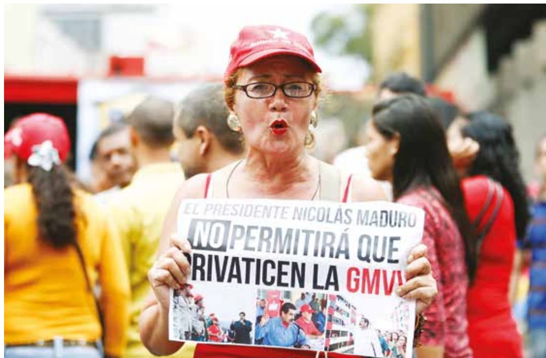
Venden la felicidad superflua del dinero fácil

Si toda vivienda de la Gran Misión se calculara a precios "de mercado", digamos una cifra modesta, muy modesta, tendría un valor más o menos de 4 millones 500 mil bolívares. Basándonos en un promedio entre viviendas sociales en caseríos, como apartamentos en privilegiados puntos de las ciudades. Hablando ahora de una "oferta" de un millón