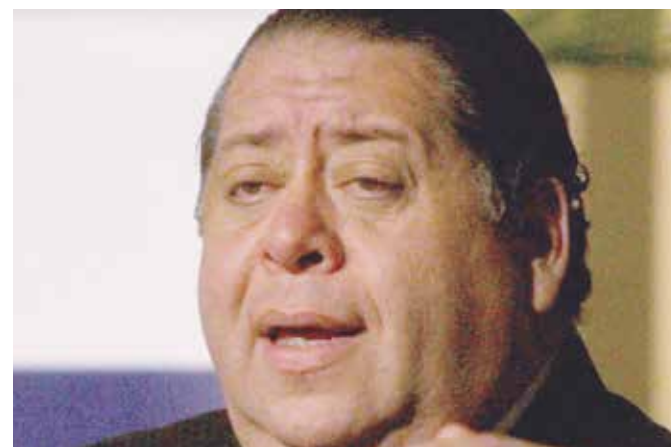
La AN tiene una mayoría al margen de la Constitución.

Es por ello que finalmente alertó acerca de cómo los operadores de esta estrategia desestabilizadora buscan banalizar las denuncias contra esta modalidad de guerra no convencional hechas no solo por el presidente Nicolás Maduro insistentemente, sino a demás por los presidentes Rafael Correa, Dilma Rousseff y Evo Morales, haciendo ver que éstas no tienen asidero en la realidad. •