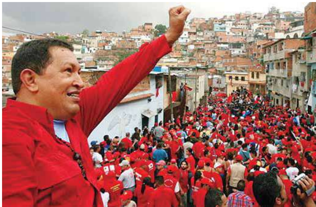
Chávez afianzó la defensa de los derechos de la Madre Tierra.

Con este trascendental lineamiento, Chávez afianzó la defensa de los derechos de la Madre Tierra y de todas las formas de vida en el territorio de Bolívar. Tras el duro golpe por la partida física del Líder de la Revolución, el Presidente Nicolás Maduro asumió el compromiso de dar cumplimiento a su legado; el Quinto Objetivo sería una de las tareas de la Misión Nevado, en conjunto con otras institu-