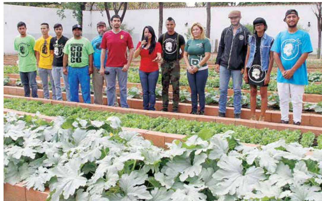
La mandataria impulsa la producción en la población

“El pueblo está dando respuestas, los jóvenes estamos saliendo al frente. Vamos a salir de esta guerra económica, desarrollando un músculo propio, nuestras propias capacidades para caminar y autoabastecernos”, subraya la ministra. •