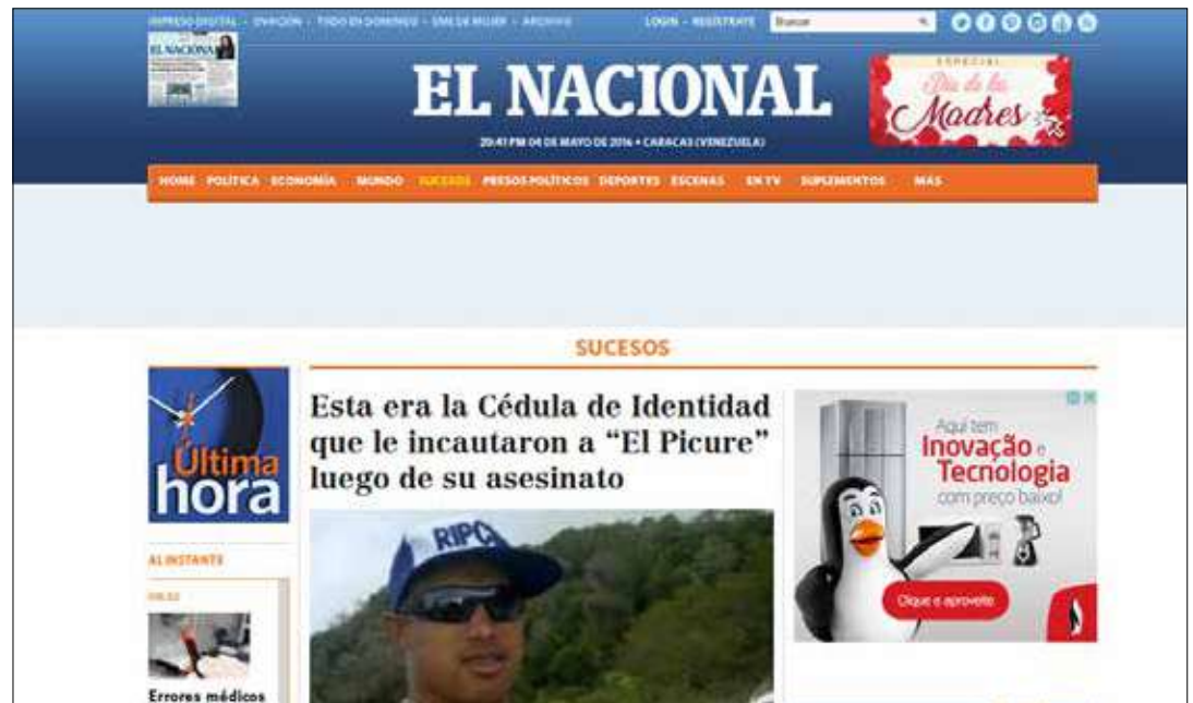
Captura de pantalla del diario El Nacional.

Basta un paseo por las redes a solo horas del operativo contra El Picure, quien fuera abatido en el sector Los Médanos de El Sombrero, en el estado Guárico, para saber cómo se mueven los hilos y confirmar por vía de confesión de partes las vinculaciones del fascismo criollo (anclado en sus medios), con el crimen organizado y delin-