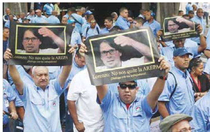
Trabajadores de Polar.

Sobre las recientes manifestaciones de trabajadores de Polar en defensa de la empresa, les recordó que para Polar "ellos son objetos que son usados de todas las maneras posibles, explotados, y una vez que rinden su tiempo útil son echados a la calle". •