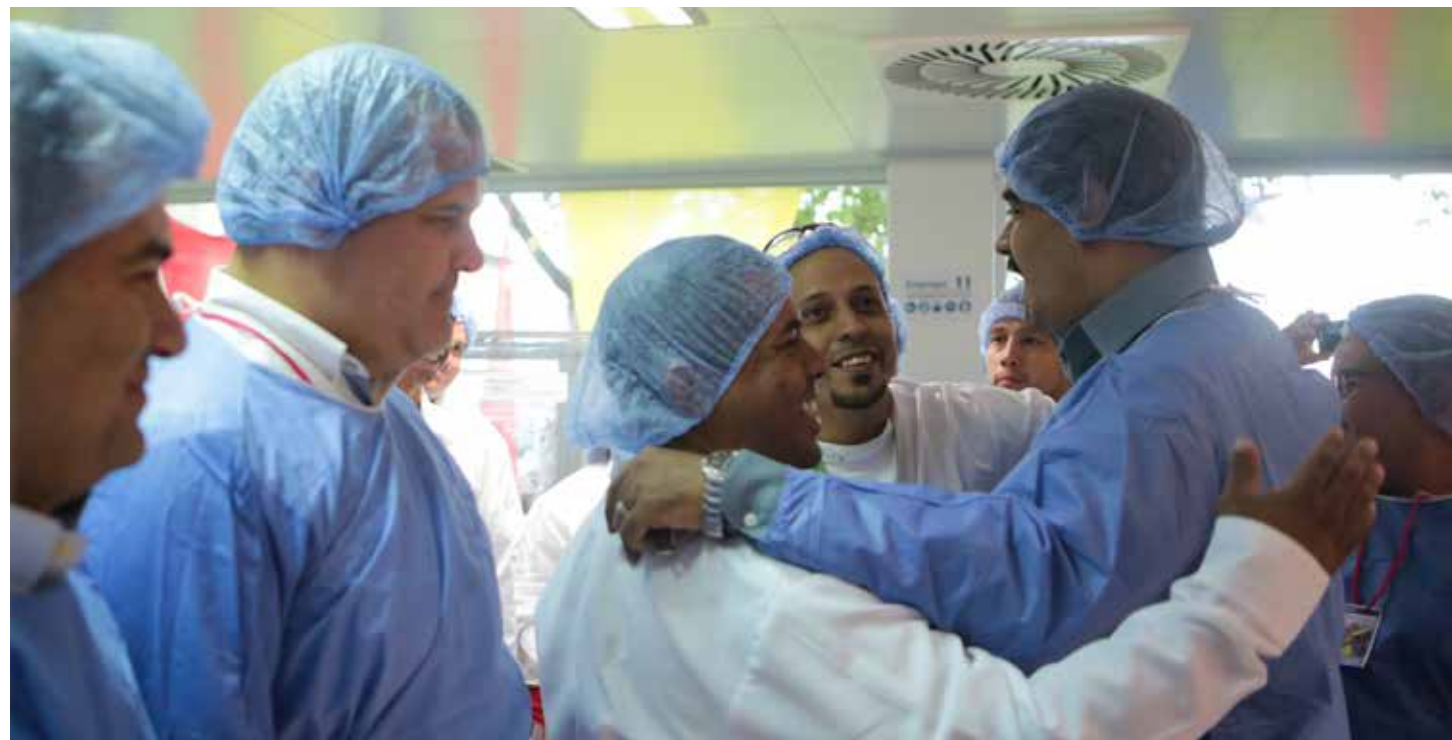
Maduro: Hay que estabilizar el sistema de precios.

“Venezuela tiene una industria farmacéutica de