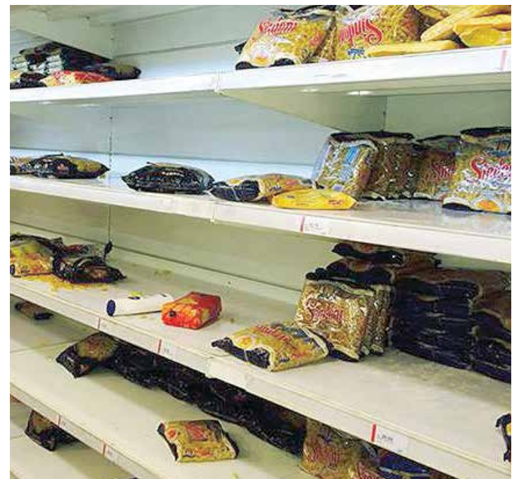
Desabastecimiento es parte del plan.

“ Se cumplen 71 años de esta gesta heroica y la Humanidad enfrenta de nuevo, el resurgimiento del nazifascismo como única alternativa del imperialismo para mantener su hegemonía. La desestructuración del Estado nación y el aniquilamiento de la democracia es la actual fórmula”