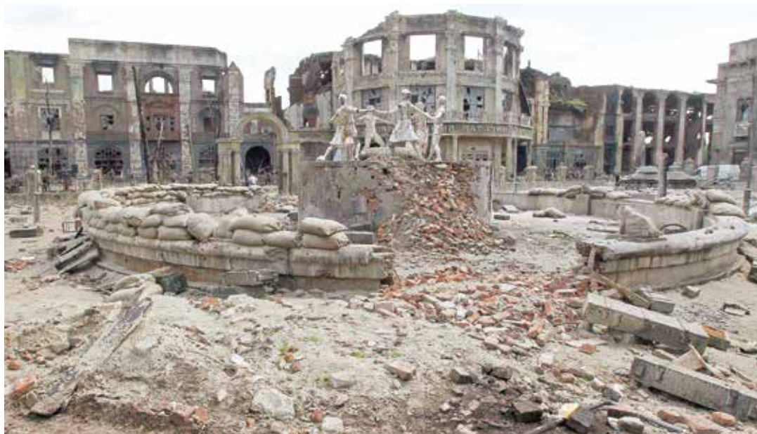
El socialismo libró al mundo de Hitler.

El mundo tal como lo conocemos está en vísperas de desaparecer