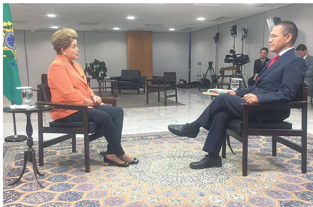
Ernesto Villegas en entrevista exclusiva para TeleSur con la presidenta Dilma Rousseff.

"Pidieron el recuento de los votos, lograron hacerlo y se demostró que habíamos ganado efectivamente las elec-