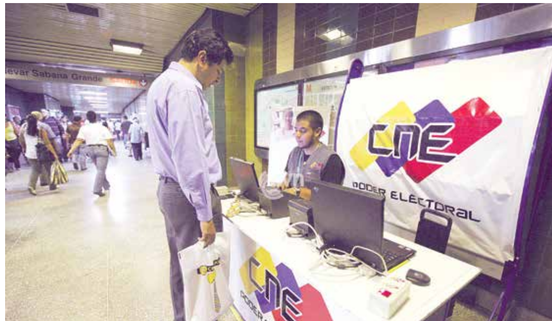
CNE verificará veracidad de las firmas.

Es decir, la opción de revocar a Maduro, abiertamente expuesta y apoyada por las organizaciones políticas y ciudadanos(as) que forman parte de y apoyan a la MUD, al producirse los actos de firmas, quedan sometidos a los mecanismos previstos en la norma. Sin decirle eso a sus seguidores, la MUD entiende