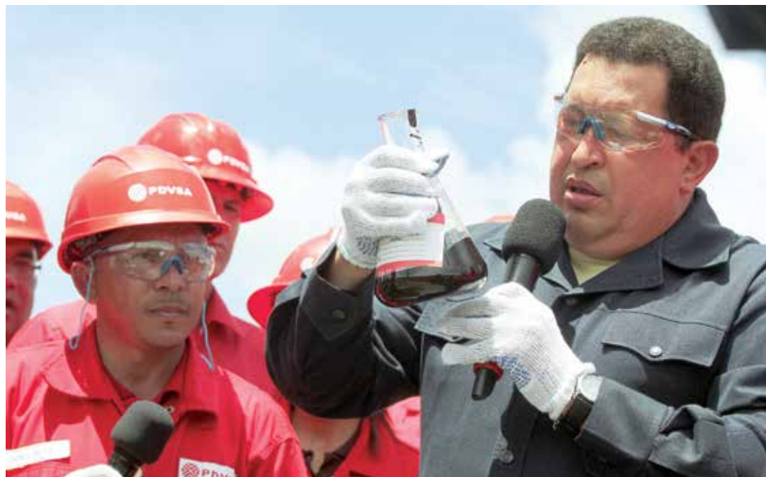
Chávez recuperó la renta petrolera y la puso al servicio del pueblo.

Asimismo la Ley de Hidrocarburos de 2001 ubicó la regalía en 30%, permitiendo obtener importantes recursos que posibilitaron la gigantesca inversión social de