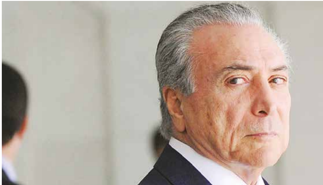
Temer reducirá significativamente el gasto social.

El actual gobierno interino de Michel Temer ya ha señalado en repetidas ocasiones que va a reducir significativamente los gastos sociales