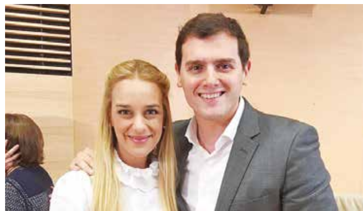
Rivera y Lilian Tintori.