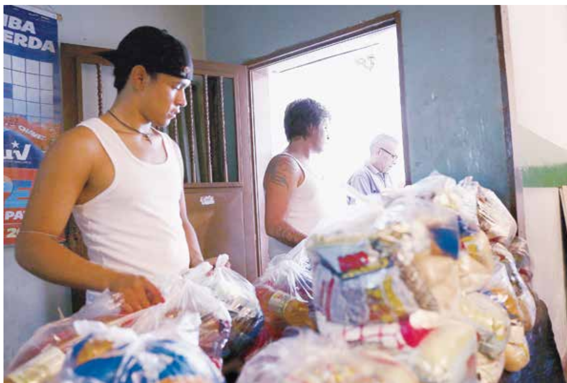
Cada semana miles de toneladas son distribuidas por los CLAP.

Luchando contra tres años de guerra económica, los CLAP no son la solución definitiva y total, pero son un factor de enorme peso como respuesta al desbarajuste. Su importancia se pierde de vista, dado que tiene un impacto más allá de su propósito económico, pues relanza la economía solidaria de la gente al servicio de la gente, revitaliza el tejido político chavista, supera la lógica de la economía caníbal de la guerra, impone la gobernanza estatal en favor de mecanismos participativos para la distribución y coloca al pueblo en un papel vital en la contraofensiva. •