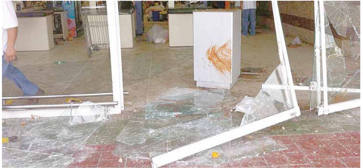
Pagan a bandas armadas para promover saqueos.