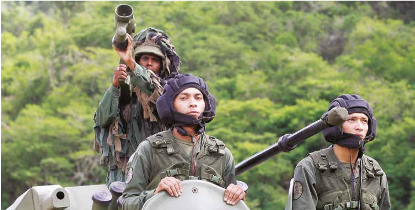
La guerra de todo el pueblo es fundamental como respuesta al imperialismo.

A propósito de los ejercicios militares: