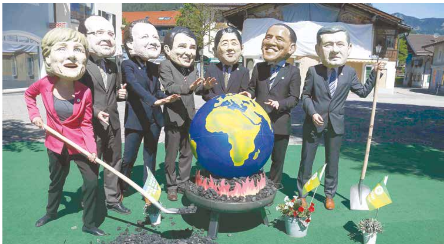
La derecha española quiere dar luz verde a la OTAN para intervenir en Venezuela.

intenta convencer a los españoles, que la tesis del socialismo fracasó y Carlos Marx ya está "muerto y enterrado". Pero la realidad objetiva en España es otra. Se parece más al contexto de la lucha de clases planteada por Marx. Más del 28 % de los españoles corre riesgo de pobreza o exclusión según el indicador europeo AROPE, que registra tanto el riesgo de pobreza como la carencia material severa y la baja intensidad en el empleo y lo cruza variables como la capacidad de maniobra de los hogares, su posibilidad de afrontar imprevistos o de calentar la casa en invierno, para estimar el volumen de ciudadanos que están en riesgo.