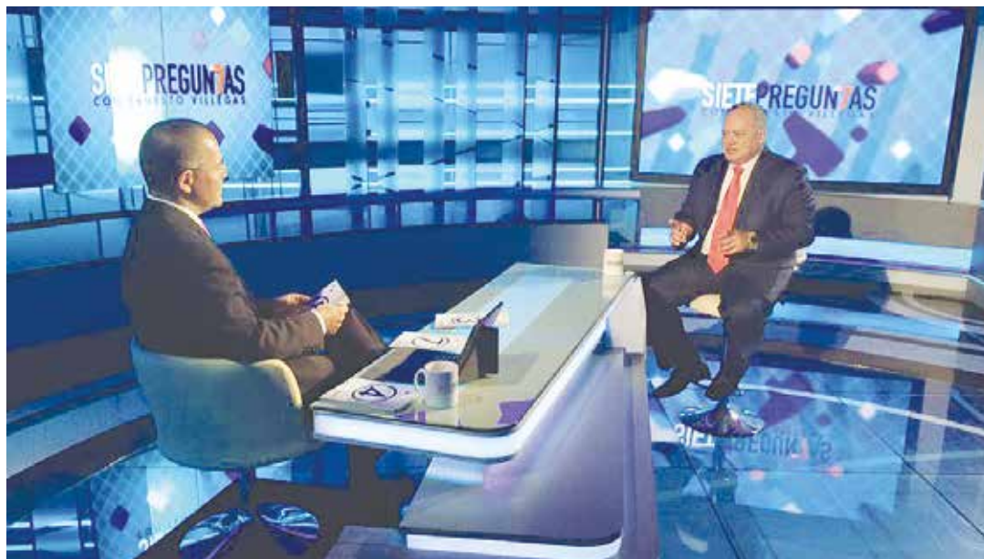
El periodista Ernesto Villegas entrevista al diputado Diosdado Cabello.