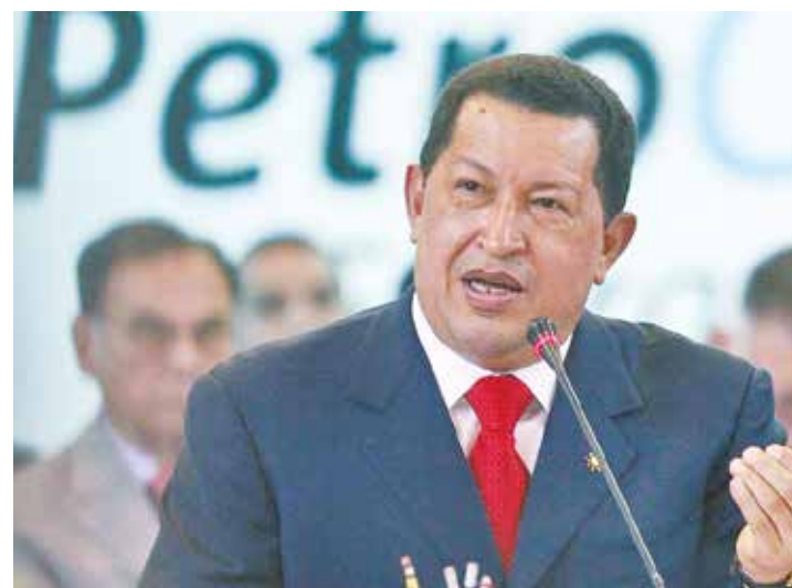
La alianza petrolera es parte del legado de Chávez.

Los precedentes son el "Acuerdo de San José" y el "Acuerdo de Caracas", pero con mejores condiciones, que oscilan entre un 5% y un 50% de financiamiento dependiendo del valor del hidrocarburo, con dos años de gracia y un plazo de pago de 25 años, siempre a precios internacionales; cuando el crudo supere los 40 dólares el interés sobre