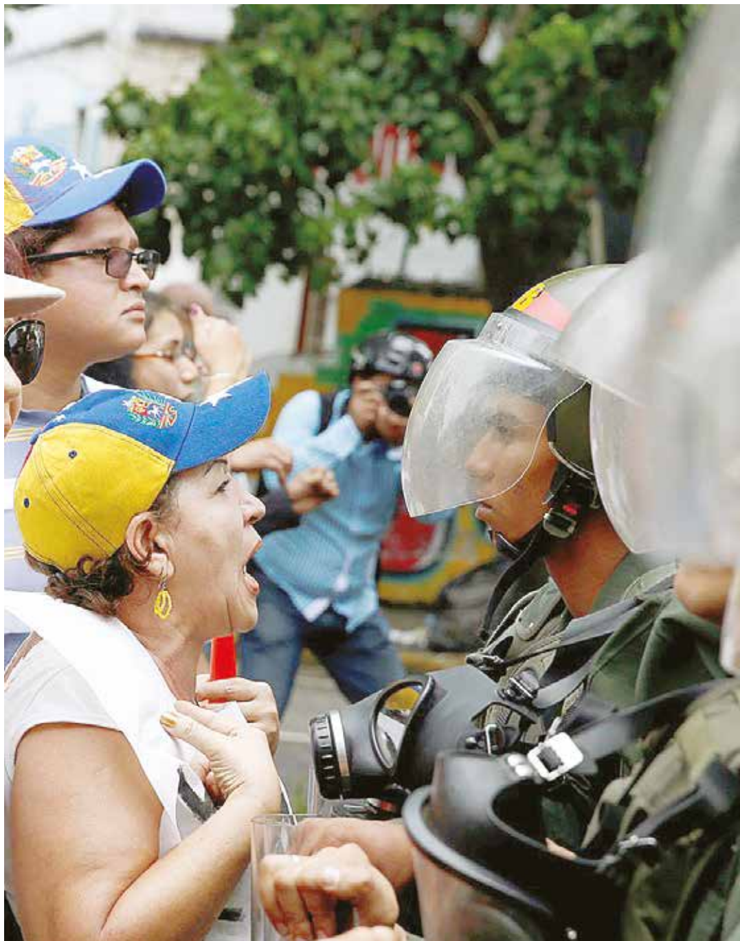
La MUD incrementa su agenda violenta para propiciar el golpe.

La economía es el epicentro de las grandes situaciones nacionales, en consecuencia, la construcción de condiciones elementales de estabilidad, "enfriarían" los eventos acelerados y precipitados propios de este momento de ebullición. Este primer semestre ha sido particularmente duro, pero las variables objetivas del hecho económico suponen nuevos vientos y condiciones más favorables especialmente para el tercer trimestre y finales de este año, lo que implica que el golpe ya adquiere la cualidad de "urgencia" para