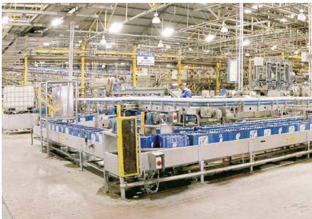
Polar reiniciará la producción de cerveza en julio.

Como se sabe, desde hace aproximadamente dos años las cotizaciones internacionales del petróleo –principal fuente de divisas de la economía venezolana– han venido reduciéndose al pasar desde los 100 dólares hasta un mínimo de 20 dólares el barril en enero de este año. En la actualidad los precios se han estabilizado en alrededor de 40 dólares el barril, una cifra todavía significativamente más baja a la del año 2014. "Frente a esta situación hemos estado analizando cómo hacer para activar de nuevo nuestra producción de cerveza y malta y finalmente hemos encontrado una solución temporal que nos permitirá producir hasta finales de 2016", dijo Empresas Polar en su comunicado. La suspensión de las actividades de las cuatro plantas productoras de cerveza del grupo, que representa 14% de la capacidad instalada de la corporación, está afectando de forma importante el esquema de negocios del grupo empresarial al significar la pérdida del 40% de las ventas totales en Venezuela. Además trae como consecuencia un problema laboral con un tercio de la nómina directa de Empresas Polar, que genera alrededor de 31 mil 500 empleos directos, debido a que la Ley del Trabajo especifica que la "suspensión temporal" de las actividades no puede mantenerse de manera indefinida.