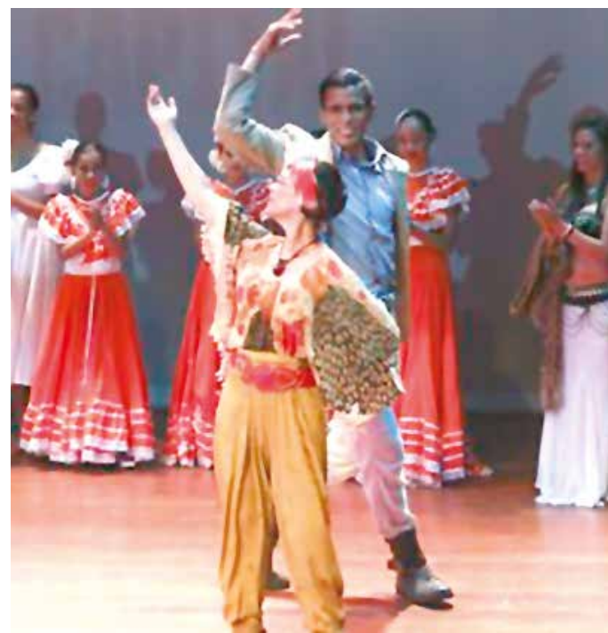
Se busca obtener un espacio permanente para la formación artística..

Las inscripciones inician el próximo lunes 6 de junio y finalizan el viernes 10 del mismo mes, en horario comprendido de 9am a 4pm. •