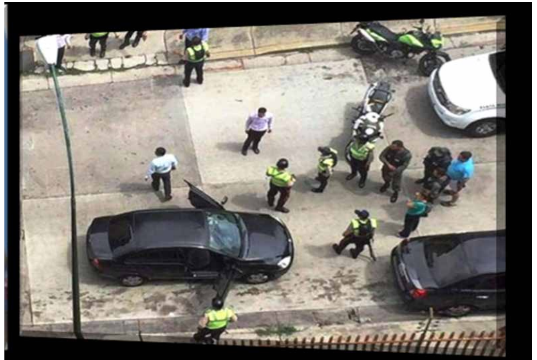
Sicarios de Polichacao asesinaron al Mayor General en la urbanización Santa Mónica.

El mayor general Félix Antonio Velásquez, en compañía de su nieta menor de edad, conducía su vehículo modelo Corsa, marca Chevrolet, por la calle Lisandro Alvarado de la urbanización Santa Mónica de Caracas, el pasado sábado 28 de mayo en horas de la mañana cuando fue in-