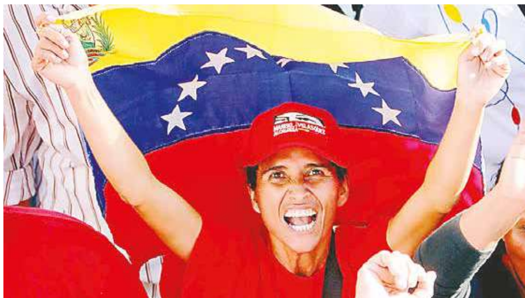
Hay que evitar que la Revolución Bolivariana sea destruida

No, en Venezuela todo será diferente a lo que últimamente hemos visto en Sudamérica. La población humilde, la que emergió como nunca con el proceso revolucionario sabe muy bien, que el nivel de revanchismo y odio de la oligarquía es de tal envergadura, que no habrá otra alternativa que defenderse con lo que se tenga a mano. Tiene mucha