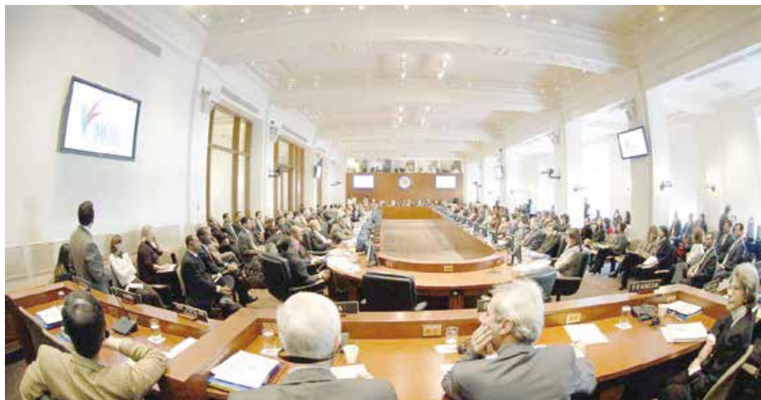
OEA debate caso Venezuela.

A los venezolanos (sin distinciones políticas) nos queda mucho por reflexionar, sobre los esfuerzos tremendos que ha realizado el presidente Maduro por la preservación de la paz en nuestro país. Es inestimable la cantidad de vidas que ha salvado, por su capacidad de lidiar en simultáneo frente a muchas amenazas, sucesivas y profundas. La agenda política chavista navega en aguas profundas y hasta en las charcas (como la OEA) para proteger la estabilidad nacional frente a todas las tormentas, frente a quienes intentan incansablemente destruirla. Encarrilar a la política a los monstruos del golpismo y el enfrentamiento no es cosa fácil, y debemos aceptar que se salvan vidas con ello. •