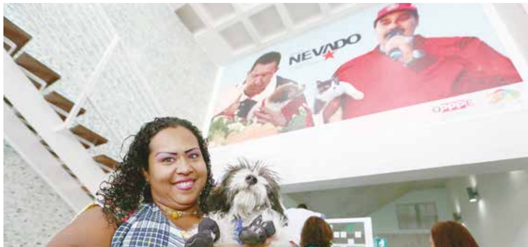
Venezuela se destaca en protección animal.

Éste ha sido un proceso difícil y paulatino, fruto de la movilización de la población animalista venezolana y gracias a la visión ecosocialista promovida por el Comandante Hugo Chávez Frías y por el actual Presi-