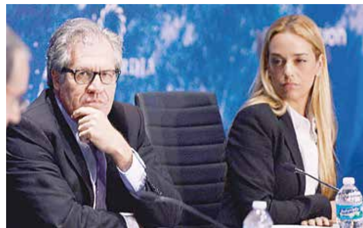
Almagro con Lilian Tintori.

“ A qué apuesta la oposición cuando por un lado pretenden patear los esfuerzos que está haciendo la comunidad internacional a través de Unasur, y al mismo tiempo legitima acciones como la de Almagro, que trasgrede los principios fundamentales de Venezuela como República”