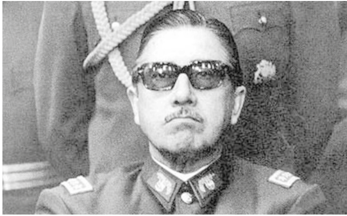
La represión en la era Pinochet no tuvo límites.

EE.UU busca imponer su panamericanismo en la región