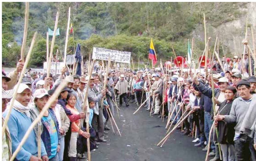
Campesinos colombianos alzan su voz contra el neoliberalismo.

En medio de una fuerte represión, desde el lunes 30 de mayo, miles de campesinos y campesinas se movilizan en Colombia