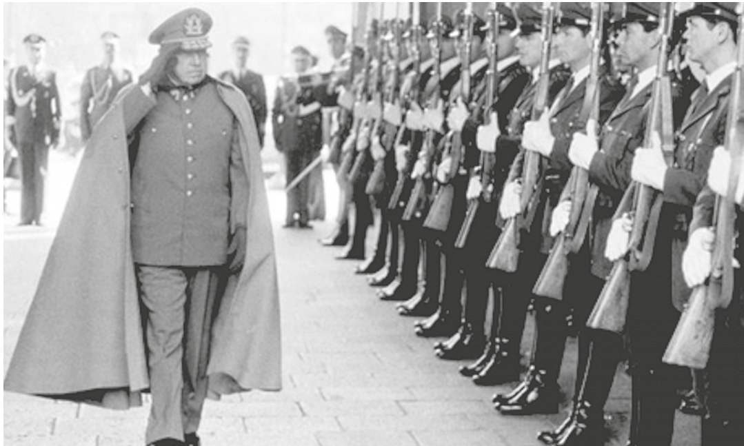
El dictador entregó a Chile a los intereses del imperio.