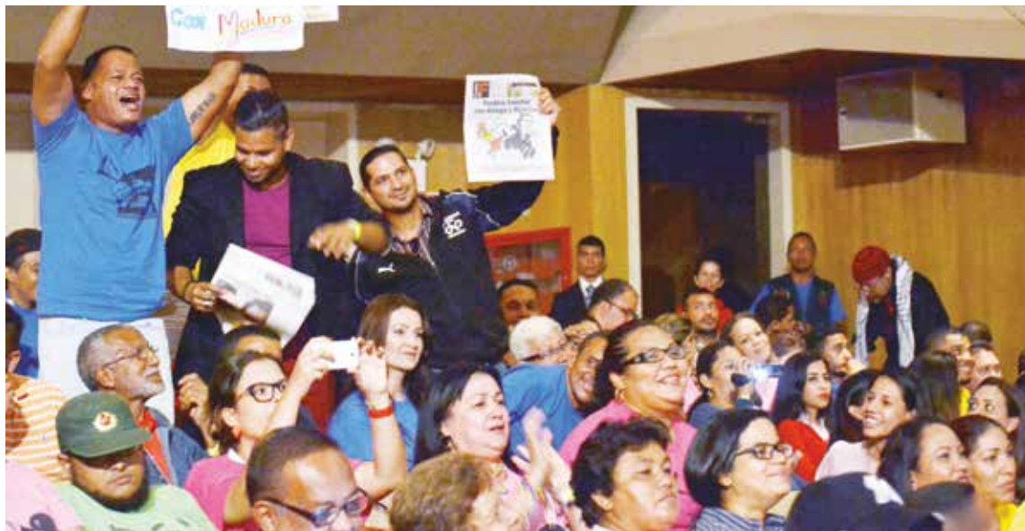
Comunicadores en apoyo a la Revolución.

“En los medios de comunicación no existía la programación. La burguesía se limitaba a tapar los conflictos, en criminalizarlos y en colocar en el centro de la comunicación masiva de los grandes medios solamente la farándula”, expresó el presidente. Acentuó que dicha postura de los medios, solo intentaba entretener y en muchos casos “embrutecer” al pueblo, además de banalizar la conciencia y los temas de interés. “Nosotros teníamos que bregar bien duro, si queríamos que algunas de nuestras reivindicaciones tuviera algún tipo de mención marginal, teníamos que buscar a los periodistas valientes”, dijo. •