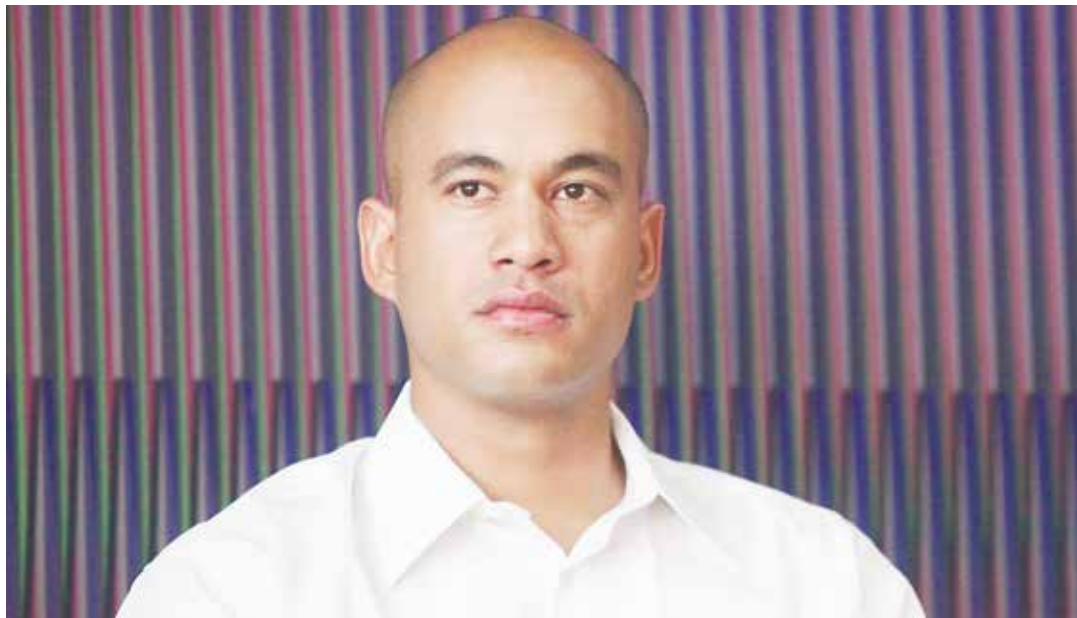
“La oposición llegó a la AN en base a mentiras”.

“Esta es una Asamblea Nacional apátrida, que trata paralizar todas las propuestas hechas por el Gobierno Bolivariano. Pero es tiempo de que esta moribunda AN rinda cuentas al país”, dijo Rodríguez a la vez que sentenció que “debemos ir a un