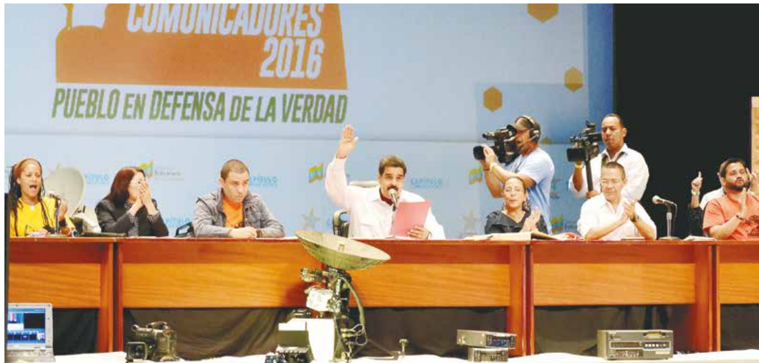
Presidente Maduro pidió emprender la Misión Robison digital.

El mandatario nacional manifestó que las herramientas necesarias para poner en marcha el contra ataque informativo, solo se han podido generar durante estos 17 años de Revolución Bolivariana, donde las nuevas generaciones cuentan con los mecanismos necesarios para su formación, a diferencia de los gobiernos de la IV República, que solo brindaba atención a las personas que tenían más poder adquisitivo, dejando excluido a la mayoría del pueblo.