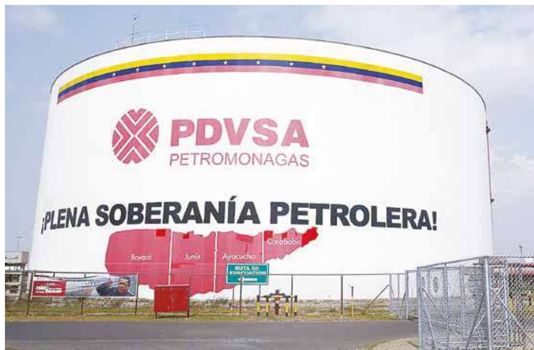
Venezuela posee las mayores reservas de petróleo del planeta.

Venezuela posee las mayores reservas de crudo del planeta