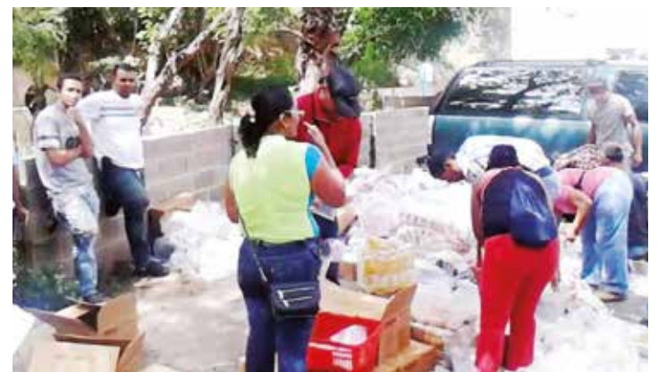
El pueblo se está organizando para enfrentar el bachequeo.

- Nosotros tenemos que garantizar la materia prima y ofrecer los conocimientos para generar la autosuficiencia de lo que necesitamos con productos, incluso de mayor calidad, para que no dependamos del exterior, o por lo menos lo menos posible, y eso da soberanía y seguridad alimentaria. Venimos de una generación boba que se acostumbró a no producir y vivir solo del petróleo y eso cambió con la caída de los precios del crudo, porque tirios y troyanos estamos viviendo la misma situación, por eso es que el CLAP tiene su buena pegada, porque estamos trabajando para salir de esta crisis y sí vamos a salir. •