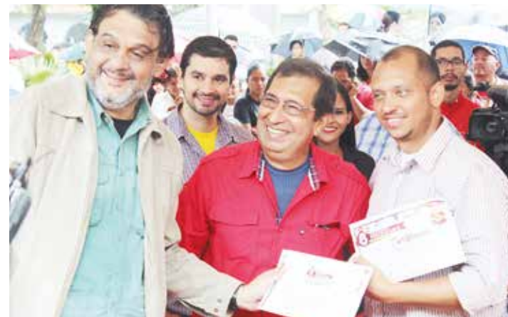
Los galardonados junto con el gobernador Adán Chávez.

“Cuando vamos en un autobús por ejemplo, y vemos que rápidamente el lector hojea el Cuatro F para ubicar Ezequiel, sentimos que estamos cumpliendo nuestra