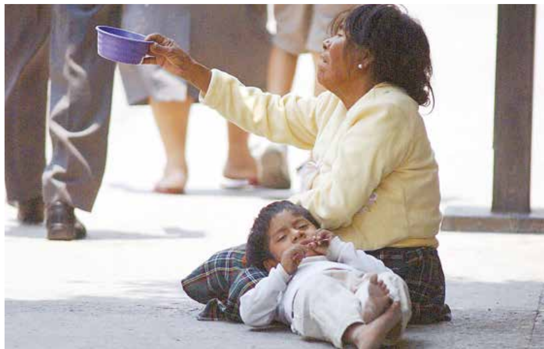
México se registran altos índices de pobreza.

Venezuela es ahora otro país cualquiera de América Latina y darnos cuenta pega en la madre