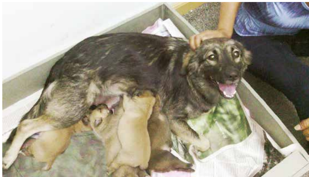
Ceniza es un ejemplo de amor.

Ceniza apareció a los alrededores del Minci a finales de enero de este año; escoltaba hasta el Metro a los com-