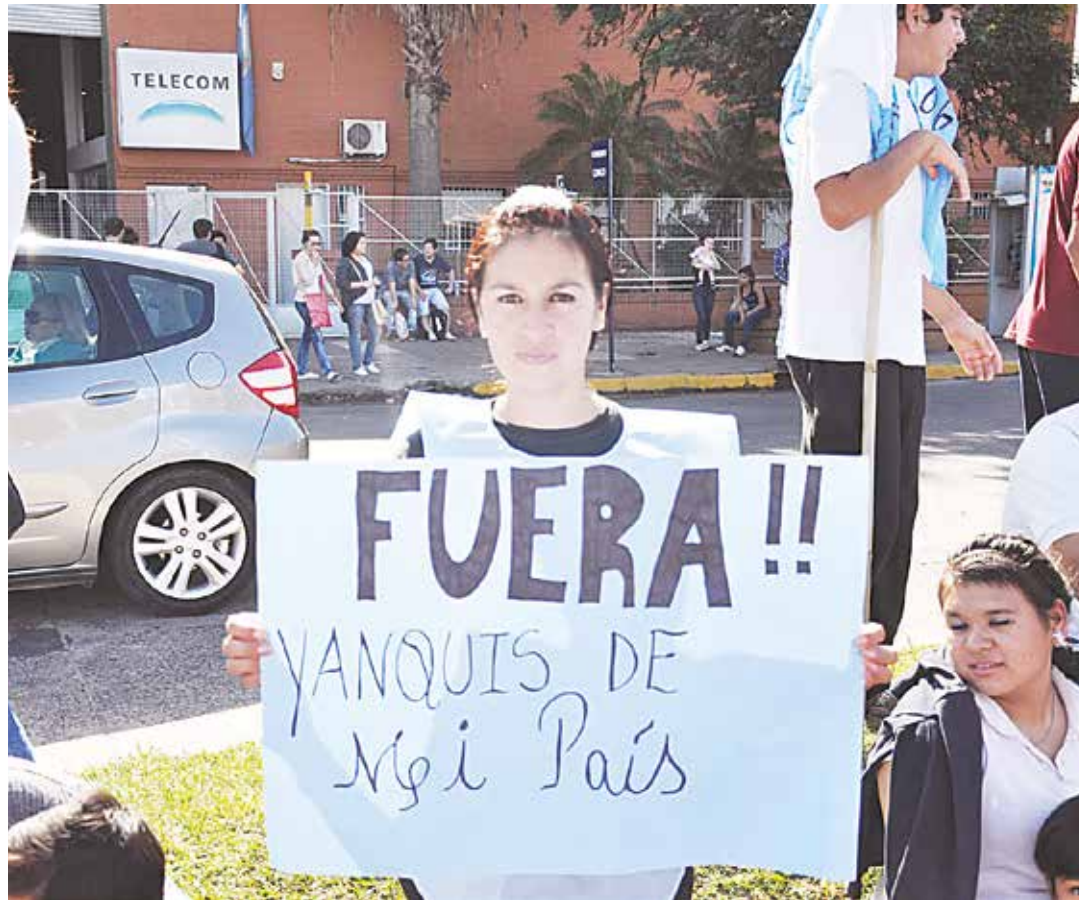
El pueblo argentino se opone a la injerencia gringa.

En ese marco, todo indica que lo que en su momento intentó efectivizar el ex gobernador kirchnerista del Chaco, Jorge Capitanich, en las instalaciones del aeropuerto de esa provincia y que fue paralizado producto de la movilización popular y el buen tino de algunos funcionarios de la Cancillería local, ahora cobra cuerpo para realizarlo en dos zonas estratégicas a nivel geopolítico y que afectarían profundamente a la soberanía nacional. Decir Misiones es hablar de la Triple Frontera y del Acuífero Guaraní, una de las fuentes de agua más importantes del mundo, y también un territorio que, desde Ronald Reagan en adelante, siempre despertó apetencias en Washington. Tanto que en una oportunidad, Georges Bush hijo, estuvo a punto de colocarlo como “objetivo