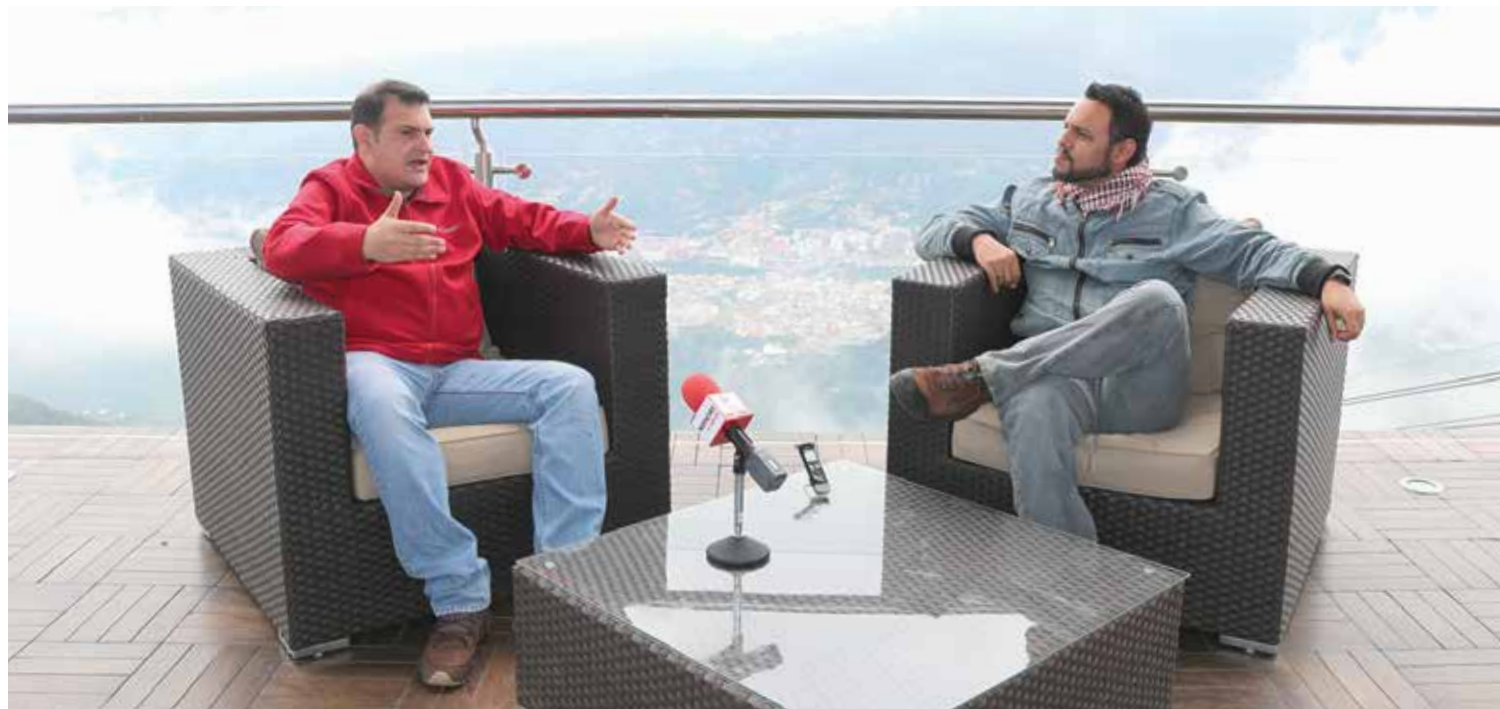
En Mérida se busca perturbar la tranquilidad del estado andino.

Al finalizar de la entrevista, una cabina nos esperaba para dejar atrás las alturas, el techo de Venezuela y sus picos, adonde llega el teleférico. Despacio, nos acercábamos a una impetuosa y bella ciudad que se hacía cada vez más grande. La hermosa Mérida, la gentil y ansiada de paz Mérida, parecía un retrato de un pintor ingenuo, un contraste de colores vivos en medio del verde intenso de parajes y montañas. •