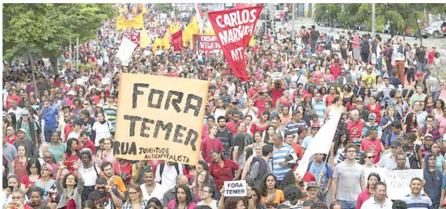
Aumenta rechazo a Temer.