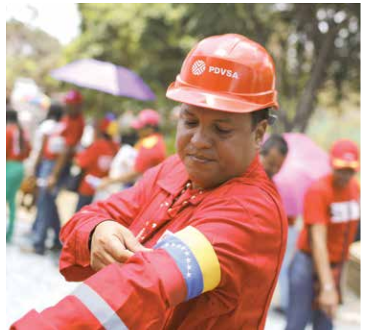
Venezuela posee las reservas de crudo más grandes del mundo.