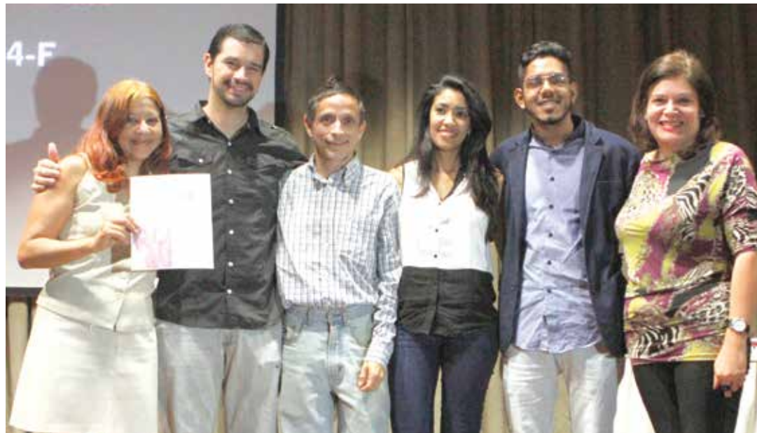
Integrantes del equipo de redacción de Cuatro F.

Un homenaje para aquellos que ejercen un periodismo ético