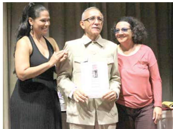
El jurado entrega premios por el periodismo ético.

Naoza además colaboró en las revistas El gallo pelón, Cascabel, Élite, Momento y Semana, y escribió los libros Obras incompletas y Las artes y los oficios. •