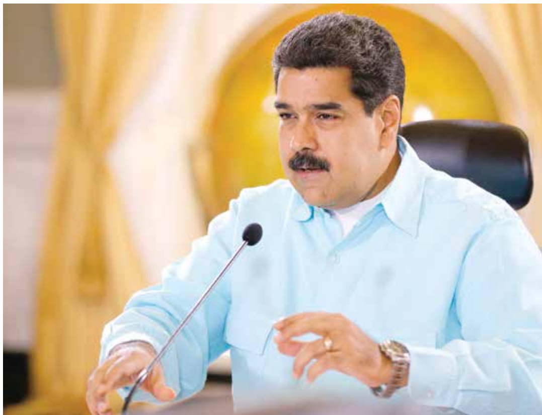
Maduro: Hay que recuperar la Asamblea Nacional.

El dirigente del Partido Socialista Unido de Venezuela (PSUV), Jorge Rodríguez, comunicó este viernes 08 de julio que la comisión designada por el Gobierno para el diálogo con la oposición saluda con agrado la disposición de la dirigencia de este sector a incorporarse al proceso respetando la agenda planteada semanas atrás con el acompañamiento de los tres expresidentes (José Rodríguez Zapatero, España; Leonel Fernández, República Dominicana; y Martín Torrijos, Panamá) y de la Unión de Naciones Suramericanas (Unasur).