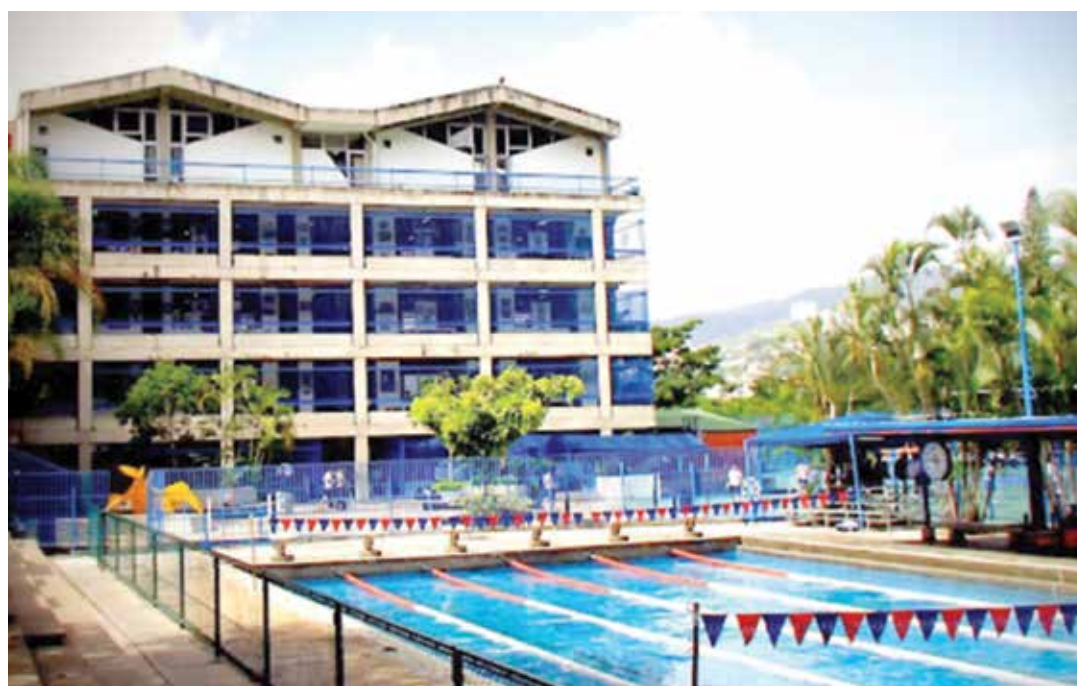
Colegio Emil Friedman.

Además pueden estar seguros que no serán 45 días, como establece la norma del proceso penal, ni 60. En el mejor de los casos serán 90 días, pues deben recordar que el 12 de agosto comienzan las vacaciones judiciales que se extenderían hasta el 18 de septiembre. Será entonces los primeros días de octubre cuando el entrenador podrá volver al tribunal para saber si el juez acoge la probable acusación fiscal o su defensa (formada por 6 ó 7 abogados con atuendo de serie de televisión gringa) pagada por los nada desconocidos accionistas del colegio.