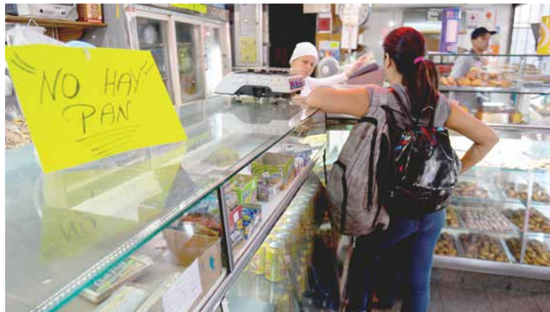
Las panaderías son el nuevo frente de la guerra económica.

La lucha contra el hambre es la tarea fundamental de todos los trabajadores conscientes