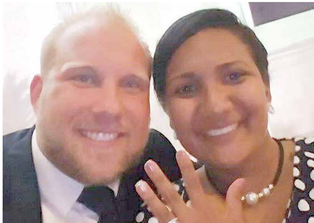
Está detenido en la sede del Sebin.

Las armas fueron localizadas en el apartamento de la novia del estadounidense, la joven Thamara Belén Caleño Candelo, originaria de Ecuador (según indica en su página de Facebook) y nacionalizada venezolana, quien también fue detenida tras la localización de las armas,