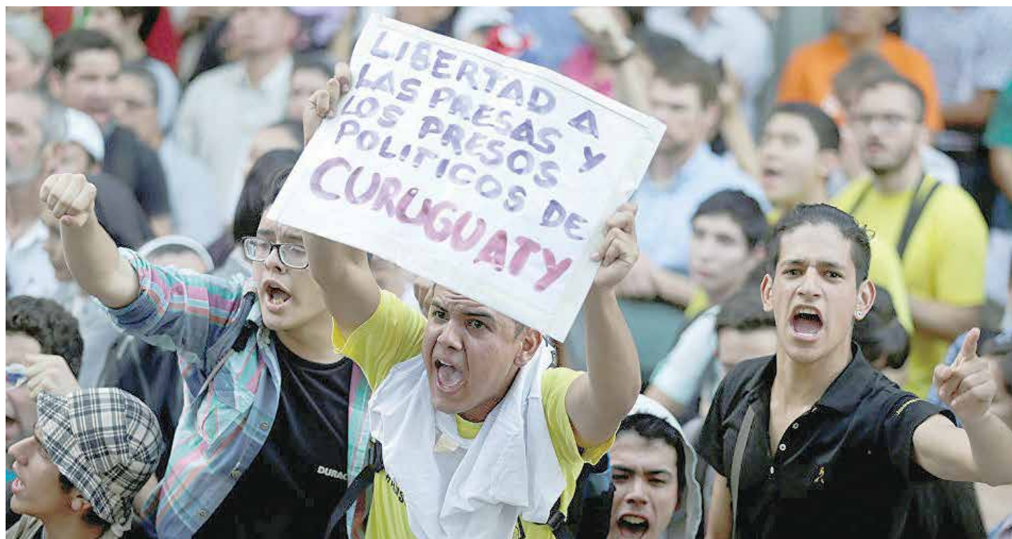
Movilizaciones populares en Paraguay.

El lunes 11 de julio se condenó a 8 campesinos y 3 campesinas enjuiciados tras la masacre de Curuguay. Familiares, organizaciones campesinas y miembros de la Iglesia denuncian que el juicio es una farsa