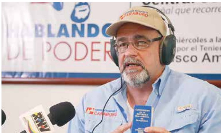
Francisco Ameliach

Además, señaló que desde Carabobo el ministro del Poder Popular para la Defensa, General en Jefe Vladimir Padrino López cuenta con todo el respaldo ante esta nueva responsabilidad al mando del Comando para el Abastecimiento Soberano e hizo un llamado a la unión cívico militar para garantizar la victoria, destacando que todos los órganos del Estado, relacionados con