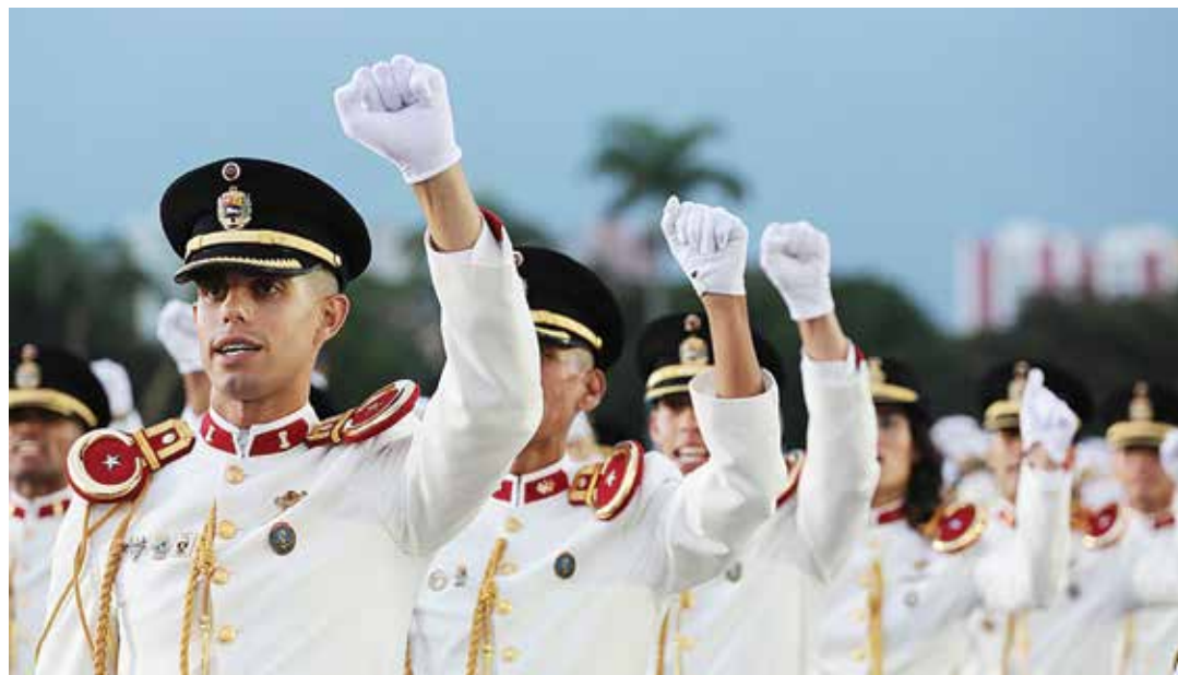
La FANB es expresión del pueblo en armas

Considera que en Venezuela se ejecutan los manuales del perfecto golpe de estado, en donde se explican las estrategias para derrocar gobiernos sin usar las fuerzas militares, que sería su última carta, por eso se recurren a operaciones psico-