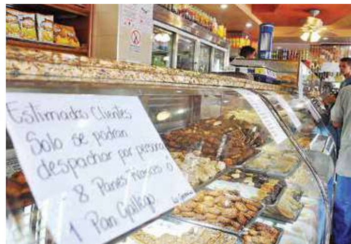
No hay pan canilla, pero sí dulces.

Sabemos que los dueños del pan se instalaron hace años en el país. Rodríguez lo conocía muy bien: “El pueblo ve llegar, de mar afuera, un refuerzo de enemigos que inundan el país y le toman las mejores posiciones”. ¡Organicémonos, combatamos y saquemos a los mercaderes del pan! •