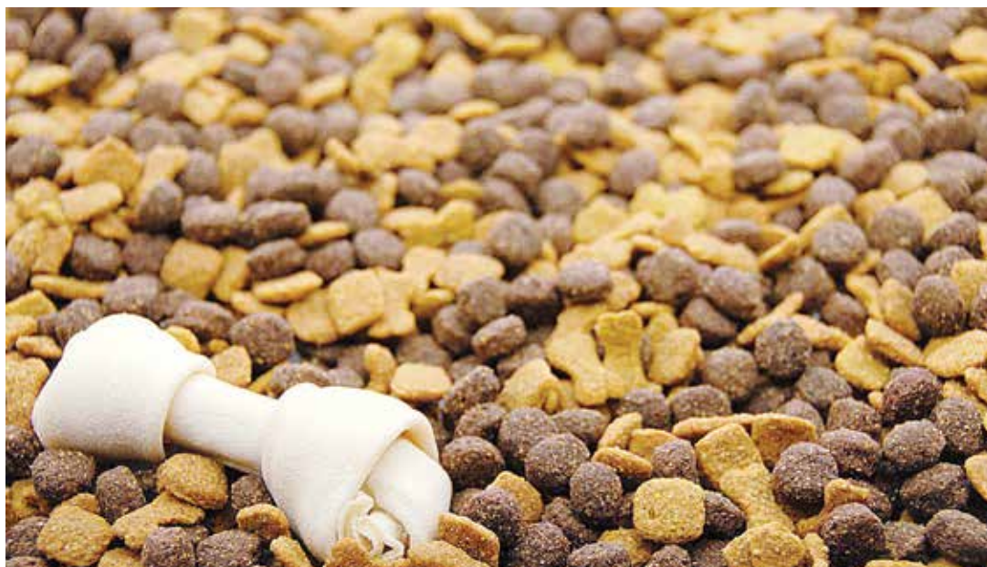
Los alimentos procesados para animales tienen precios especulativos.

Progresivamente y a costos solidarios, en la tienda Tinjacá se podrán encontrar alimentos artesanales, alternativos y caseros para perros, gatos, pollos, conejos, peces y aves. Además se ofrecerán medica-