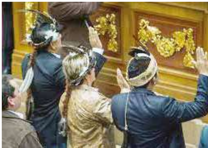
Pretenden desconocer a los poderes públicos.

A partir de aquella desmesura de Allup de "los seis meses de gobierno de Maduro", las alarmas bolivarianas se encendieron, pues cumplir con ese ofrecimiento solo era posible con un golpe de estado clásico,