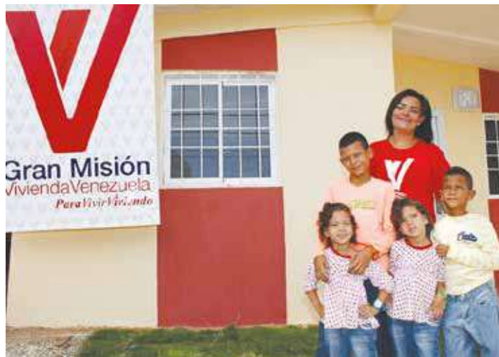
La Gran Misión Vivienda Venezuela es un ejemplo.

¿Sabían que según cifras de la FAO en Venezuela hay menos mal nutridos, es decir gente que pasa hambre, que