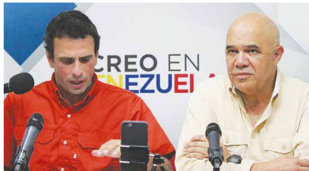
Se les cierran las salidas y apelan a la violencia.

De lo contrario, se activaría una operación de intervención militar, seguramente precedida de otras de falsa bandera y desarrollo simultáneo, como serían un supuesto y mediático alzamiento de alguna unidad militar venezolana -al estilo "Plaza Verde de Libia", con actores contratados personificando a altos mandos incluidos y filmación fuera de Venezuela- contra el Gobierno del presidente Maduro, acciones "masivas" de violencia guarimbera y supuestos ataques del "chavismo violento" -paramilitares disfrazados como tales- contra una "pacífica" y "democrática" oposición. •