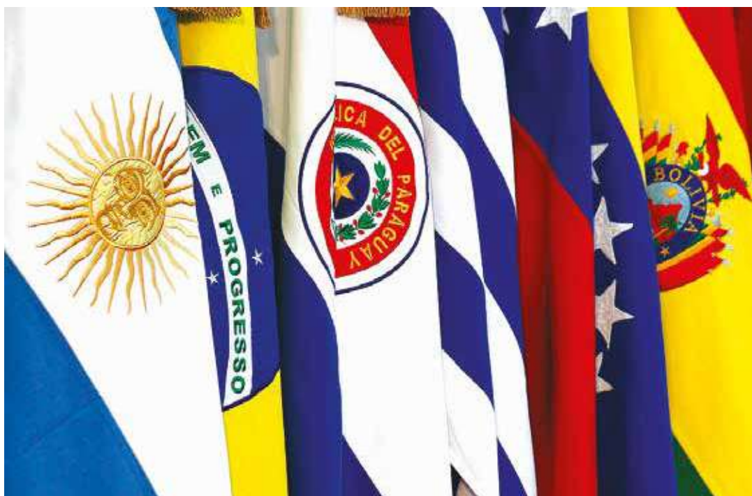
Se busca el desmantelamiento de la estrategia integracionista.

Mercosur constituye un mercado de aproximadamente unos 300 millones de consumidores si contamos las poblaciones de sus países miembros, un potencial mercado que hasta ahora se había manejado dentro de los esquemas de mercado común que beneficiaban con tasas arancelarias preferenciales a los productos de los países miembros frente a terceros. Con la llegada de los gobiernos de izquierda, el Mercosur necesaria y concienzudamente comenzó a incorporar criterios sociales dentro de sus políticas comerciales, tales como la creación de un fondo para ayudas sociales, la creación de una universidad para pensar la integración regional, no solo como propuesta