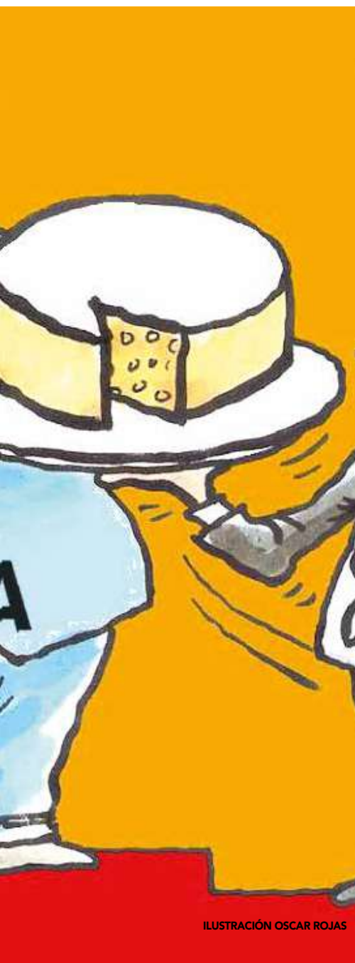
ILUSTRACIÓN OSCAR ROJAS

háganlo desde una empresa privada de sus casas, no desde