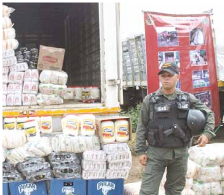
El bachequeo es una expresión de esta guerra no convencional.