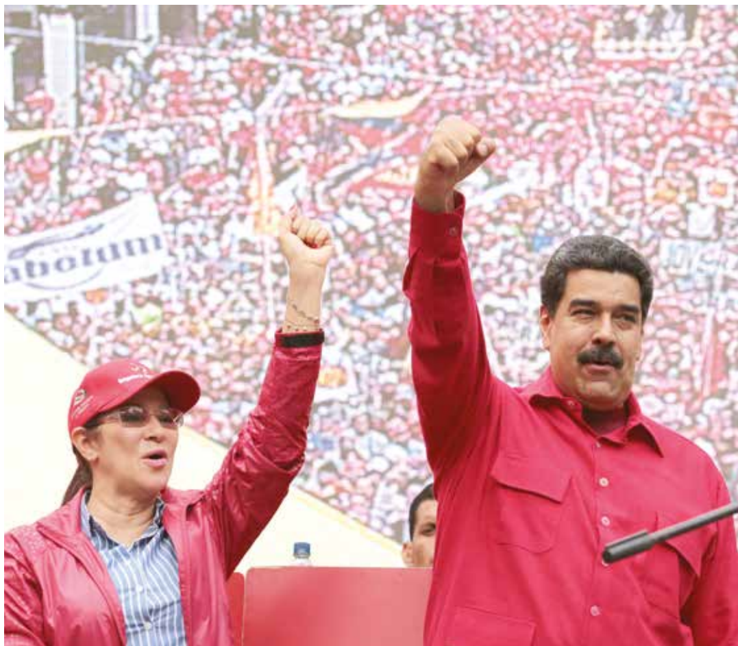
Los contratos representan una alternativa a los ingresos petroleros.

"El derecho a la paz para poder construir la felicidad colectiva y la igualdad de todos y de todas. El derecho a la paz es el derecho más grande junto al derecho a la soberanía nacional que debemos defender para poder mantener y construir nuestra libertad y nuestra independencia. Para nos ser esclavos más nunca del imperio yanqui asesino".