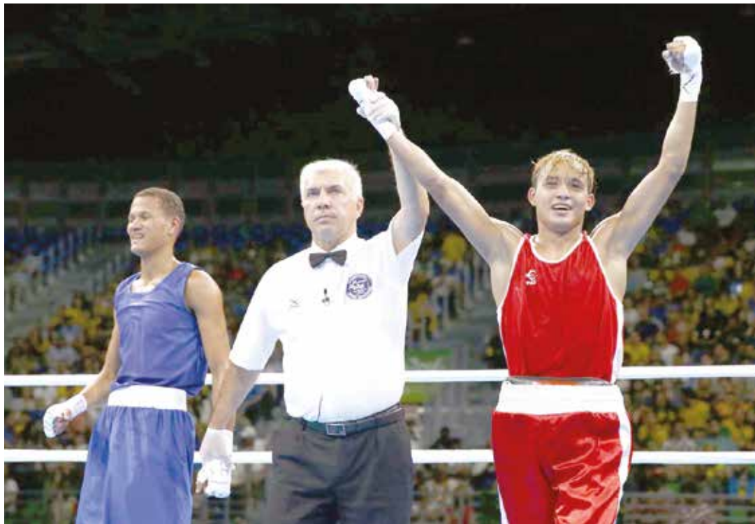
Finol saboreó el triunfo con apenas 19 años.