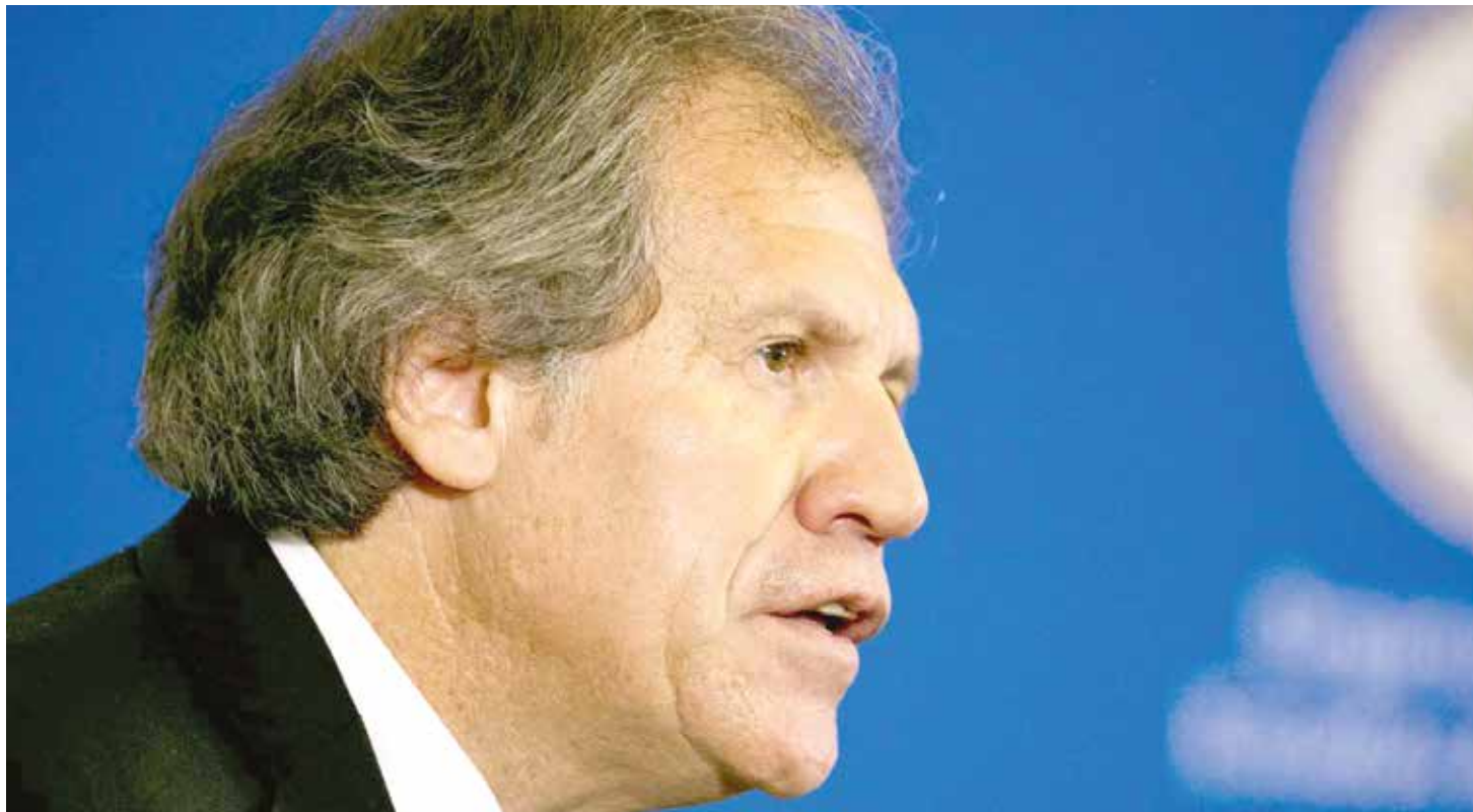
Almagro continúa su embestida contra Venezuela.

El escenario es bastante claro, "hay que derrocar al bolivarianismo a como dé lugar", sino es posible llevarlo a cabo mediante un proceso interno