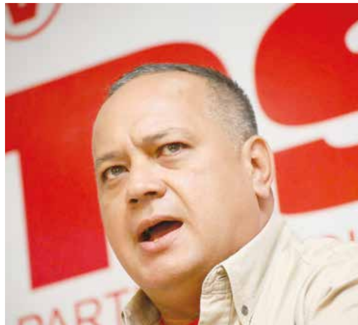
Cabello: No se viola el derecho de nadie.

Este problema no se trata de un simple problema de preferencias electorales entre funcionarios públicos. Es el hecho sólido, legal, de que en todos los contratos firmados