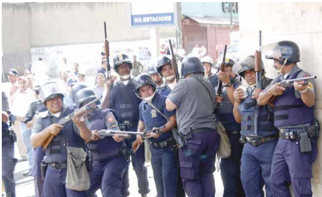
La CIA pretende reeditar el golpe de abril 2002.

Por "diversos recursos y medios" debe entenderse: (1) el paramilitarismo que ha inoculado el miedo en calles, barrios y pueblos de Venezuela con el apoyo financiero de la Embajada de Estados Unidos en Venezuela y de gobernadores pitiyanquis; (2) el sabotaje en la distribución de alimentos, medicinas y productos para el aseo que conlleva largas y humillantes colas; (3) la especulación traducida en bachequeo y sobrepuestos oficiales que generan una alarmante inflación inducida; (4) el ataque del Dolar Today al bolívar; (5) la transculturización sostenida; (6) la beligerancia des-