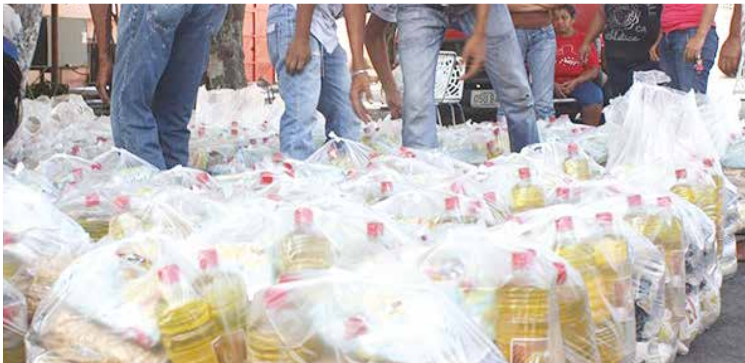
Desde los CLAP se enfrenta la guerra no convencional.

Aunque son pocas las fallas en comparación con los éxitos, se han detectado situaciones irregulares que hay que corregir en los CLAP y en algunos Estados Mayores parroquiales, porque "en esta coyuntura que atraviesa el país debemos tener cero margen de error".