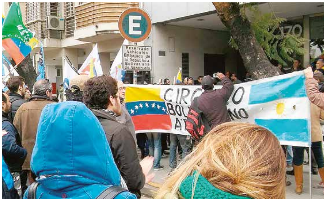
En Buenos Aires manifiestan a favor de Venezuela.

El primero de septiembre ya pasó y no pudieron repetir la embestida "a la brasileña", pero lo seguirán intentando, y cada vez que eso se produzca, habrá que recordar cómo se los frenó esta y otras veces: con el pueblo en la calle, pero también con la decisión de cortarles a los enemigos de la Revolución todas las posibilidades de generar el mal contra el heroico pueblo venezolano. Para ello, rodilla en tierra y a seguir por el camino que nos marcara Hugo Chávez. •