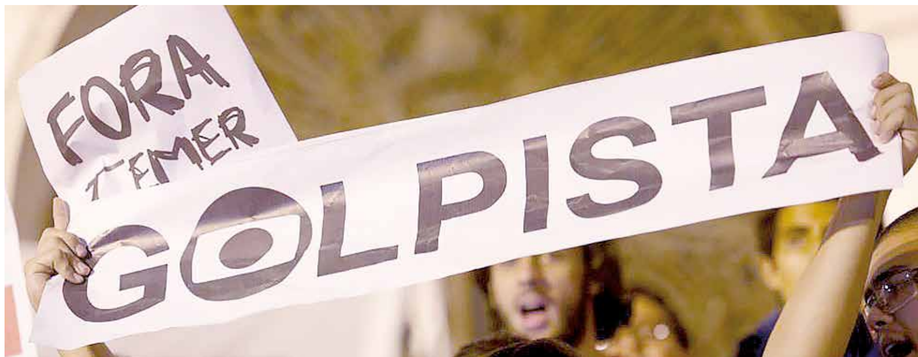
Un grupo de senadores torció la voluntad de todo un pueblo.