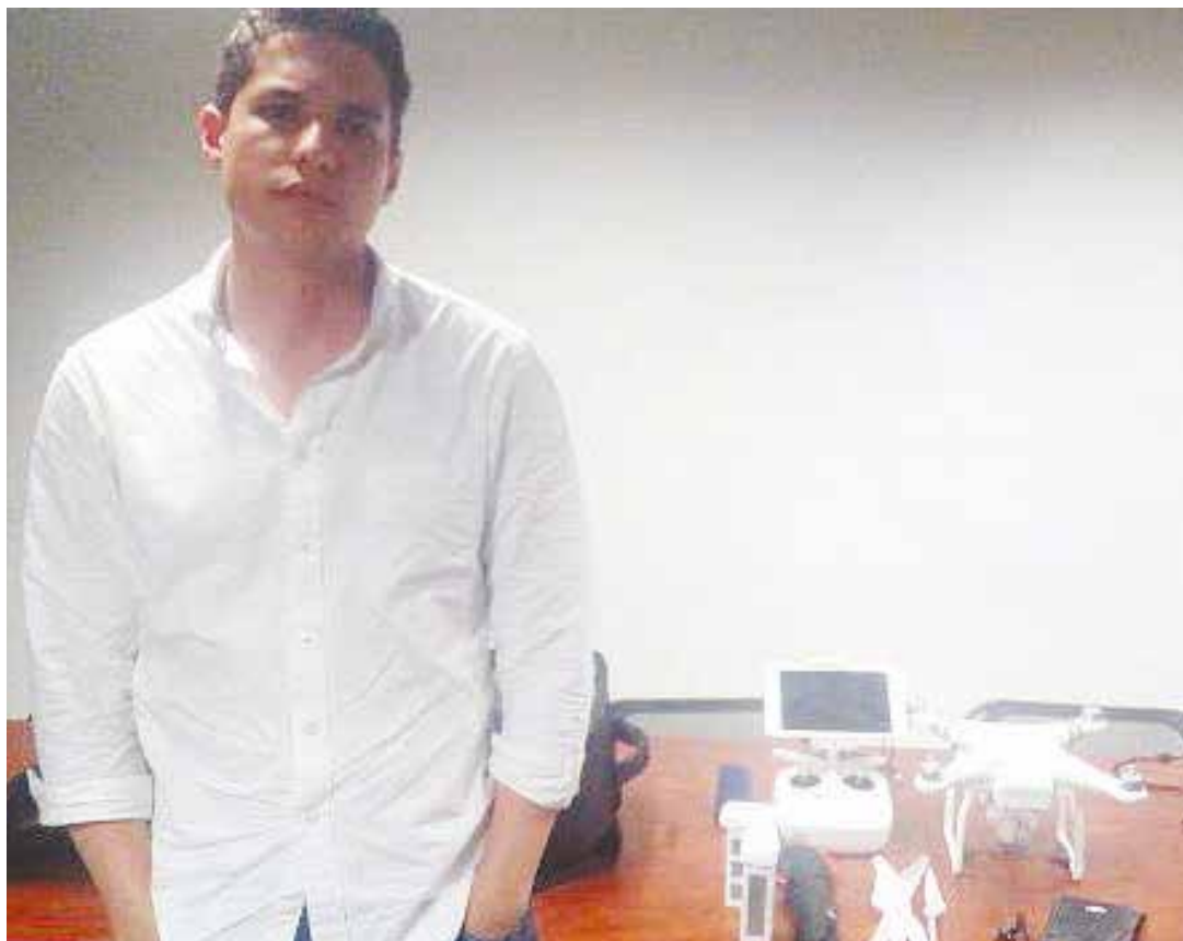
El dron y su operador.

Ferrelink es un un importador mayorista de productos de ferretería cuya sede en