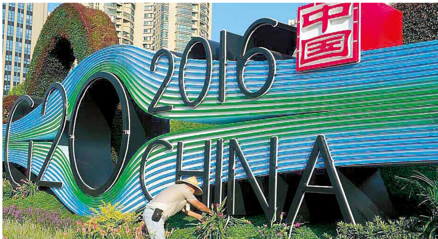
China alberga estos días la reunión del Grupo de los 20

La política exterior estadounidense se ha vuelto cada vez más agresiva para contrarrestar a sus nuevos enemigos