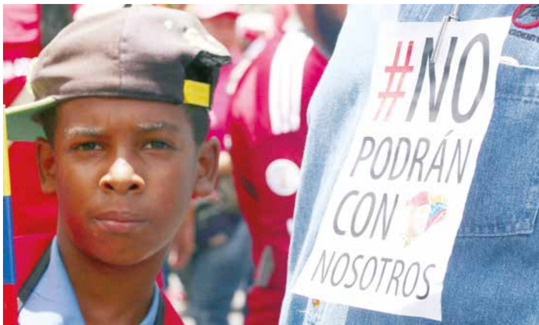
La juventud en la marcha

te en la avenida Bolívar de la ciudad capital.