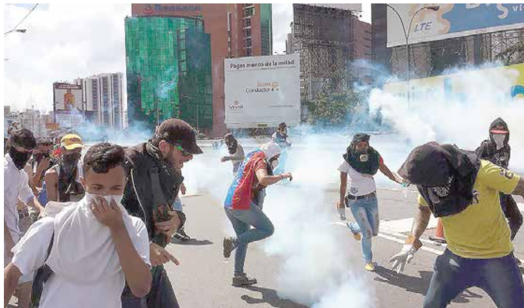
Al final de la marcha opositora, se impuso la violencia.

En nuestro análisis del 31 de agosto (trabajo que enviamos de lunes a viernes a varias listas de usuarios, vía internet), víspera de la susodicha marcha, escribimos: “¿Qué pensamos nosotros que va a ocurrir a estas alturas? Es un pronóstico difícil pero, como hemos dicho, hay que arriesgarse. Consideramos que a la derecha no le conviene que haya violencia vinculada al evento principal, la llamada “toma de Caracas”. Eso entrañaría para ellos demasiados riesgos, sobre todo porque para nosotros no tienen músculo para tumbar al Gobierno mañana, las condiciones son muy distintas a las del 11 de abril. Tampoco es de su conveniencia que haya muertos en ese escenario, porque se andan vendiendo en el mundo como demócratas pacifistas, mientras acusan al chavismo de violento. Acciones violentas en esa marcha les salpicarían a ellos también. Igualmente deben estar sacando cuentas de las advertencias del Gobierno y quizá no sea el momento de arriesgarse a sumar algunos de sus dirigentes a los políticos presos de la actualidad. Es mucho más probable que ensayen focos de violencia en otras latitudes, como lo ha planteado Vielma con referencia a Táchira. Focos que no tendrían tampoco la intención de tumbar al Go-