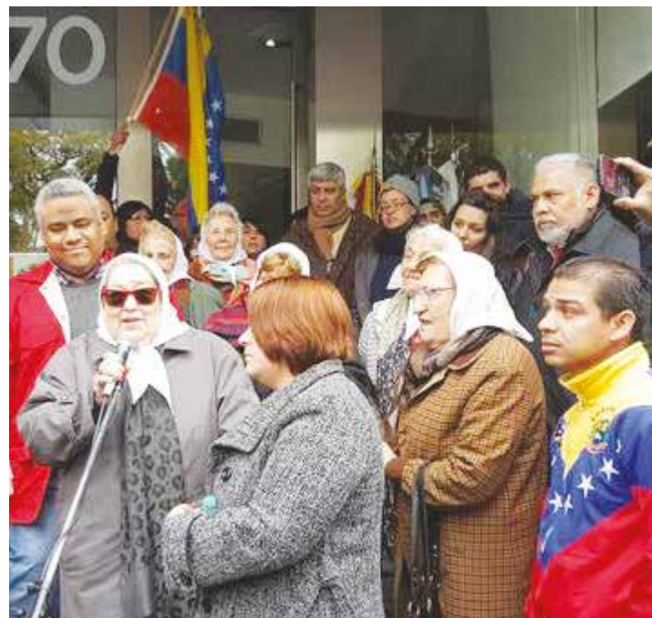
Solidaridad desde la Embajada de Venezuela

“ El primero de septiembre ya pasó y no pudieron repetir la embestida "a la brasileña", pero lo seguirán intentando, y cada vez que eso se produzca, habrá que recordar cómo se los frenó esta y otras veces: con el pueblo en la calle”