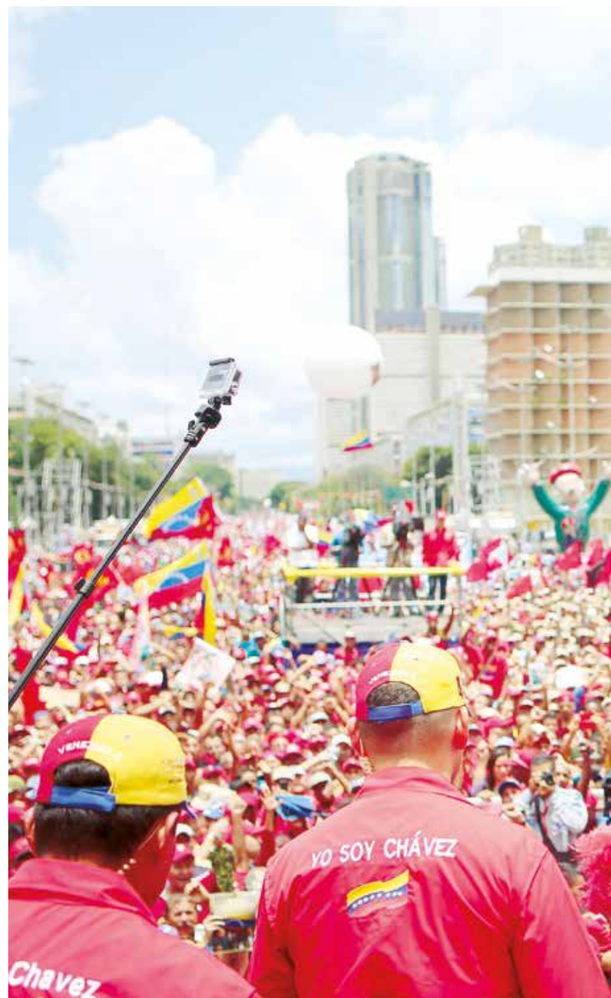
Maduro ante la multitud que se agolpó en la avenida Bolívar.