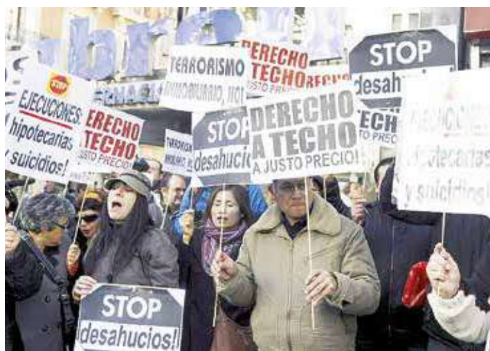
Muestras de la crisis social en Europa.

El chavismo ha producido un nivel de conciencia política en el pueblo revolucionario, que ha entendido que la