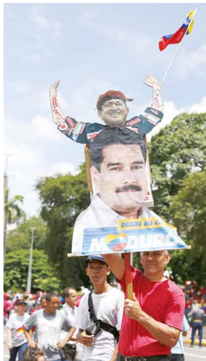
El ingenio popular se hizo sentir

Abastecimiento Soberano, los Consejos Locales de Abastecimiento y Producción, del fortalecimiento de la producción nacional. Debemos sustituir la economía rentista y acabar con las mafias distributivas y comercializadoras”, detalló el Presidente. •