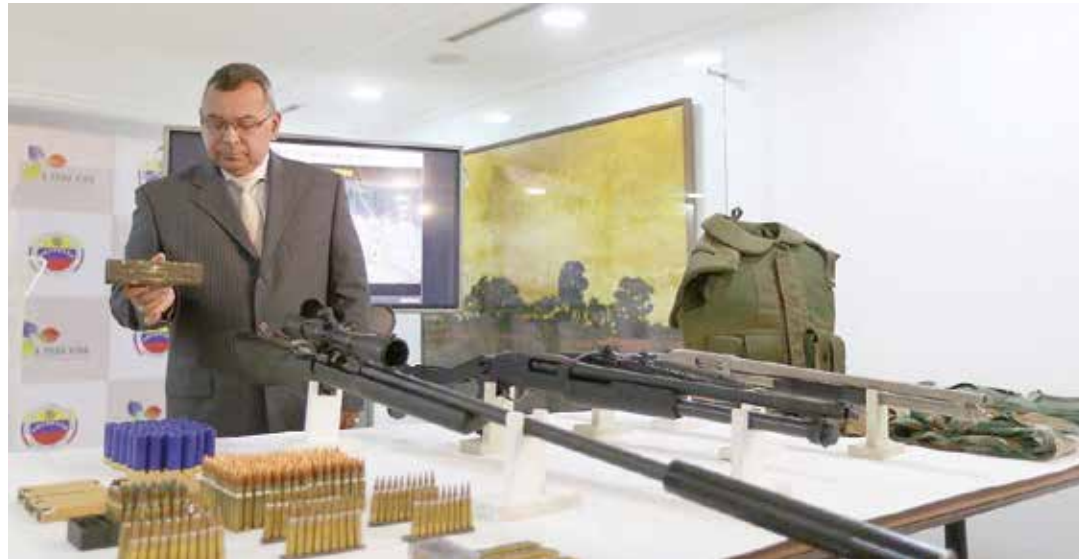
El ministro Reverol muestra las evidencias incautadas.

En la madrugada del 1 de septiembre fuerzas especiales de la Policía Nacional Bolivariana y del Cuerpo de Investigaciones Científicas Penales y Criminalísticas incursionaron en una zona montañosa de un sector denominado Tacagua, en la parroquia Sucre del Distrito Capital, a escasos