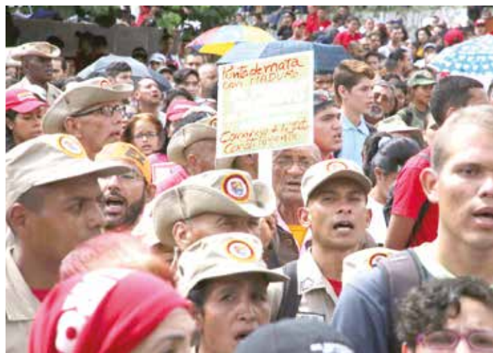
El pueblo en respaldo al Presidente Maduro.

“Si algún día la derecha quiere sentarse a conversar yo estoy listo, pero mientras tanto nosotros vamos a seguir trabajando todos los días con mucho amor”, aseveró. •