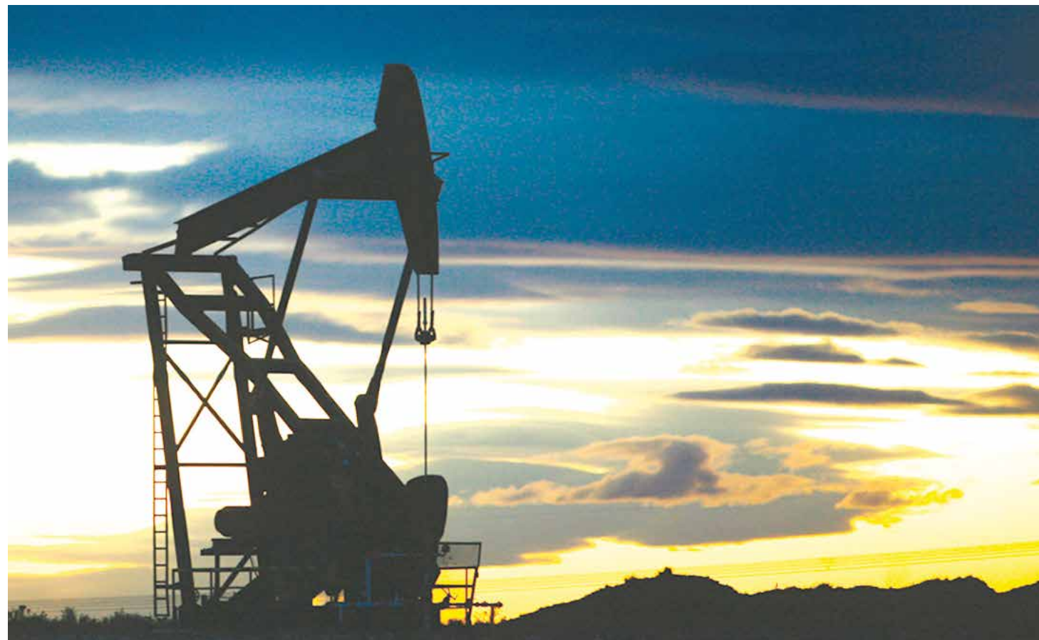
Se busca estabilizar el mercado petrolero.

Debemos comprender que en la dinámica perversa del capitalismo a escala internacional, la manipulación de los precios del petróleo es un arma geopolítica por excelencia. En el momento exacto en que se llevaba a cabo la ocupación militar de Afganistán e Irak, los precios del petróleo conocieron un auge sin precedentes. Ha sido quizá la década en donde el mercado petrolero mundial haya conocido su crecimiento más dinámico y estable durante muchos años. Si bien los países de la OPEP habían establecido un techo a su producción para empujar los precios al alza, la Organi-