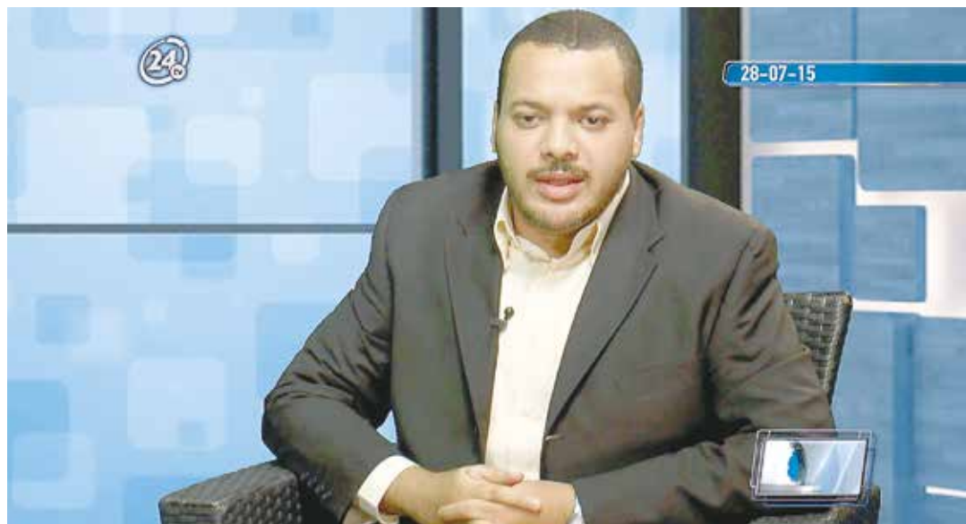
Hay que obedecer la Constitución.

Cumplir y hacer cumplir la Carta Magna, además debe garantizar la buena marcha