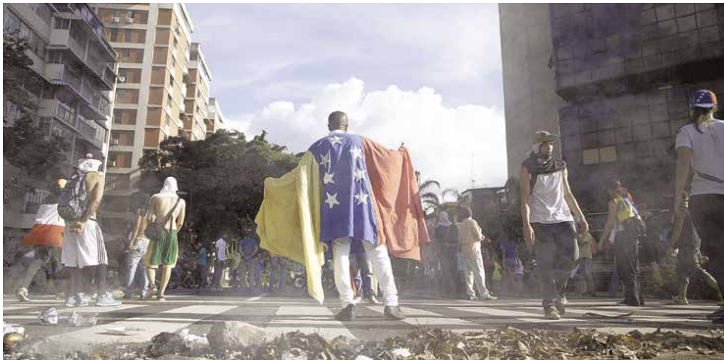
La oposición no cesa en su llamado a la violencia.