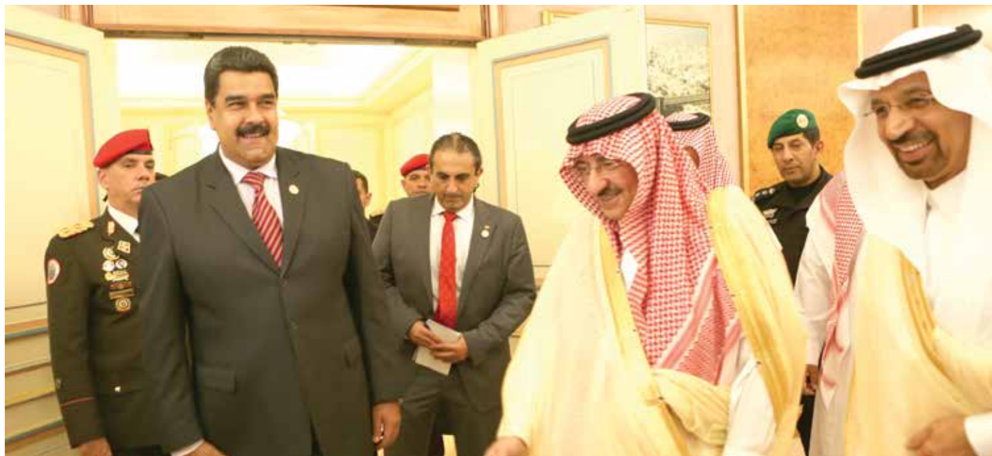
Presidente Maduro en defensa de los precios del petróleo.

“No gana nadie con los actuales precios del crudo, porque son millonarias las inversiones que se están dejando de hacer y bajo el actual modelo podría ocurrir un repunte extremo al cabo de pocos años por la caída de la producción que se generaría”, explicó al tiempo que fijó dos momentos para alcanzar la estabilidad deseada: el primero en los próximos seis meses en donde se espera lograr un equilibrio en la cotizaciones (que muchos analistas del sector sitúan entre 50 y 60 dólares el barril) y luego la creación de un mercado estable de cara a los siguientes diez años, en donde se pueda contar con precios estables que favorecen tanto a los consumidores como a las naciones productoras. “Estamos trabajando en una fórmula nueva para la estabilidad de los precios para los próximos 10 años. Hay que pasar de la ruta de los seis meses de estabilización, la cual estamos