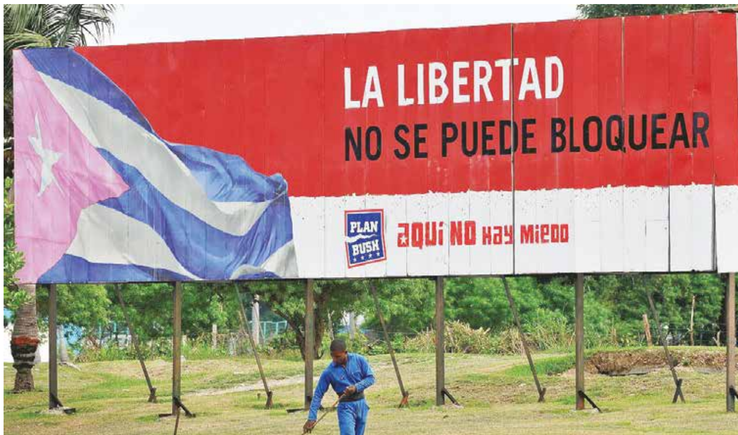
El férreo cerco se mantiene.

Resaltó que aunque el presidente Obama tiene amplias facultades ejecutivas para modificar las regulaciones del bloqueo, solo se han aplicado algunas medidas positivas,