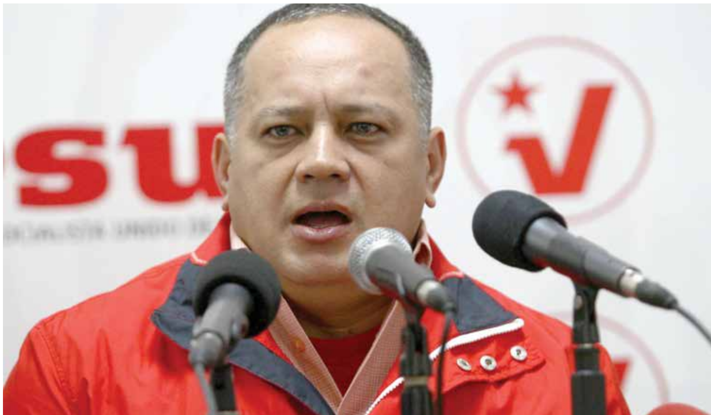
Diosdado Cabello alertó sobre el golpe en desarrollo.