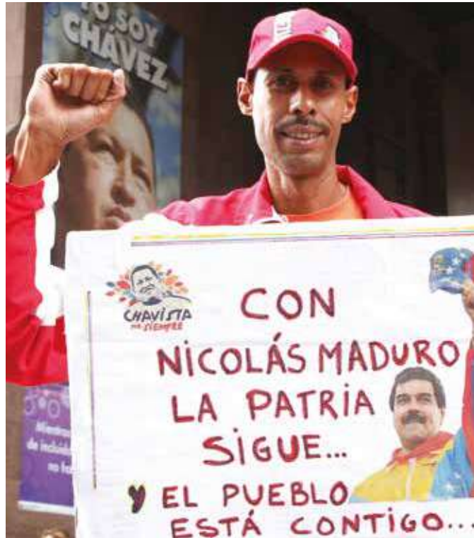
El pueblo movilizado en defensa de la Revolución.

De hecho, una reseña de la agencia española de derecha EFE, deja en claro lo que estamos señalando: "El ambiente en las calles del este de la capital, y especialmente en la autopista Francisco Fajardo de Caracas que une al este con el oeste del país, la principal arteria vial de la capital venezolana, era esta vez de caras de descontento y frustración". La agencia reporta que cuando los voceros políticos opositores hablaban desde la tarima, los asistentes a la manifestación los retaban con consignas como "No tenemos miedo", "Si ustedes no van, nos vamos nosotros", "Ustedes están cagados, el pueblo está restreado". EFE añade que los manifestantes "lanzaron un rotundo ¡No! cuando el secretario ejecutivo de la MUD, Jesús Torrealba, mencionó la palabra diálogo". Según este reporte, "El portavoz de la alianza habló de la posibilidad de que la lucha contra el Gobierno también sea llevada a una mesa de diálogo con el chavismo con la intermediación del Vaticano y una comisión internacional, lo que fue rechazado de plano por la audiencia. "Hoy es el día, el pueblo está