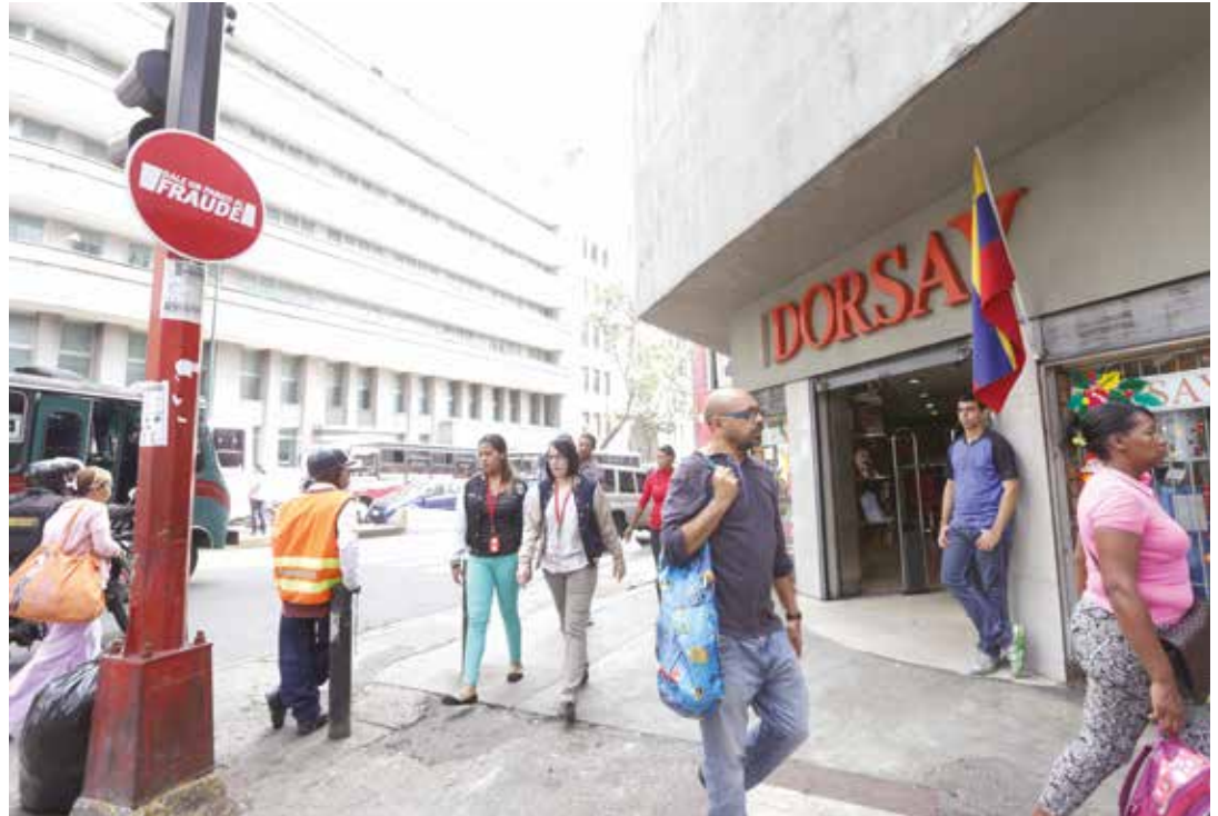
La normalidad se vivenció en las calle del país.

A pesar de que la oposición calificó el Paro como un "éxito" en Caracas, las panaderías, farmacias, supermercados estaban abiertos y en el resto del país, el paro se cumplía a medias. "La dirigencia opositora lo único que busca es la ruina del país. No piensan en su gente que debe trabajar para llevarse un pan a la boca", expresó Miguel Acevedo al