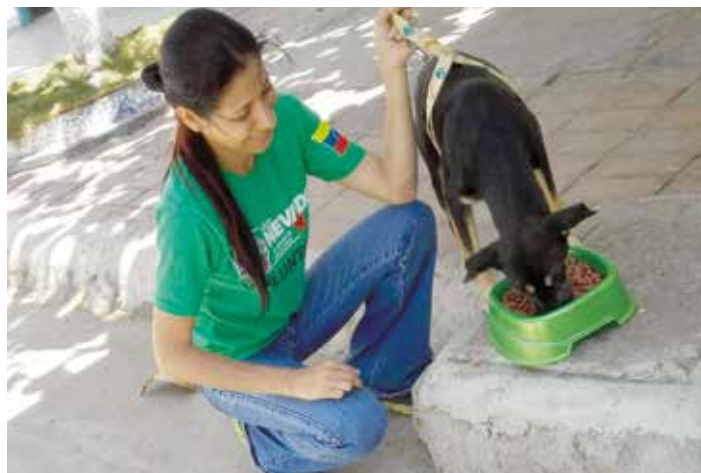
El proteccionismo está cobrando seguidores.

¿Y cómo relacionamos este bienestar animal con nuestra Revolución Bolivariana? El 4 de enero de 2010 se promulgó la ley para la Protección de Fauna Doméstica, Libre y en