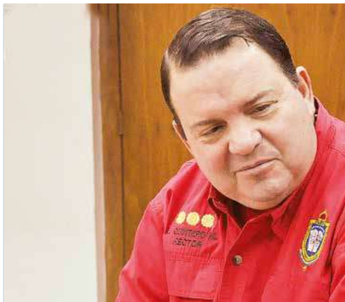
El pueblo debe estar alerta ante las amenazas.

la Aviación, Luis Quintero, rector de la Universidad Nacional Experimental Politécnica de la Fuerza Armada Bolivariana (UNEFA), no resultan inexplicables estas acciones. Se trata de un esquema imperial, probado recientemente en naciones como Libia y Siria- en donde se sigue un modelo destinado a la destrucción de los países con la intención de controlar sus recursos naturales. "Es una estrategia de guerra no convencional en donde el imperio norteamericano no actúa directamente con tropas, sino que intenta subvertir el orden en una sociedad mediante la promoción del enfrentamiento entre sus propios ciudadanos", explica. Con ese fin cuenta con agentes locales encargados de generar desórdenes y sabotear todas las actividades del Gobierno, principalmente las relacionadas con la actividad económica con la intención de generar un colapso. Desde esta perspectiva, resultaba útil para una Asamblea que no está alineada con los intereses nacionales hacer que fracasara la operación