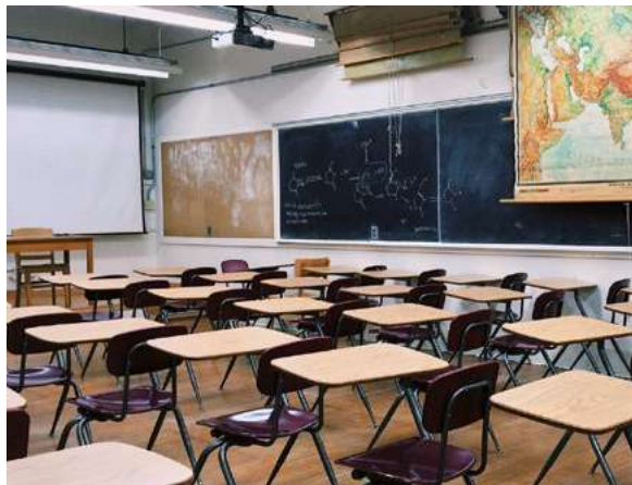
La Unesco constató que se necesitan 44 millones de profesores de todos los niveles de enseñanza.

La Unesco recomendó acciones dirigidas a hacer más atractiva esta labor, entre ellas invertir en la formación inicial del profesorado y en programas de desarrollo continuo, implementar iniciativas de orientación y garantizar que reciban salarios y prestaciones competitivos.