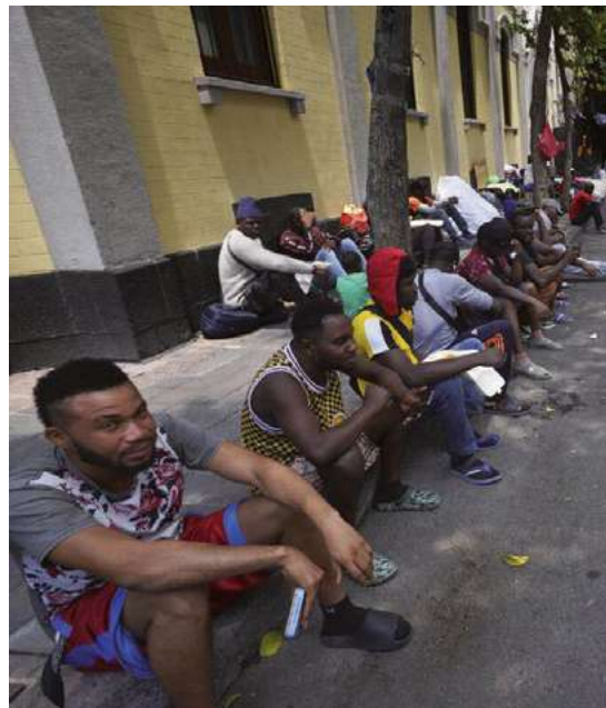
México propuso una reunión con los países más afectados de la región.

Por Luis Manuel Arce Isaac Corresponsal/Ciudad de México