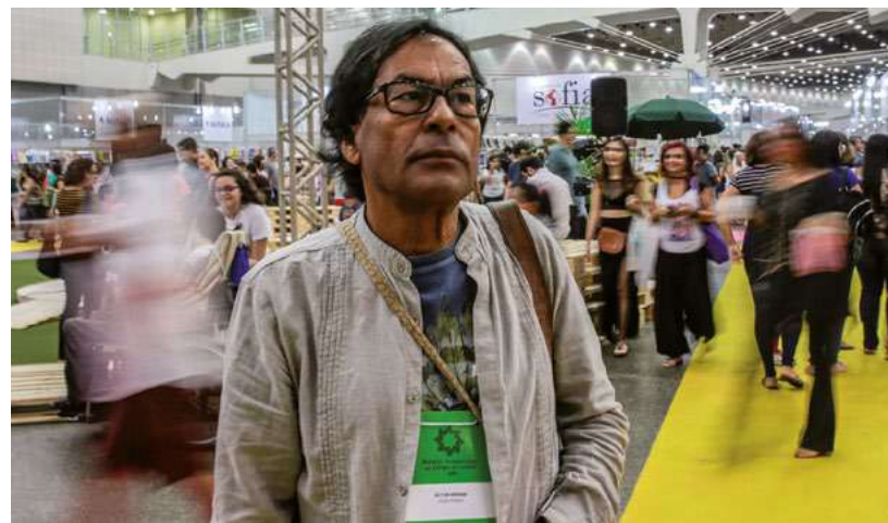
Literato y activista social, Ailton Krenak fundó la organización Núcleo de la Cultura Indígena.

Según el portal G1, el autor de diversos libros como Ideas para posponer el fin del mundo , La vida no es útil y El Mañana no está a la venta tiene obras traducidas en más de 13 países. Actualmente vive en la reserva indígena Krenak, en el municipio Resplendor (Minas Gerais).