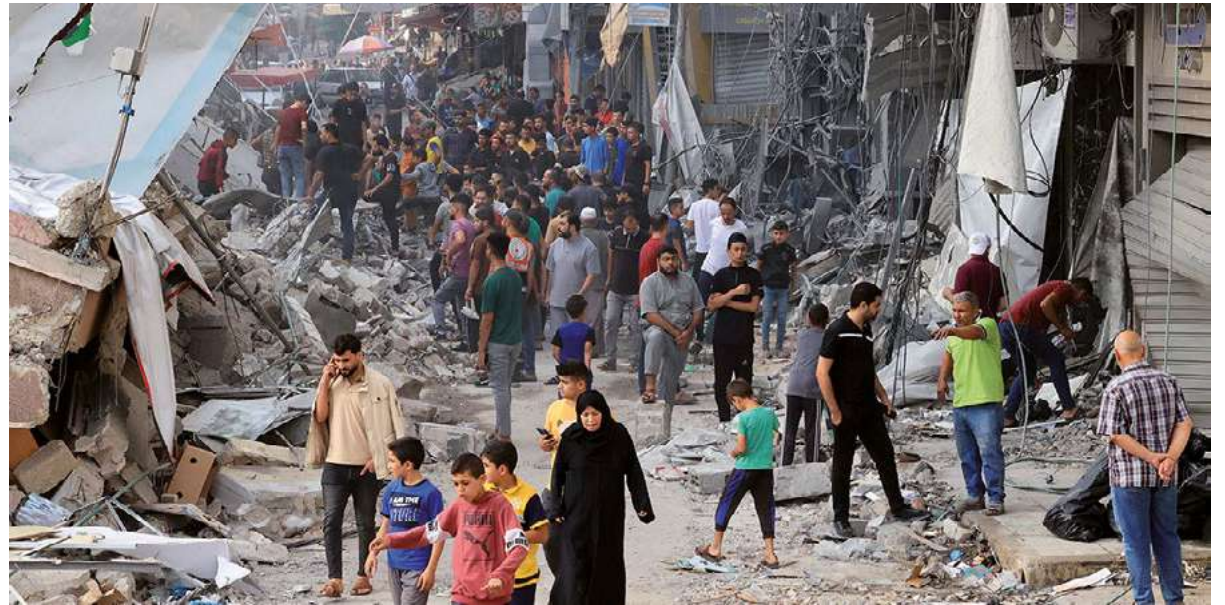
Israel reedita desde hace años en la Franja de Gaza la política de tierra arrasada, ahora intensificada.

Ambos casos son solo muestras de la virulencia con la que Tel Aviv actúa contra la Franja de Gaza, revestida además de una crueldad sistemática.