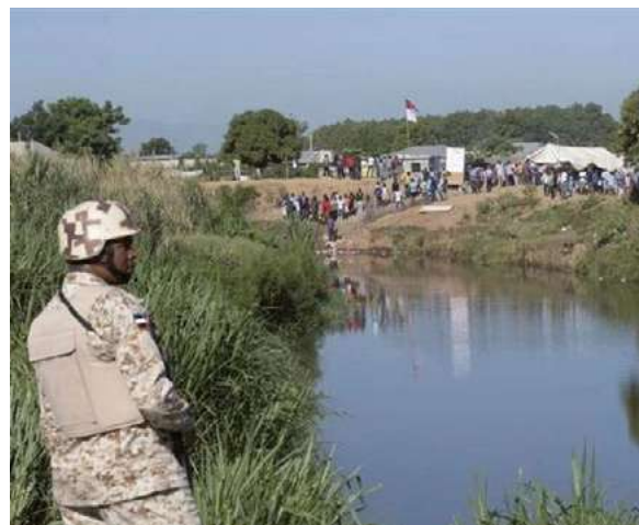
El río Dajabón, donde convergen territorios de Haití y República Dominicana.

Se estima que en esta nación (República Dominicana) residen cientos de miles de haitianos, en tanto cada día llegan a las fronteras –ahora cerradas en su totalidad– miles de personas en busca de refugio, aunque en su gran mayoría son devueltas.