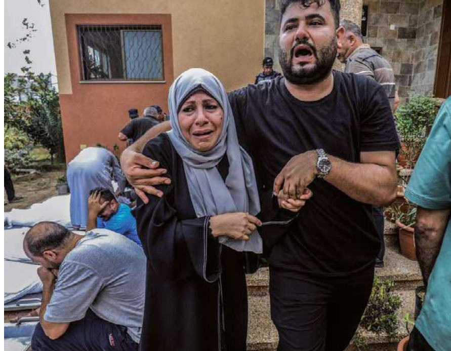
La masacre de Palestina y la coincidente furia natural en Acapulco parecen indicar la urgencia de acciones a favor de la vida.

Es necesario entender que Gaza y Acapulco no son fenómenos ajenos, extraños en sí y para sí