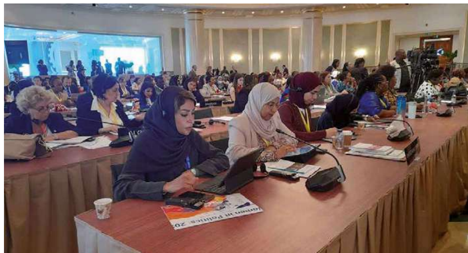
Se abordaron asuntos como la insuficiente presencia de mujeres y jóvenes en las políticas.

Como exhortó el presidente angoleño, João Lourenço, en la inauguración del evento, desde Luanda se escuchó la voz de los parlamentarios del mundo pidiendo el fin de los conflictos.