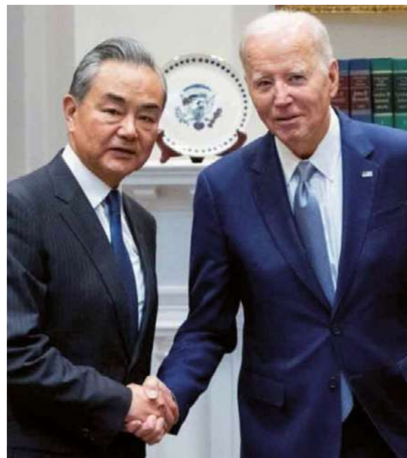
Wang y Biden apuestan por mantener abiertas las líneas de comunicación.

Estados Unidos, consciente del pujante rol mundial que tiene hoy China, al parecer intenta suavizar tensiones en un contexto de graves turbulencias globales.