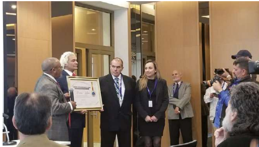
El presidente del Congreso Hispanoamericano de Prensa entregó a Prensa Latina un reconocimiento por su labor durante 65 años.

Díaz-Canel apuntó que esa iniciativa, liderada por Fidel Castro en los días fundacionales de la Revolución, constituye un "hecho deslumbrante por su osadía y un desafío para los tiempos que corren; de ella tomamos su vigencia en tiempos de políticas hegemónicas, de colonización cultural y de inteligencia artificial", remarcó.