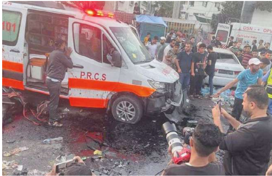
Los ataques a personal y medios de la asistencia humanitaria internacional continúan, pese a denuncias.

"Las condiciones humanitarias empeoran a medida que continúa la guerra y el acceso de ayuda está restringido en gran medida", alertó el representante en un comunicado.