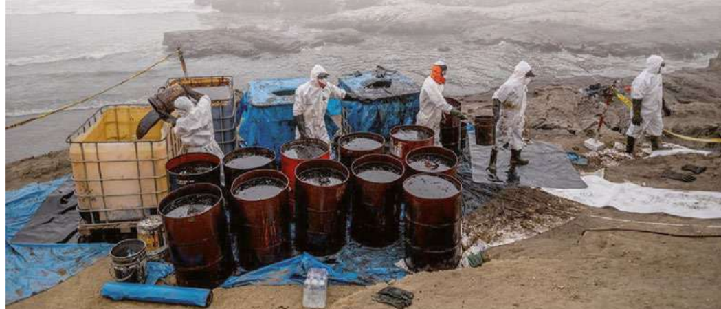
La demanda ciudadana exige reparaciones por daños a las víctimas y al medioambiente marino.

Por Manuel Robles Sosa Corresponsal/Lima