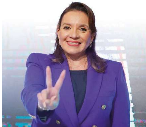
Presidenta Xiomara Castro, en su tercer año de mandato.

"Pueblo hondureño, para defender nuestros triunfos y garantizar que las próximas elecciones sean libres y transparentes, debemos mantenernos en movilización", manifestó Castro.