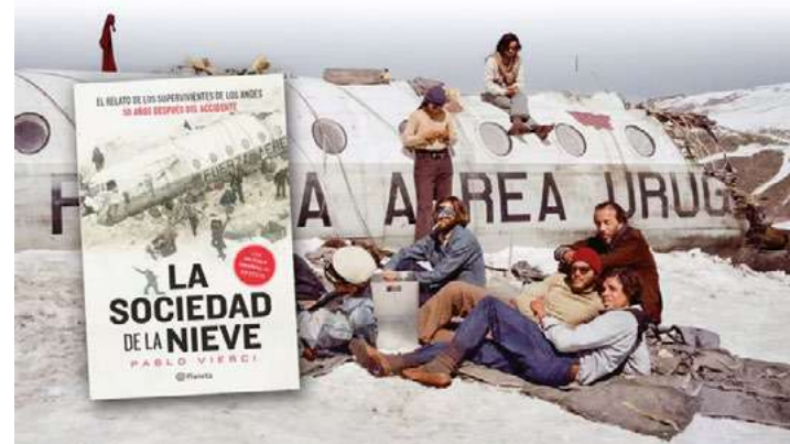
La odisea y el dramático rescate de los supervivientes alimentan el relato literario y cinematográfico.

Desde 2022, para Uruguay y en América Latina, el texto lo edita Planeta, que ese año sacó la edición por el 50 aniversario del accidente del vuelo 571 de la FAU. Después se publicó con el diario El País en Uruguay, y se agotó también.