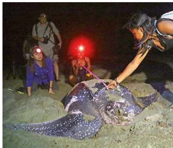
Los miembros de la comunidad veneran y protegen a los enormes ejemplares especie de crustáceos.