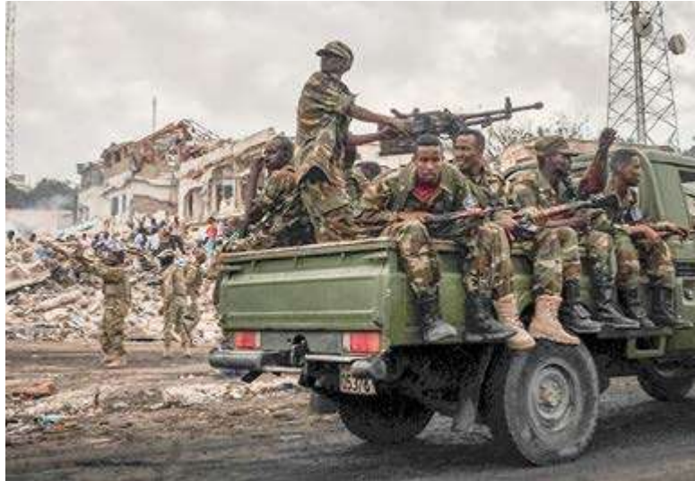
Los conflictos armados internos agudizan la situación humanitaria provocada por las catástrofes naturales.