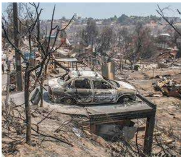
Los incendios de Valparaíso ocasionaron 134 muertos y más de 18 mil damnificados.

Los siniestros en la región de Valparaíso dejaron 134 muertos, cientos de heridos, entre ellos, una treintena en estado crítico, miles de viviendas calcinadas y unos 18 mil damnificados.