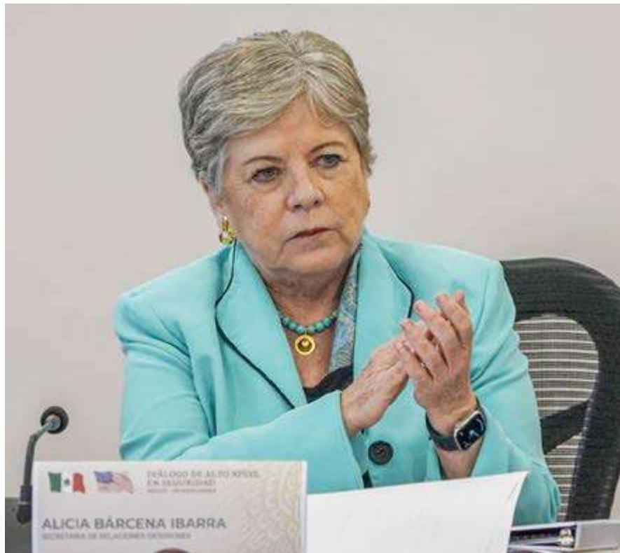
Los migrantes no son delinquentes, sino ciudadanos en movilidad laboral, advirtió Alicia Bárcena en el pleno de la Celac.

Mundial, para atacar las causas sociopolíticas de la migración. Estados Unidos no piensa hacerlo.