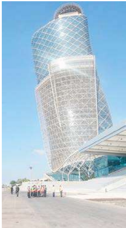
La torre Capital Gate tiene una altura de 160 metros y 35 pisos, ocupados por oficinas hasta el nivel 17 y, a partir del 18, el lujoso hotel Andaz.

Atracción turística y parte del Abu Dhabi National Exhibition Centre, el Capital Gate comenzó a ser realidad en 2007 con el inicio de su construcción, que se prolongó hasta 2011, aunque un año antes de la inauguración recibió el Guinness al edificio más inclinado del mundo.