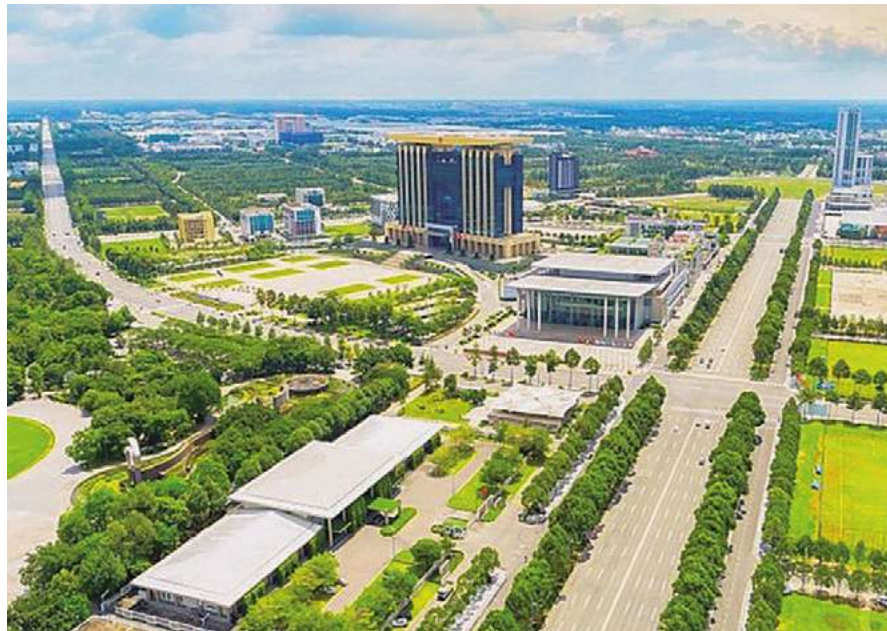
La economía digital se aprecia en Binh Duong, una de las típicas comunidades inteligentes del mundo.

Por otro lado, el mercado financiero-monetario, sobre todo el inmobiliario, la bolsa de valores y los bonos corporativos, tendrán un comportamiento muy complejo y están latentes muchos riesgos. Igualmente, alertó, varios bancos comerciales, empresas y proyectos importantes atravesarán