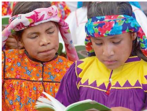
Apenas un 10 por ciento de los naturales de pueblos ancestrales entienden su propio idioma.

Por Adriana Valdés y Carmen Esquivel Corresponsales/Quito y Santiago de Chile